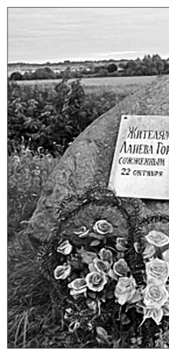
Памятник на месте сожжённой деревни Ланева Гора.

во, упомянутого на обелиске, выступил в качестве свидетеля на Международном военном трибунале в Нюрнберге.