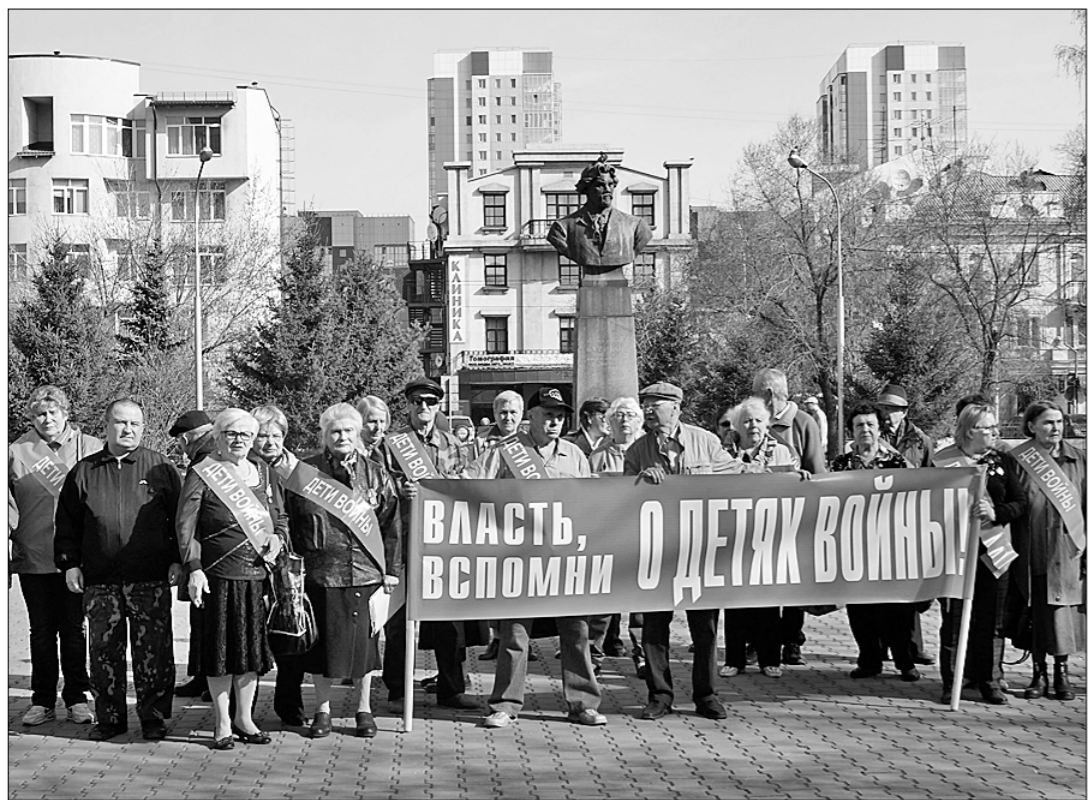
В Красноярске в сквере имени В.И. Сурикова, актив регионального отделения организации «Дети войны» провёл пикет.

УЧАСТНИКИ АКЦИИ в очередной раз решили привлечь внимание общественности к бедственному положению поколения, опалённого войной. Свои требования пикетчики выразили в транспарантах с простыми словами: «Дайте нам достойную жизнь!»