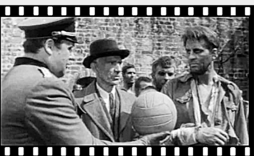
Кадры из фильма «Третий тайм».