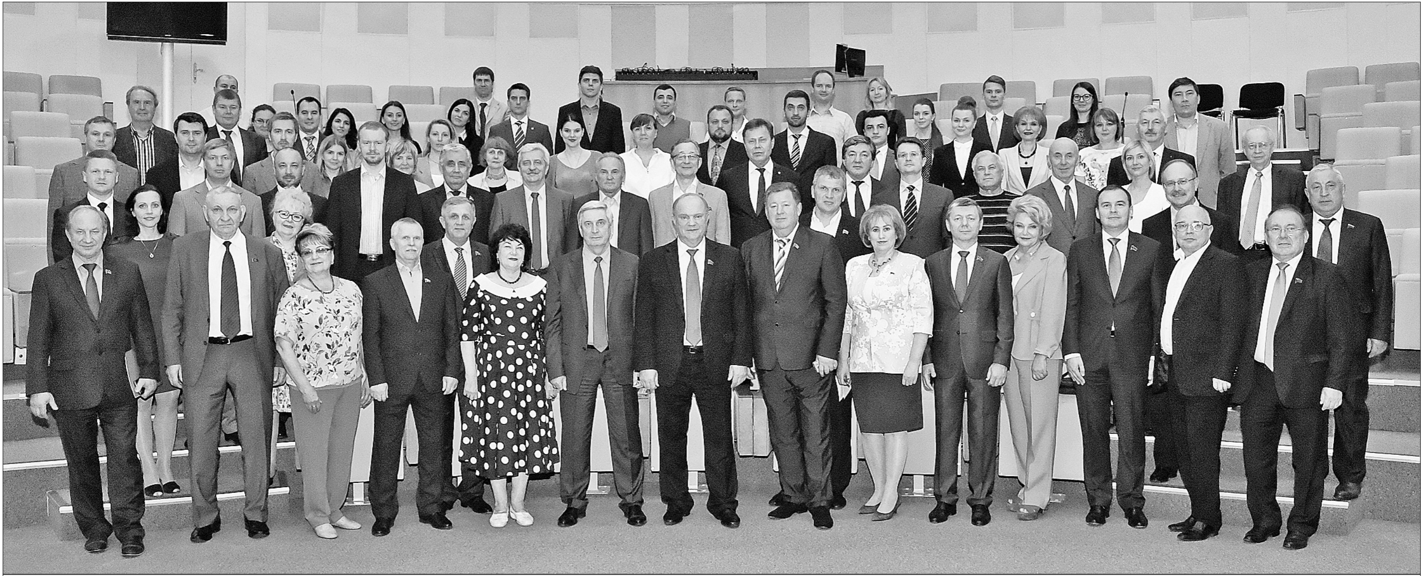
● Фракция КПРФ перед заседанием Государственной думы.