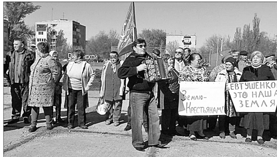
На народный пикет сельчане выходят с аккордеоном.