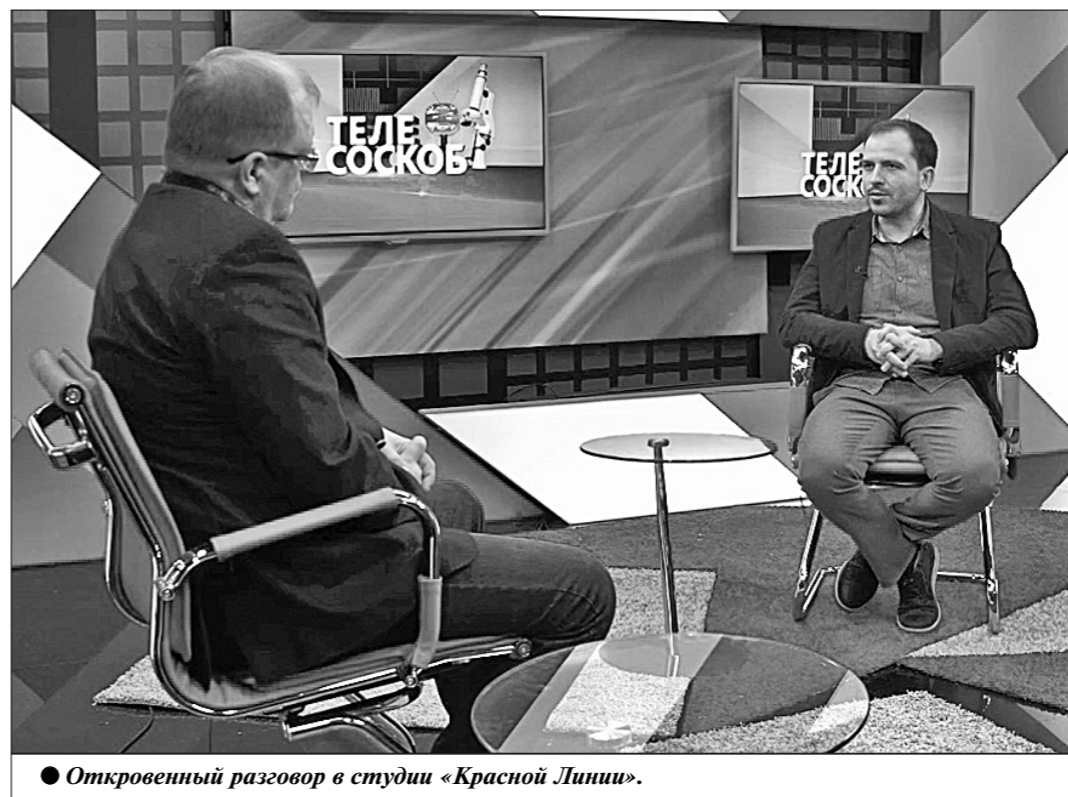
● Откровенный разговор в студии «Красной Линии».

— В том, что бытие в России якобы надо строить на руинах советского строя, на отрицании ценностей советской истории, которая отрицается тотально, за исключением, быть может, только периода Великой Отечественной войны. Но и это, думаю, временно. Ведь та реальность, которая гидравлическим прессом опустилась на нас в 1991 году, непоставима с тем, за что люди отдавали свои жизни в 1941—1945 годах. Национальная идея у капитала проста: строить рыночное капиталистическое общество, основанное на неравенстве между людьми, на приобретающей всё более катастрофические пропорции несправедливости. — А тебе не кажется, что в последнее время отношение власти имущих к советскому опыту, скажем, 1970—1980-х годов несколько изменилось к лучшему? — Важно понять, почему кому-то так кажется. Во-первых, если в условиях рынка потребитель ностальгирует по салату «Оливье» и программе телепередач на Новый год, то бизнес такой запрос обязательно удовлетворит. Торговля памятью в рыночных условиях неизбежна. Во-вторых, предпринимает-