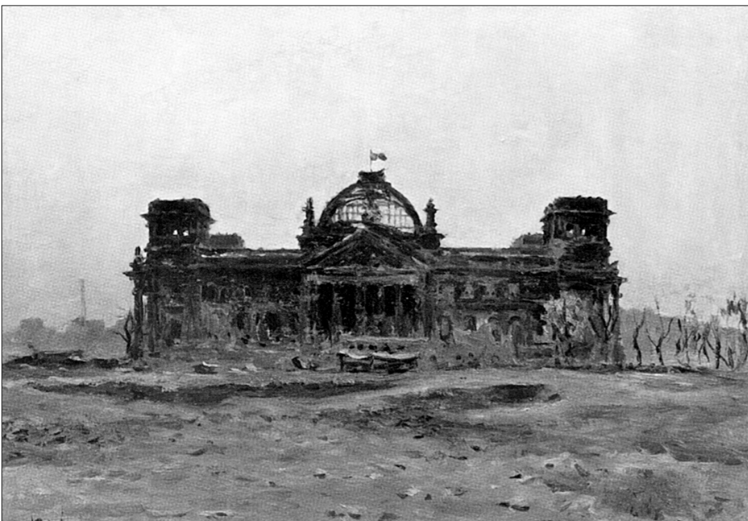
● Рейхстаг. 1945 год.

«Я очень спешил прибыть к началу наступления на Берлин... — вспоминал позже художник. — В политуправлении фронта, где я изложил свою просьбу, ко мне отнеслись с недоумением: «Что это вы все на Берлин! Разве других участков мало? Вот поезжайте в ту часть, которая должна встретиться с союзниками». Как ни интересно было быть очевидцем встречи с союзниками, как ни интересно было быть свидетелем встречи с союзниками, как ни интересно было быть свидетелем встречи с союзниками, как ни интересно было быть свидетелем встречи с союзниками...»