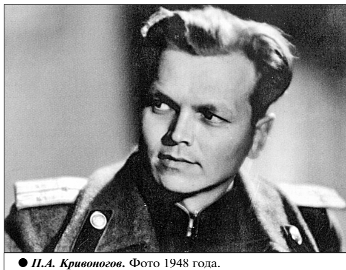
● П.А. Кривоногов. Фото 1948 года.