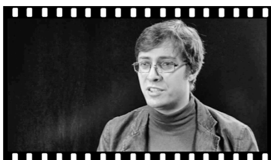
● Кадры из фильма «Эти...»

Только мы почему-то об этом не логарываемся. До тех пор, пока они не начинают нас убивать. По-настоящему. Насмерть. И каждый день. Каждый год. Каждый век. Всегда. Появляются ЭТИ.