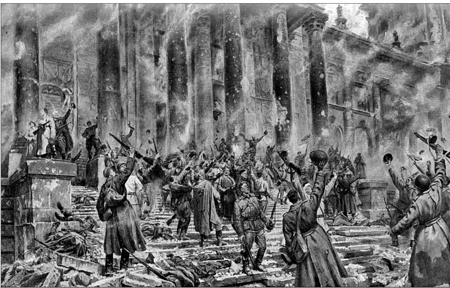
● Победа. 1948 год.