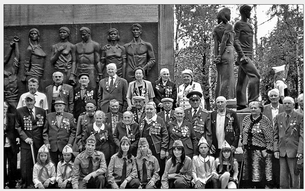
Члены военно-патриотических клубов Курской области и ветераны Великой Отечественной войны у памятника молодогвардейцам в г. Льгове.

важных для всего Союза, подпитывая через Каспий людскими резервами, техникой и продовольствием защитников Кавказа и Сталинграда.