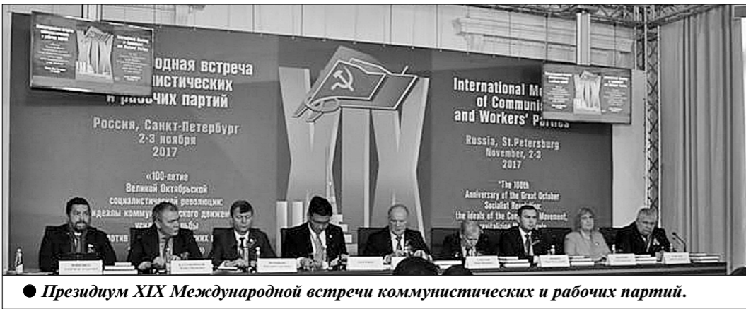
Президиум XIX Международной встречи коммунистических и рабочих партий.