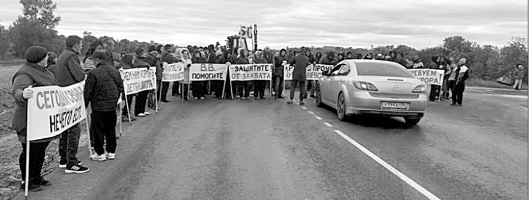
Работники расположенного в Оренбуржье свиного комплекса «Вишнево-ский» устроили пикет и перекрыли движение на одной из областных трасс, соорудив на ней импровизированный загон со свиньями.

КОЛО СТА ЧЕЛОВЕК стояли с плакатами: «Руски прочь от Вишнево-ского!», «Чем нам завтра кормить детей?», «Требует прокурора!», «Сохранить предприятие!».