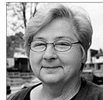
поддержку коммунистам страны.

КАК ПОДЧЕРКНУЛА партийная газета «Пилпз вэйс» («Голос народа») в приветствии к делегатам XXXVIII съезда, Компартия Канады, одна из трёх старейших политических организаций в стране, на протяжении вот уже 95 лет демонстрирует удивительную стойкость и оптимизм, преодолевая огромные препятствия и отражая ожесточённые атаки. Практически каждое прогрессивное требование, с которым выступали трудящиеся Канады, первоначально было сформулировано и выдвинуто коммунистами, в том числе право на организационную профсоюзность, бесплатное медицинское обслуживание, гендерное равенство, пенсионное обеспечение, страхование занятости, самоопределение коренных народов, обеспечение избирательных прав.