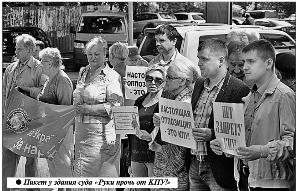
● Пикет у здания суда «Руки прочь от КПУ!»

ЧЕМУ призвана служить эта уникальность, можно проследить по последним событиям в украинских судах. Так, образцы высокого профессионализма демонстрирует Киевский апелляционный административный суд, который использует малейшую возможность затягивать процесс и не позволить Компартии Украины защитить своё честное имя. На его предпоследнем заседании по сути апелляционной жалобы КПУ на решение Окружного администра-