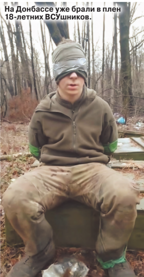
На Донбассе уже брали в плен 18-летних ВСУшников.

Тяжело найти укрытия для работы дронов, — отмечает Зимовский. «Хотя не исключено, что «Восточные» после Великой Новоселки повернут на запад и ударят в сторону Гуляйполя в Запорожской области», — пишут эксперты канала. «Хотя не исключено, что «Восточные» после Великой Новоселки повернут на запад и ударят в сторону Гуляйполя в Запорожской области», — пишут эксперты канала.