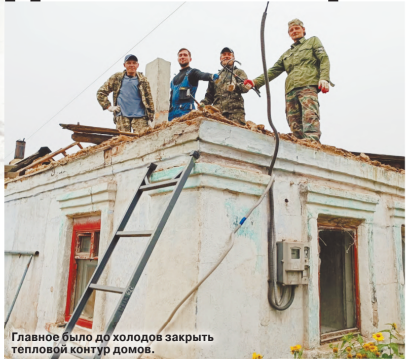
Главное было до холодов закрыть тепловой контур домов.