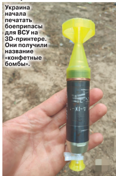
Украина начала печатать боеприпасы для ВСУ на 3D-принтере...

Эксперт подсказал способы борьбы с опасными боеприпасами