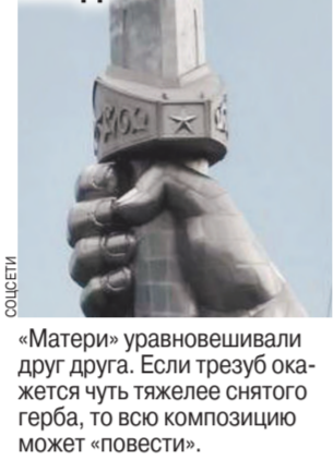
«Матери» уравнивали друг друга. Если звезду окажется чуть тяжелее снятого герба, то всю композицию может «повести».