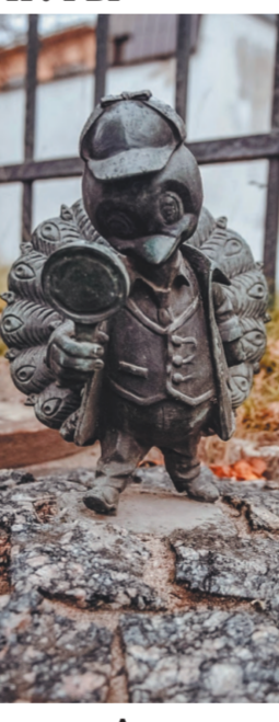
участок. Администрация города оценила ущерб в 217 тысяч рублей. Чиновники очень переживают за оставшиеся на территории города 11 скульптур павлинчатых профессий. Все они были установлены в период с 2019-го по 2021 год и уже очень полюбили горожанам. По факту исчезновения скульптур полицейские возбудили уголовные дела по статье «Кража».

Кражу бронзовых тематических мини-скульптур расследуют сыщики подмосковного Серпухова. Как стало известно «МК», 24 июля сотрудники администрации города обнаружили, что от входных ворот стадиона «Труд» в проезде Мишина пропала мини-скульптура «Павлинок-спортсмен», установленная в 2019 году. Злоумышленники действовали нагло — они спилили статую с постамента, закрепленного на брусчатке. В момент написания заявления в полицию выяснилось, что это не единственная кража. Также был похищен и бронзовый родственник «спортсмена» — «Павлинок-следопыт» от здания местной прокуратуры на улице Ворошилова. Просмотр камер видеонаблюдения, сыщики установили мужчину 40 лет (в куртке, штанах черного цвета и белой кепке), за спиной которого был рюкзаком. Сейчас активно ведется его розыск. Полиция уверена, что скульптуры похищены с целью сбыта как цветной металл, однако не исключают, что преступник решил украсить свой дом или садовый