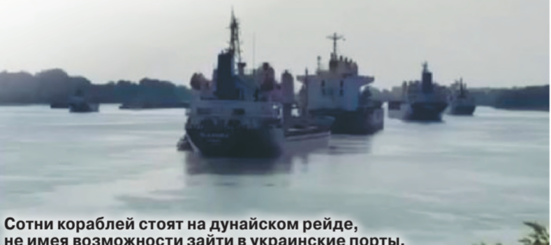
Сотни кораблей стоят на дунайском рейде, не имея возможности зайти в украинские порты.