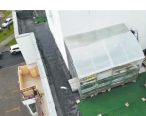
Москвичи не заметили полета дрона.

Тщательно замаскированную аккуратную теплицу прямо на крыше новостройки в Красногорском городском округе обнаружил дрон, запущенный специалистами Госжилинспекции. Механизм, который должен фиксировать строительные и коммунальные недочеты вплоть до отваливающейся фасадной плитки, «разглядел» спрятавшийся за технической постройкой парник, крыша которого имитировала продолжение его кровли. Чудо-огородец расскрепчен на холме дома в деревне Аристово. Сземли обнаружить теплицу было невозможно, зато с высоты птичьего полета открывался прекрасный вид на «самострой». Парник с белой крышей очень органично примыкает к техническому помещению,