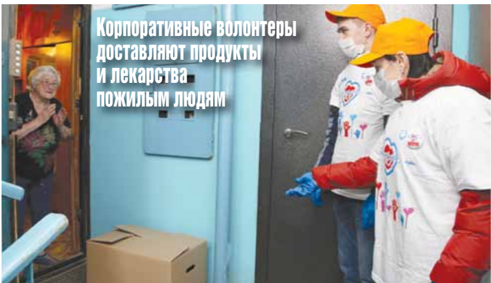
Корпоративные волонтеры доставляют продукты и лекарства пожилым людям