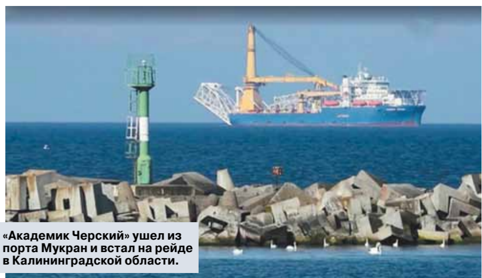
«Академик Черский» ушел из порта Мукран и встал на рейде в Калининградской области.

До конца текущего года американские сенат и палата представителей договорились о новых ограничительных мерах в отношении проекта, которые должны быть включены в закон об оборонном бюджете США на 2021 год: они затронут страховые и сертификационные