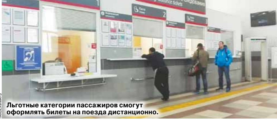
Льготные категории пассажиров смогут оформлять билеты на поезда дистанционно.

Какие новые законы вступают в силу в декабре