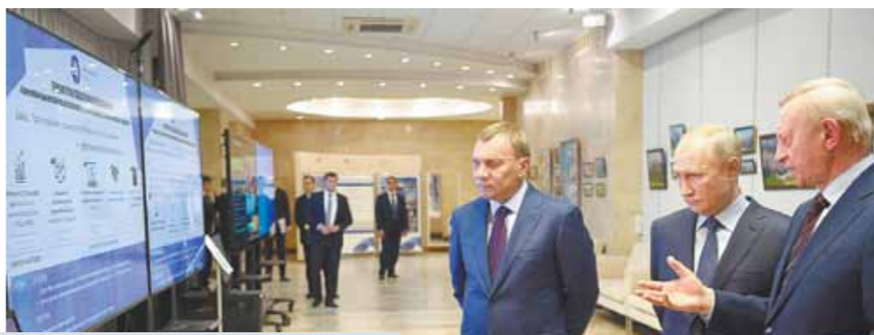
26 ноября, Саров. Путин без маски, но это не бесконтрольное массовое общение.

«Как же мы теперь без развития-то?» — спросит пылливый читатель. На самом деле правильный вопрос — как мы всю эту адскую прослойку между бюджетными деньгами и нами вывели. А насчет развития можно не беспокоиться. То, что было, укрывают, дублирующие функции уберут, что-то ликвидируют. То есть деньги там будут циркулировать не замысловатыми путями, как по капиллярам, а мощными потоками, как в артериях. А вот станет ли их больше доходить туда, куда они предназначены. — Чубайс покажет. Это такой маркер, куда точнее теста ПЦР. Надо смотреть, куда Анатолий Борисович со своих наноподвигов сдвинется — по горизонтали,