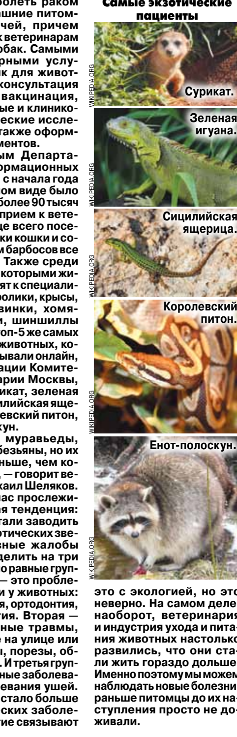
Самые экзотические пациенты. Сурикат. Зеленая игуана. Сицилийская ящерица. Королевский питон. Енот-полоскун.