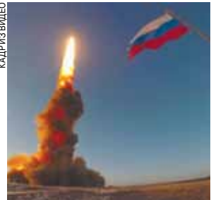
один день запустили сразу две крупные суперновинки — будущую противоракету системы ПРО и гиперзвуковой «Циркон».

Сразу два ракетных испытательных пуска в один день провела Россия. Утром в четверг, 26 ноября, на полигоне Сары-Шаган в Казахстане новейшая противоракета удачно поразила учебную мишень. Как заверили в Минобороны, новинка успешно прошла целую серию испытаний и доказала свои заявленные характеристики. Несколько часов спустя уже в Баренцевом море была запущена гиперзвуковая ракета «Циркон». Ракета преодолела 450 км и уничтожила морскую мишень. Максимальная скорость «Циркона» превысила 8 Махов — это 9,5 тыс. км/час. Примечательно, что такими пусками Россия ответила на недавнюю демонстрацию США и НАТО. Альянс решил «поиграть мускулами» и показал способности двух небольших реактивных установок в Румынии. В России же в