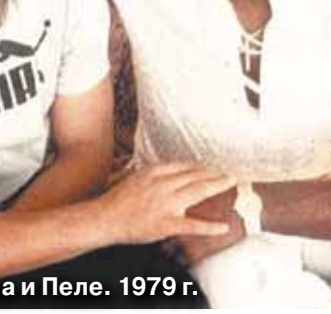
Марадона и Пеле. 1979 г.

За пределами стадионов он оказывался не только героем спортивных полос, но и неизменным персонажем скандальной хроники — наркотики, красотки, словом, для пишущей братии всегда находилась сенсация, связанная с его именем. И появление Марадона в Москве на матче Кубка чемпионов между «Спартаком» и «Наполи» тоже не обошлось без приключений.