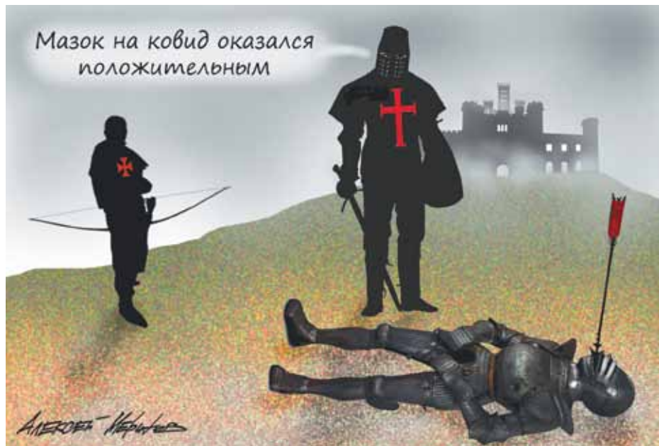
Мазок на ковид оказался положительным