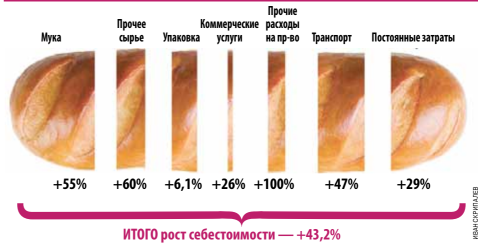
СРАВНЕНИЕ ДИНАМИКИ РОСТА СЕБЕСТОИМОСТИ И ОТПУСКНОЙ ЦЕНЫ 2014–2019 ГГ. на примере батона из пшеничной муки высшего сорта