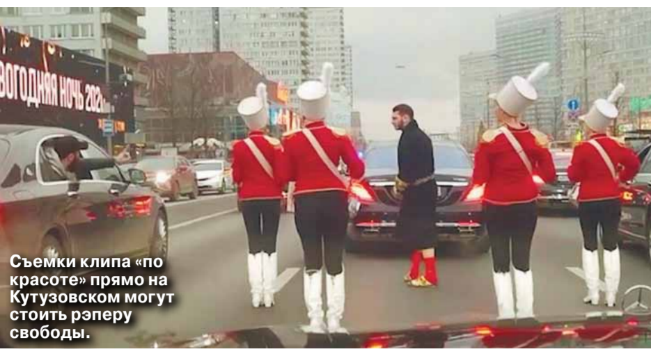
Съемки клипа «по красоте» прямо на Кутузовском могут стоить рэперу свободы.