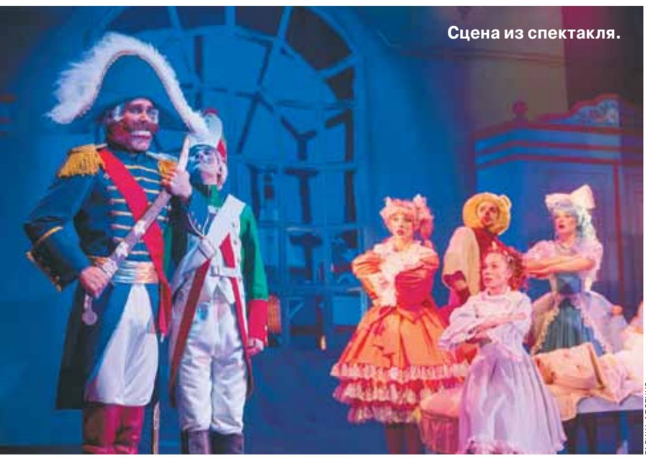
Сцена из спектакля.

До Нового года остались считанные дни, а значит, настала пора волшебных историй для детей и их родителей.