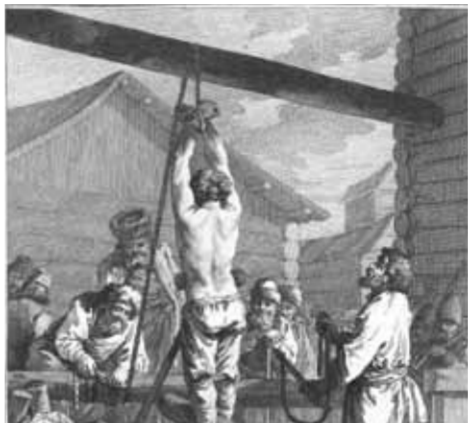
«Наказание крепостного кнута», французская гравюра XVIII века.