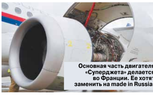
Основная часть двигателя «Суперджета» делается во Франции. Ее хотят заменить на made in Russia.

Минпромторг выделяет 15 миллиардов рублей на доработку Sukhoi Superjet 100 (SSJ, «Сухой Суперджет-100») в вариант Superjet New. Средства предстоит освоить под актуальным лозунгом импортозамещения.