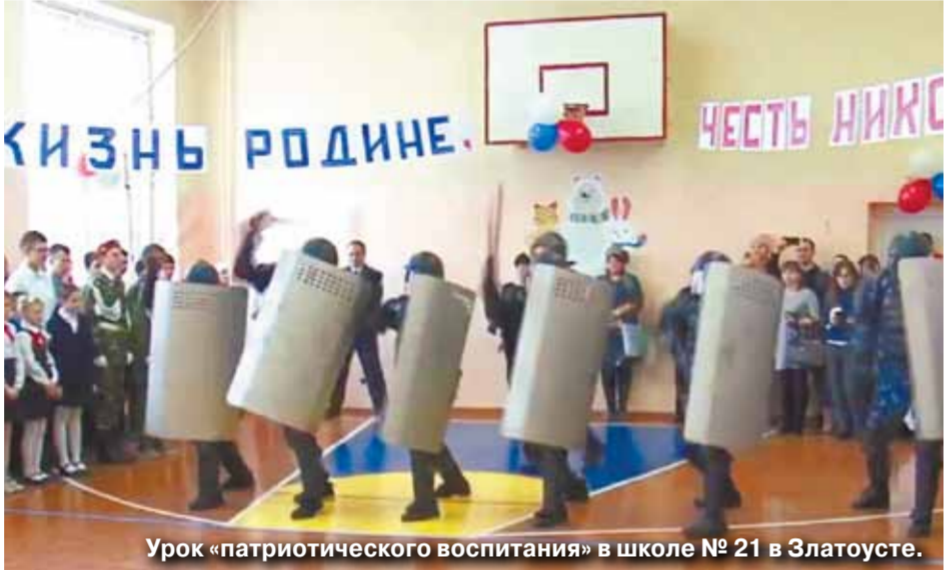
Урок «патриотического воспитания» в школе № 21 в Златоусте.