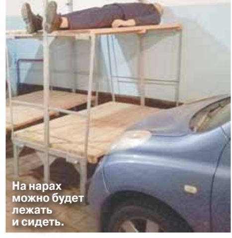
На нарах можно будет лежать и сидеть.

Угроза Третьей мировой войны стала в последнее время настолько осязаемой, что многие, кажется, уже перестали сомневаться в ее неотвратимости. Во всяком случае, если заглянуть в Интернет, то складывается именно такое впечатление: соцсети полны уподобных комментариев, военные эксперты не скрывают всех ужасов ядерного апокалипсиса, а всевозможные «выживальщики» всерьез дают советы, как его можно пережить. И вот представьте ситуацию: субботний вечер, вы дома с семьей. И вдруг — за окном сирена. Громкая, заунывная, как в старых фильмах про войну. Какие ваши мысли? Война? А может, «всего лишь» метеорит неслется к Земле? Что на самом деле может произойти и где смогут спастись москвичи в экстраординарной ситуации, выяснял «МК». Читайте 6-ю стр.