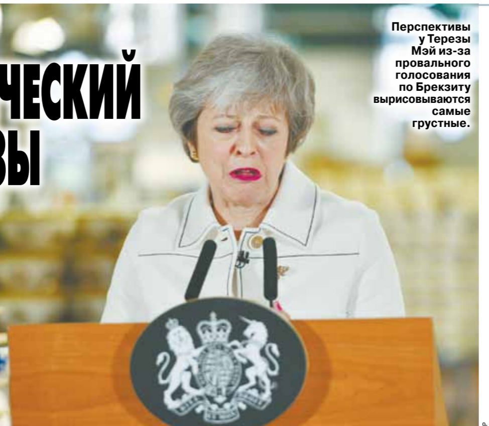
Перспективы у Терезы Мэй из-за провального голосования по Брекситу выглядят самыми грустными.