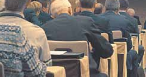
VIII съезд Союза журналистов Москвы.

С другой стороны, считает он, использовать трофейный металл, если он действительно