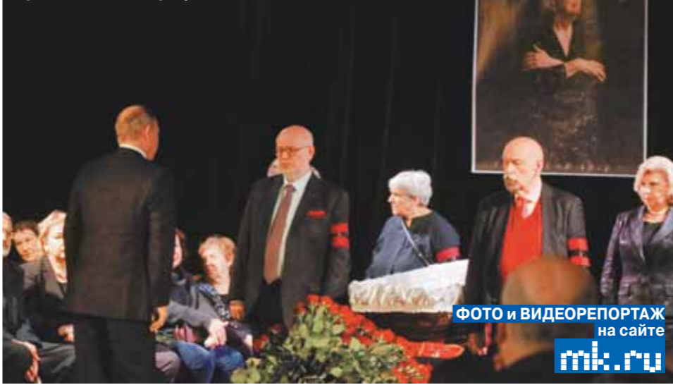
ФОТО И ВИДЕОРЕПОРТАЖ на сайте mk.ru

Проститься с Людмилой Алексеевой приехал Владимир Путин.