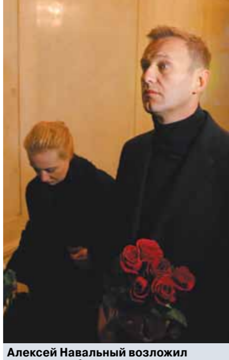
Алексей Навальный возложил цветы к гробу Алексеевой.

— не бояться, протягивая друг другу руку и идти только вперед», — сказала председатель фонда «Холокост» Алла Гербер. «Она все-таки ушла... Мы, конечно, видели, она угасала, но до самого последнего момента мы не допускали мысли в сознание, что будем без нее. Она была фигурой совершенно уникальной. Легко апеллировать высокими словами — «права человека». Но когда смотришь на конкретного человека — нужны особые чувства. Права человека принадлежат человеку вне зависимости ни от чего. Идея о том, что можно создать уважаемое, сильное государство, только на базе свободы и достоинства личности, была у нее в крови. И она не могла существовать, понимая, что попирается чье-то достоинство и права», — сказал в память об Алексеевой адвокат Генри Резник. Многие ее коллеги по правозащитному движению вспоминали, что до последнего дня, перед тем как ее положили в больницу, телефон Алексеевой не замолкал. Не всем она уже была в состоянии помочь сама и раздала множество «распоряжений» правозащитникам, на исполнение которых уйдет не один год. Дело Алексеевой продолжит жить, поощади она.