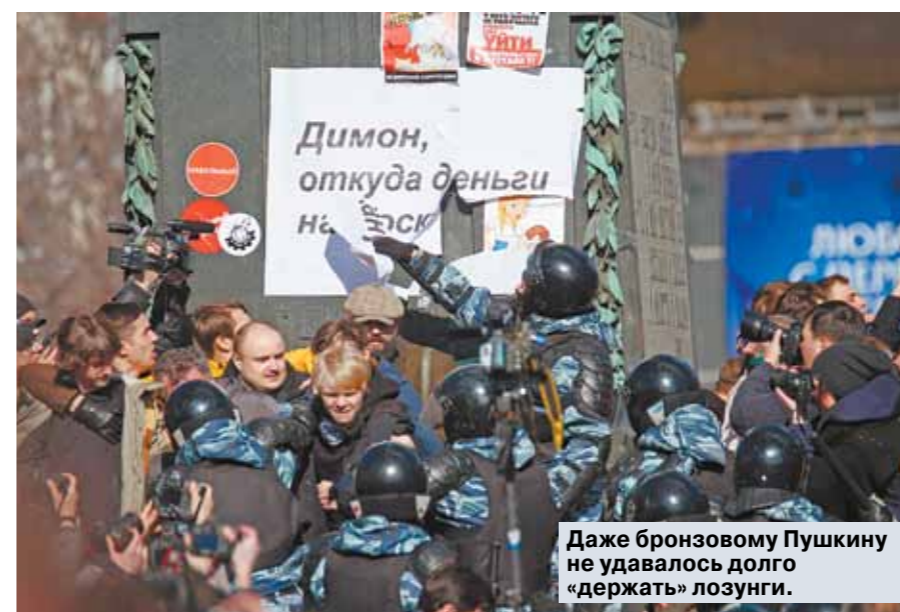
Даже бронзовому Пушкину не удавалось долго «держать» лозунги.

протестующих врывался ОМОН. На монотонный голос в громкоговоритель, который призвал «выражать свою гражданскую позицию на согласованной площадке в Сокольниках».