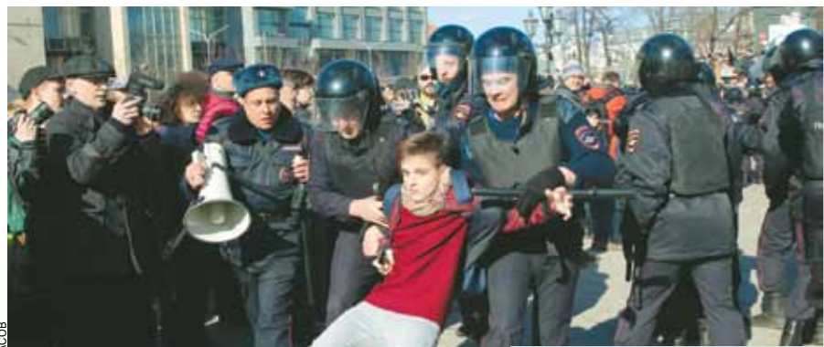
Главный урок митинга: омоложение участников по сравнению с 2011 годом.