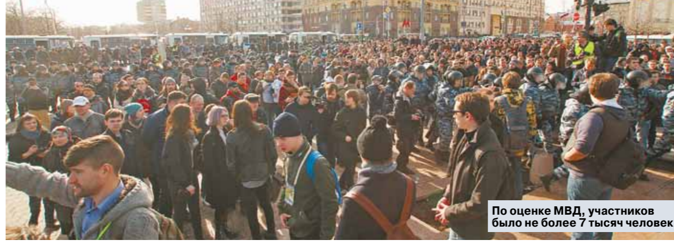
По оценке МВД, участников было не более 7 тысяч человек.