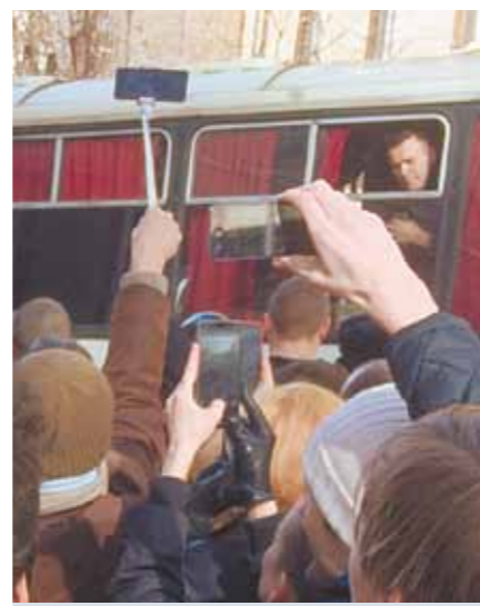
Алексея Навального увозят в автобусе.

Несмотря на то что заявленным требованием акции было расследование фактов коррупции высших должностных лиц России после успеха фильма «Димон».