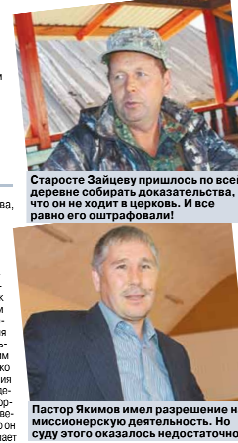
Старосте Зайцеву пришлось по всей деревне собирать доказательства, что он не ходит в церковь. И все равно его оштрафовали! Пастор Якимов имел разрешение на миссионерскую деятельность. Но суду этого оказалось недостаточно.