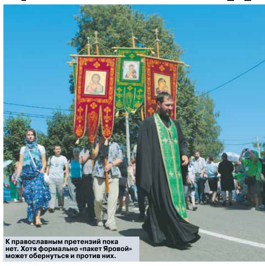
К православным претензий пока нет. Хотя формально «пакет Яровой» может обернуться и против них.

лично от себя, просто как гражданин, и тогда закон Яровой на него в принципе не распространяется. И выходит, что не было смысла принимать такой закон, раз его так легко обойти. Суды смотрят на эту дилемму по-разному. Некоторые здраво признают главенство Конституции, которая гарантирует каждому право выбирать и распространять религию по вкусу независимо от членства в религиозных объединениях. А другие рассуждают так: если человек нигде не состоит, но все равно проповедует, это означает, что он осуществляет деятельность незарегистрированной религиозной группы, что незаконно. И все равно его наказывают. Этот вопрос — самая болезненная точка «миссионерских» поправок.