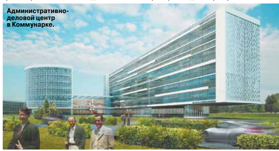
Административно-деловой центр в Коммунарке.