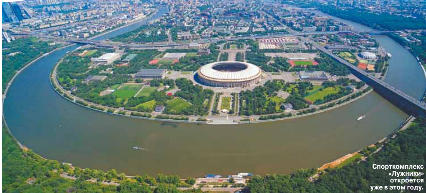
Спорткомплекс «Лужники» откроется уже в этом году.

Москва стоит на пороге очередного юбилея — 870 лет. Возраст солидный, и к юбилею столица подходит во всей красе: растут и развиваются новые районы, ветки метро тянутся уже до Подмоскья, появляются новые школы и детские сады. Город становится по-настоящему удобным для жизни.