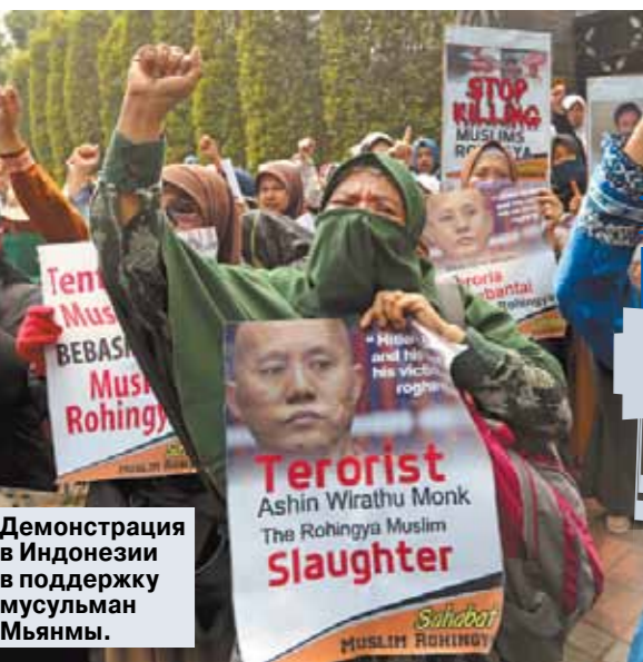
Демонстрация в Индонезии в поддержку мусульман Мьянмы.