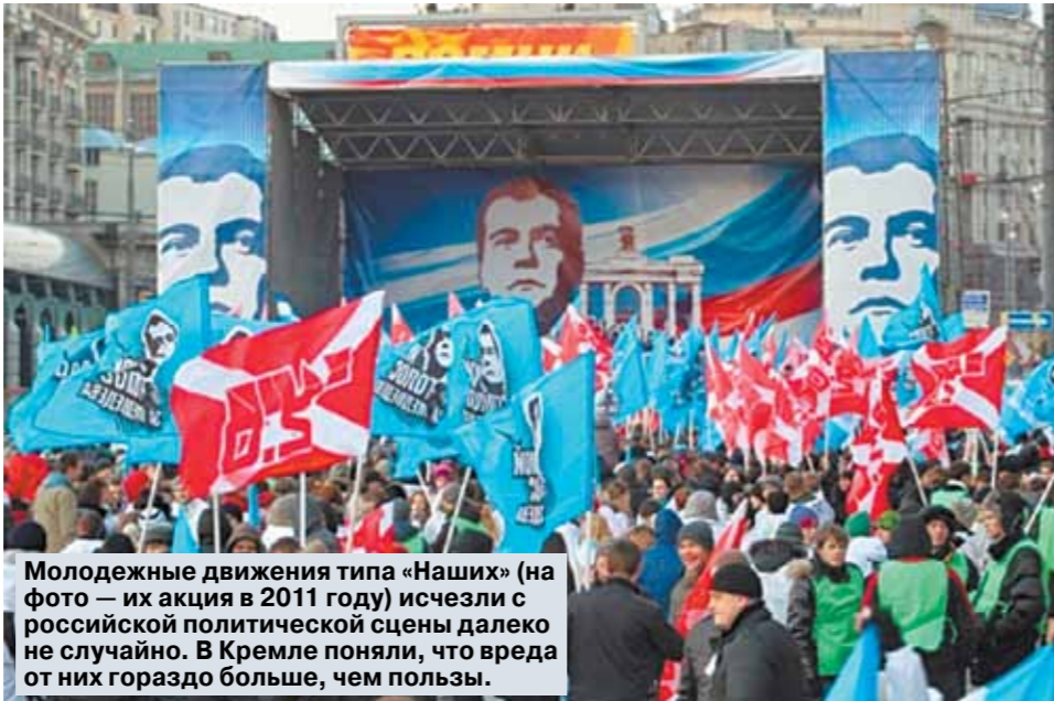
Молодежные движения типа «Наших» (на фото — их акция в 2011 году) исчезли с российской политической сцены далеко не случайно. В Кремле поняли, что вред от них гораздо больше, чем пользы.

экономика РФ уже давно легла бы на бок. Новый «путинский народ» — это поколение, которого катастрофически мало.