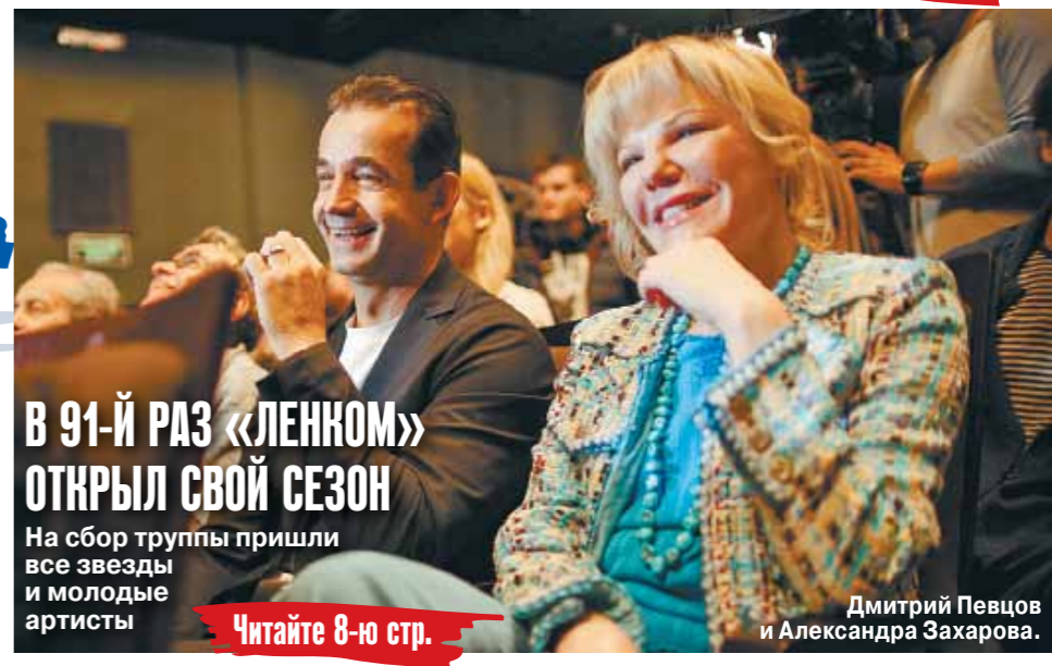
В 91-й РАЗ «ЛЕНКОМ» ОТКРЫЛ СВОЙ СЕЗОН

На сбор труппы пришли все звезды и молодые артисты