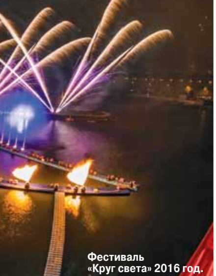
Фестиваль «Круг света» 2016 год.

а в парке установят световые инсталляции от известных дизайнеров со всего мира. Также 24 сентября в парке Царицыно для гостей выступит арт-группа SOPRANO, а на следующий день — народный артист России Дмитрий Маликов.