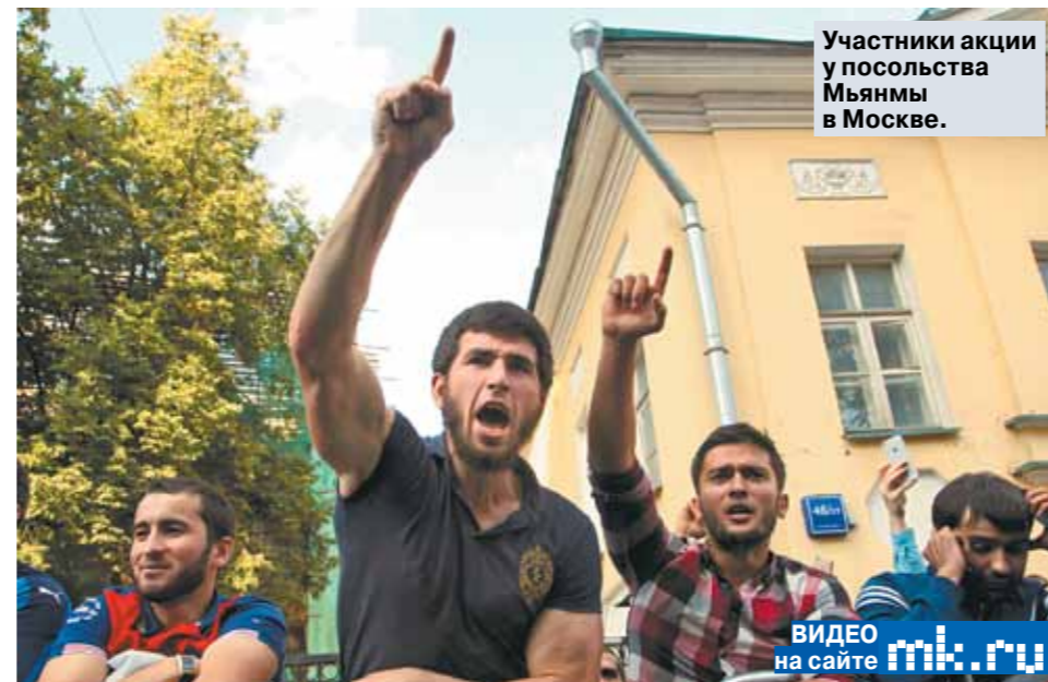
Участники акции у посольства Мьянмы в Москве.