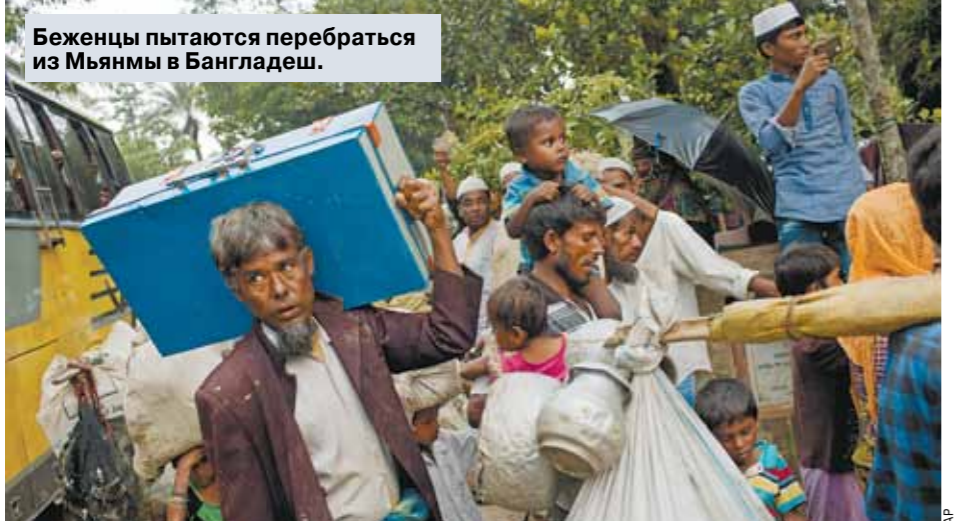
Беженцы пытаются перебраться из Мьянмы в Бангладеш.