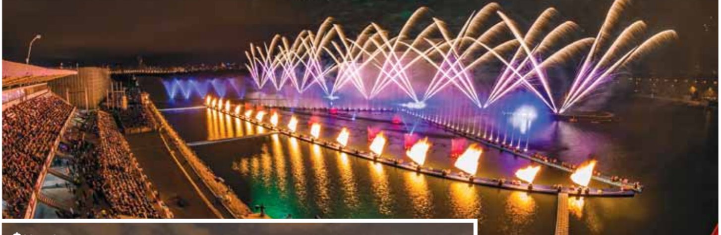
Фестиваль «Круг света» 2015 год.