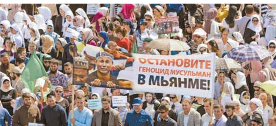
На митинг в поддержку мусульман Мьянмы в чеченской столице вышел, как сообщается, миллион человек.

— Мусульманские СМИ в России давно писали о ситуации в Мьянме, но никогда это не вызвало такого ажиотажа. На мой взгляд, сейчас кто-то пытается нивелировать болезненные вопросы, связанные с Ближним Востоком и непосредственно кавказцами в этом регионе. В