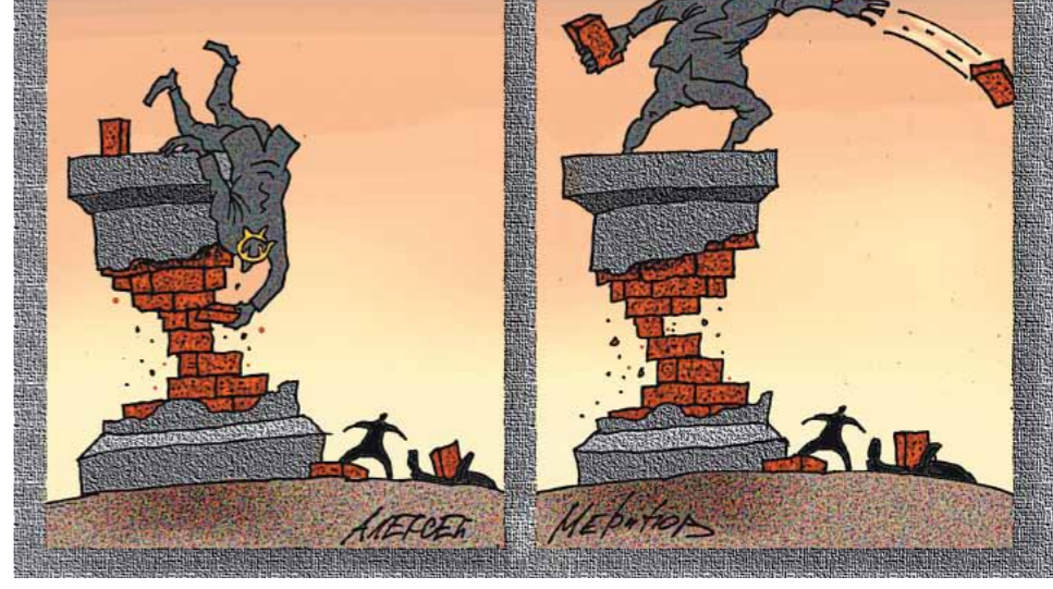
Читайте 2-ю стр.

Можно, конечно, уповать на случайность — чего только в нашей жизни не бывает. Можно даже подумать, что это Юлия Латынина нагнетает, а на самом деле «в Багдаде все спокойно», жить стало лучше, жить стало веселее. Можно, но не нужно.