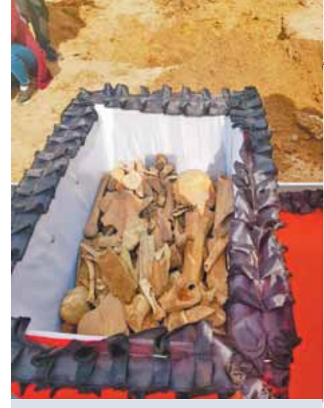
Кости, найденные этим летом, предали земле.