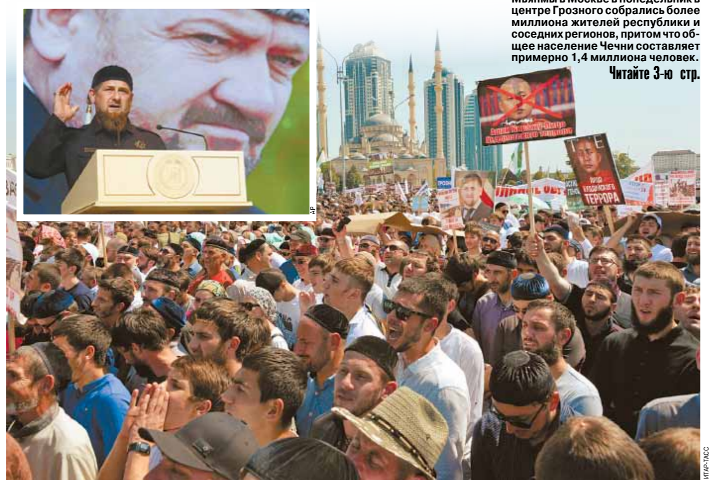
Читайте 3-ю стр.