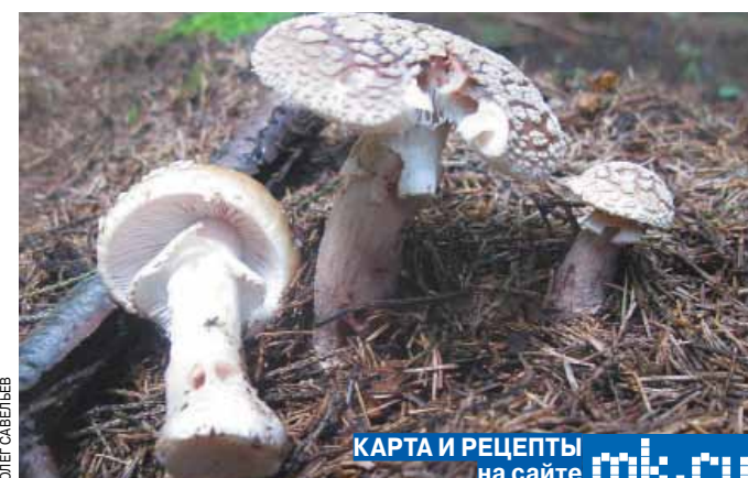
Эти мухоморы, как ни странно, можно есть. Их нашел в подмосковном лесу наш корреспондент.

Карта грибных мест для жителей Москвы и области составили специалисты Комитета лесного хозяйства Подмосковья. На ней эксперты отметили 36 грибных мест, рекомендованных для посещения. Как стало известно «МК», при создании карты сотрудники Комплесхоза руководствовались рекомендациями бывалых грибников и данными крупнейших интернет-форумов. Для удобства жителей она составлена по направлениям движения пригородных электричек — Волоколамскому, Ленинградскому, Савельковскому, Ярославскому, Казанскому, Павелецкому, Курскому, Киевскому и Белорусскому. Вдоль них указаны ближайшие к грибным зонам населенные пункты, а также виды грибов, которые растут в той или иной зоне. Все обозначенные грибные зоны будут патрулироваться сотрудниками Комитета лесного хозяйства, общественными лесными инспекторами, сотрудниками пожарно-спасательных подразделений и правоохранительных органов, а также специалистами местных администраций. «В 2016 году в лесах Московской области было выявлено почти 400 человек. Большинство из них — грибники, — сообщили «МК» в пресс-службе заместителя