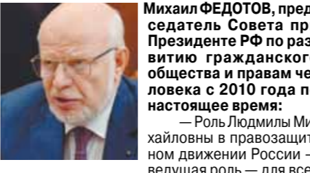
Михаил ФЕДOTOB, председатель Совета при Президенте РФ по развитию гражданского общества и правам человека с 2010 года по настоящее время:

— Роль Людмилы Михайловны в правозащитном движении России — ведущая роль — для всех нас является очевидной. В ее лице мы имеем, во-первых, безошибочный нравственный камертон. А во-вторых, пример правозащитника чистой воды, лишеного каких-либо политических пристрастий, кроме пристрастия к милосердию и справедливости. Она абсолютно политически нейтральна, что я считаю принципиально важным для правозащитника. Ее позиция не зависит от того, какая партия является правящей, какие люди занимают руководящие посты в государстве. Она всегда будет в оппозиции к власти — в том смысле, что она защищает людей от несовершенства государства, от произвола, который чинят от имени государства и даже силой государства.