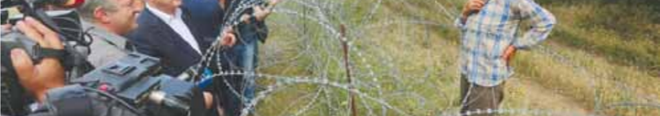
Порошенко посмотрел на Южную Осетию из-за колечей проволоки.

президента, однако сдавать экс-соратника грузинской Фемиде он, видимо, не намерен.