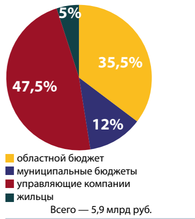
Всего — 5,9 млрд руб.