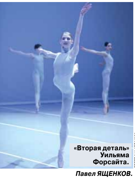
«Вторая деталь» Уильяма Форсайта.