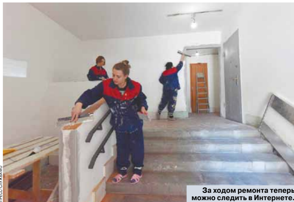
За ходом ремонта теперь можно следить в Интернете.