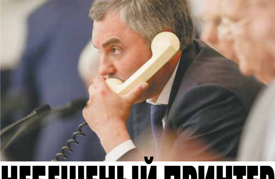
Спикер новой Госдумы Володин. Лавиравал, лавиравал, да не вылавиравал.

С таким «багажом» за плечами Саакашвили сумел не только избежать суда, но и закрепиться на политической арене Украины, однако и там он успел «отличиться». Начиная с двух заведующих должностей — советника Порошенко и градоначальника Одессы, а затем скатился до роли лидера националистической украинской партии «Рух новых сил». А все потому, что из сторонника действующей власти и друга Порошенко Саакашвили превратился в яркого оппозиционера, требующего досрочного парламентских выборов. Однако самый глупый поступок он совершил в январе 2016 года, когда раскритиковал позиции ВСУ на Донбассе. Именно после этого инцидента Пётр Порошенко вычеркнул фамилию Саакашвили из списка своих приближенных. «Дружба» с одиозным политиком сильно вредила имиджу и рейтингу украинского