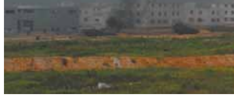
ФОТОРЕПОРТАЖ на сайте mk.ru

На полигоне Мулино отрабатывали освобождение захваченного террористами населенного пункта