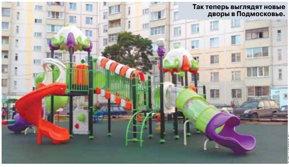
ТАК ТЕПЕРЬ ВЫГЛЯДЯТ НОВЫЕ ДВОРЫ В ПОДМОСКОВЬЕ.