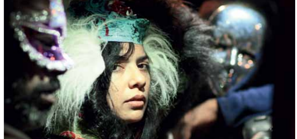
Кадр из фильма «Сексуальная Дурга».

Режиссер малобюджетного индийского фильма стал в Армении миллионером