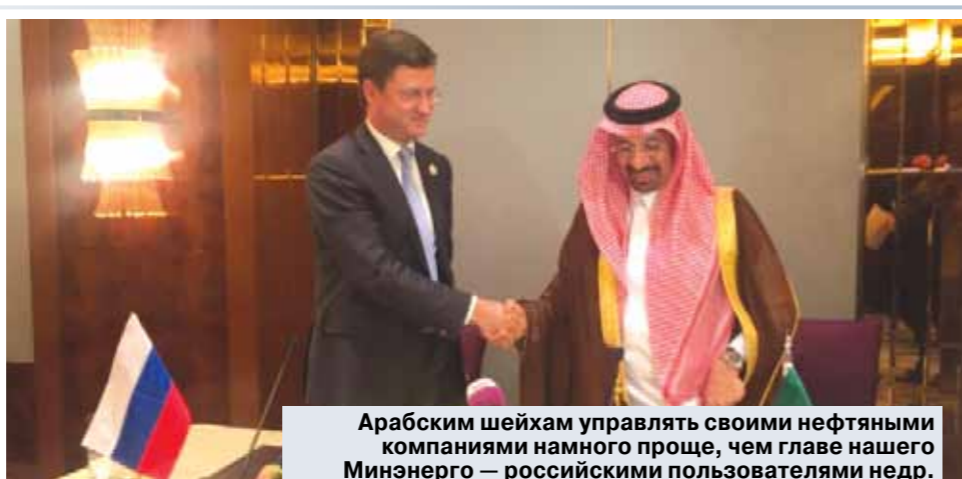
Арабским шейхам управлять своими нефтяными компаниями намного проще, чем главе нашего Минэнерго — российскими пользователями ндр.