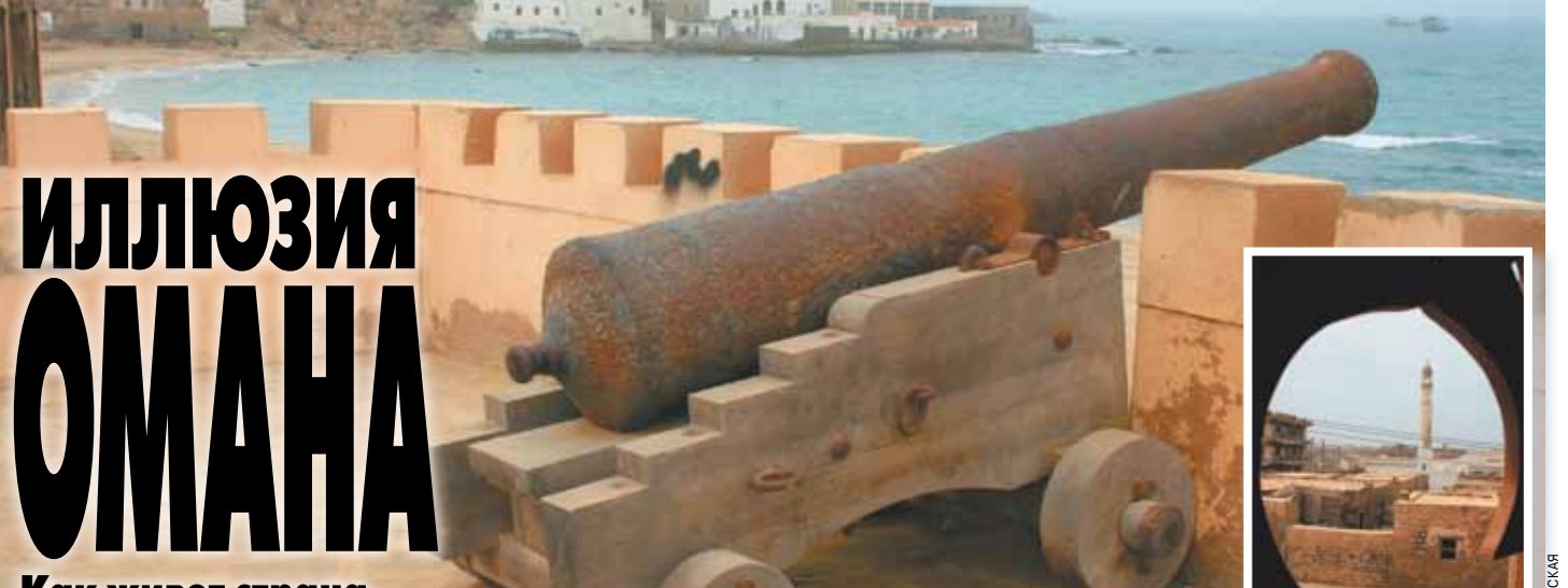
Вид со стены форта Мирбат.