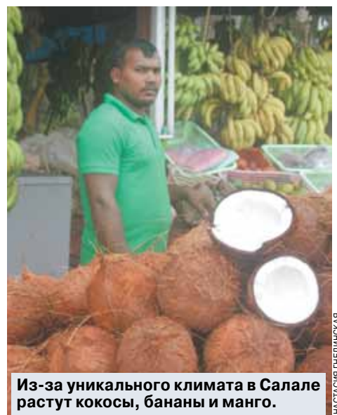
Из-за уникального климата в Салале растут кокосы, бананы и манго.

Работы в стране тоже не было, поэтому многие граждане уезжали на заработки в другие страны. Очень много оманцев трудились прислугой в домах кувейтцев.