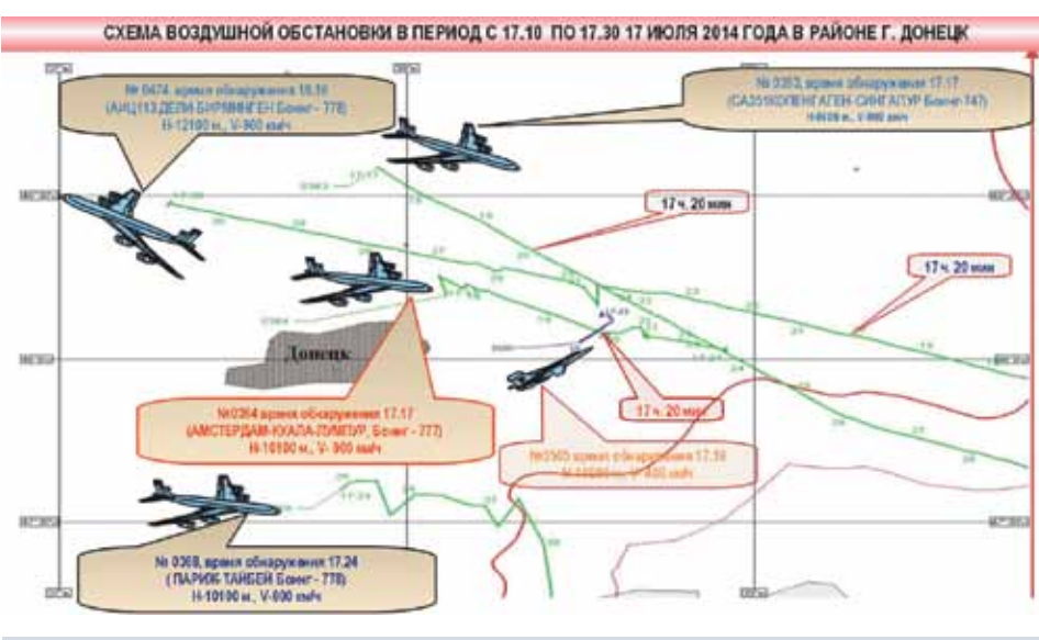
Схема воздушной обстановки, представленная Минобороны РФ два года назад. Вопрос военного самолета с повестки дня до сих пор не снят.

А между тем на основании тех материалов — записи движения воздушных судов в районе