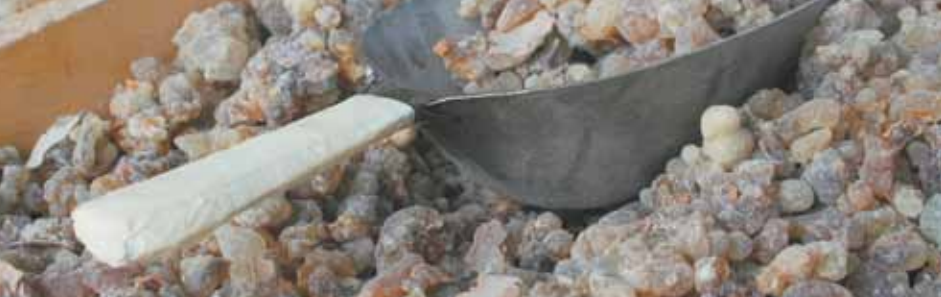
Гордость Омана — ладан. Здесь можно увидеть, как собирают эту ароматическую смолу.

Впрочем, есть исключения. В случае если мужчине за сорок или же он не смог найти себе жену в Омане (к примеру, у него есть инвалидность), он может попытаться построить семейное счастье с иностранкой.