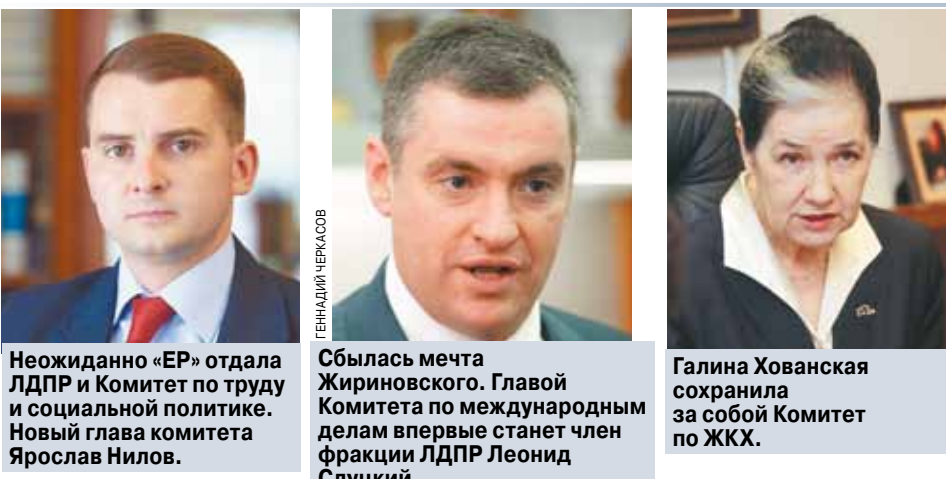
Неожиданно «ЕР» отдала ЛДПР и Комитет по труду и социальной политике. Новый глава комитета Ярослав Нилов.

Комитет по общественным объединениям и религиозным организациям возглавит Сергей Гаврилов, Комитет по аграрным вопросам — Владимир Кашин, а Комитет по делам СНГ — Леонид Калашников. ЛДПР кроме уже упоминавшихся получила Комитет по федеративному устройству и местному самоуправлению, а также комитет с длинным названием, который образовался в результате слияния двух прежних: Комитет по промышленности,