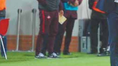
Смена имиджа Массимо Карреры не принесла удачи «Спартаку».