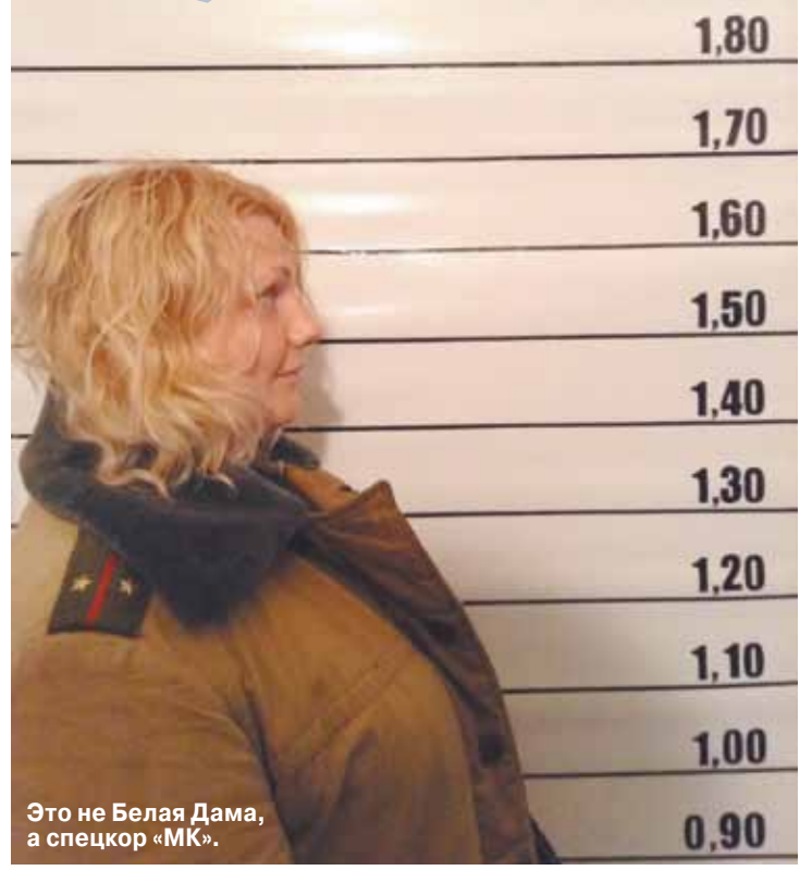
Это не Белая Дама, а спецкор «МК».