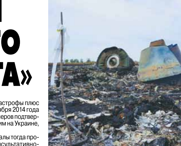
якобы и сбил Boeing. При этом данные, снятые с экрана радиолокатора, — а это факт, который доказывает, что еще в течение 20 минут после катастрофы военный самолет находился в этом воздушном пространстве, — стараются просто не замечать. Наличие этих меток на экране локатора никак не вяжется с заявлениями украинской стороны о том, что военная авиация Украины в интересующий расследование период времени никаких полетов не выполняла. И самое важное: местоположение этих меток на локаторе — слева от курса движения Boeing — совпадает с фотографиями на месте падения, где ясно видны следы от внешнего воздействия на левом крыле и левой стороне кабины экипажа, сбитого Boeing-777.

ростовского центра на момент катастрофы плюс 20 минут после нее — в «МК» 12 ноября 2014 года вышла статья «Данные авиадиспетчеров подтвердили: рядом с «Боингом», рухнувшим на Украине, летел военный самолет».