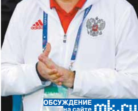
ОБСУЖДЕНИЕ на сайте mk.ru

Тем не менее сыграть с ними можно было совсем по-другому — понятно, что с трибуны рассуждать легче, чем принимать решения в условиях обрушившегося на Слуцкого стресса, но надо отметить, что состав на игру с Уэльсом изрядно удивил. Вместо Нойштедтера и Головина, игравших сначала в предыдущих матчах, на поле вышли Глушаков и Мамаев, Широков заменил Шатов, которому травма все же не позволила выйти на поле, а умеющий намного лучше атаковать по левому своему флангу Комбаров — Щенникова, более искусственного в обороне.