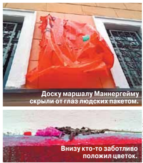
Доску маршалу Маннергейму скрыли от глаз людских пакетом. Внизу кто-то заболтал положил цветок.

Одни обливают памятную доску краской, другие кладут под нее цветы