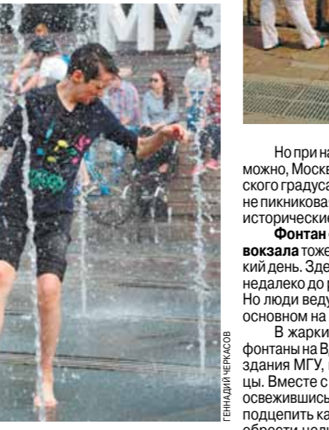
ФОТОРЕПОРТАЖ на сайте mk.ru