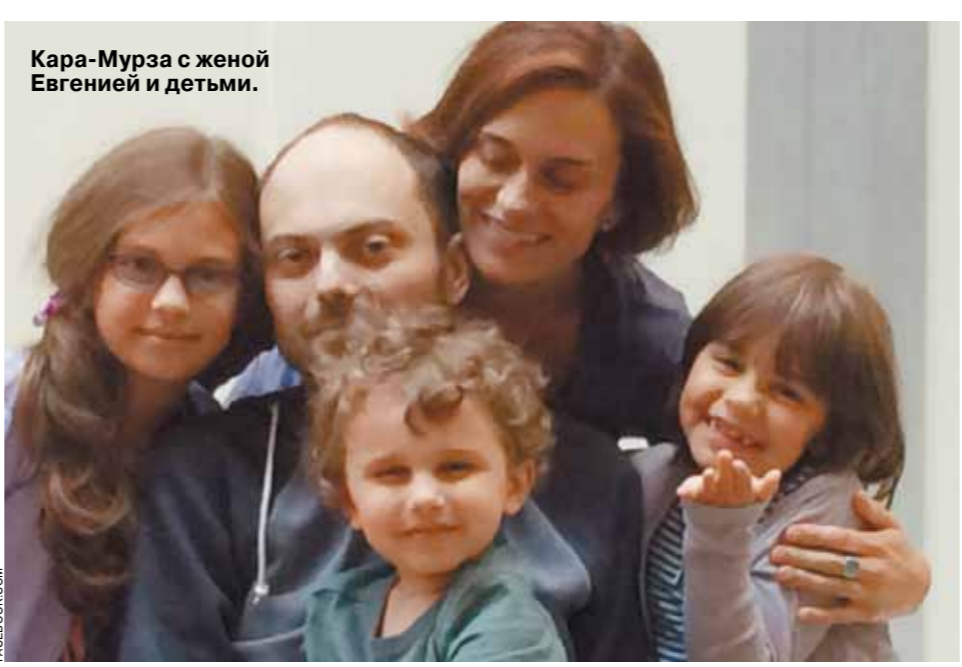
Кара-Мурза с женой Евгенией и детьми.

— Да, я пока продолжаю реабилитацию. Голова, слава богу, работает. Рукопожатие крепкое. И современные средства связи позволяют полностью включаться в процесс. Как только врачи разрешат, вернусь в Москву, непосредственно на свое рабочее место.