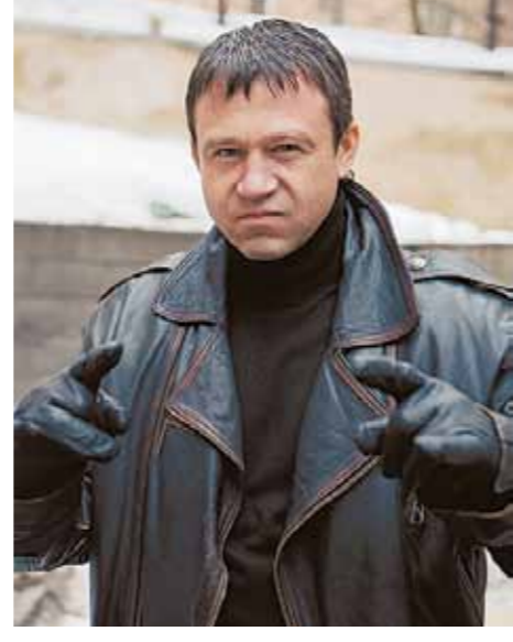
— Но кино — скучная вещь. Тратишь долгие часы в бесконечном ожидании на съемочной площадке...