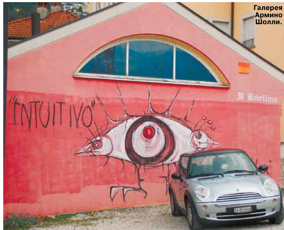
Галерея Армино Шолли.

Никита Михалков, оказывается, награжден в Локарно. Об этом аккредитованный на фестивале обозреватель «МК» узнала, уже вернувшись в Россию