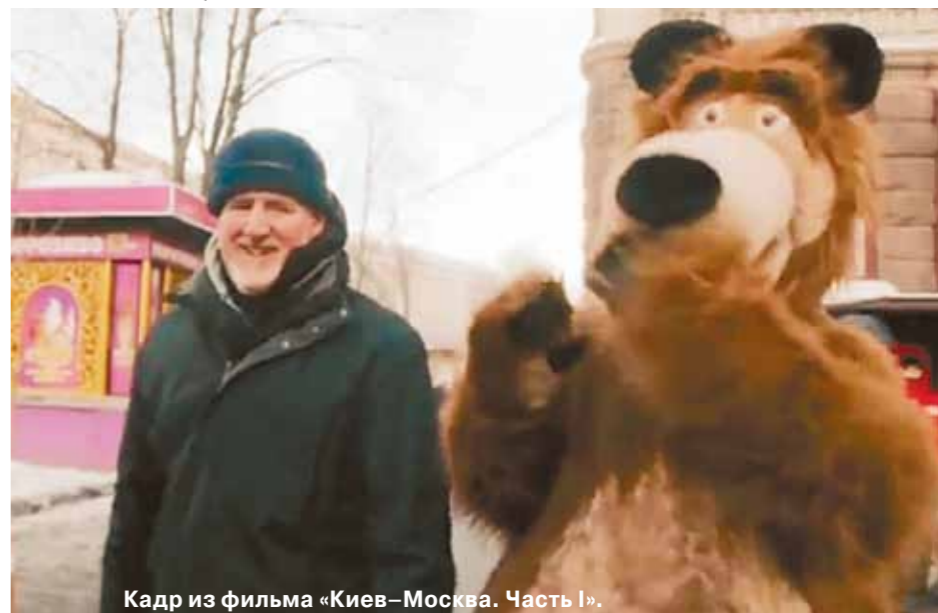
Кадр из фильма «Киев-Москва. Часть 1».

Фестиваль в Локарно примечателен тем, что показы проходят под открытым небом на центральной площади города Пьяцца-Гранде, вмещающей больше 7 тысяч зрителей. За последними рядами теперь еще и располагаются столики ресторанов. Можно есть и посматривать на экран. Публика голосует после показов, выбирая победителей. Даже дождь ей не помеха. Сеанс начинается в 21.30, но места занимают заранее, иногда за два часа. Зрители сидят под зонтиками, в желтых дождевиках, кто-то натягивает водонепроницаемые штаны прямо на джинсы. Благо рядом с кинотеатром под открытым небом бойко работает фестиваль магазин, где можно купить все необходимое на случай непогоды, причем в леопардовой гамме. Это зреть богато представлен в витринах магазинов, даже хлеб украшен марципановыми леопардами. Адоржжа, ведущая в замок Висконти, — тоже пятнистая. Велосипеды выдают направо тогда соответствующей расцветки.