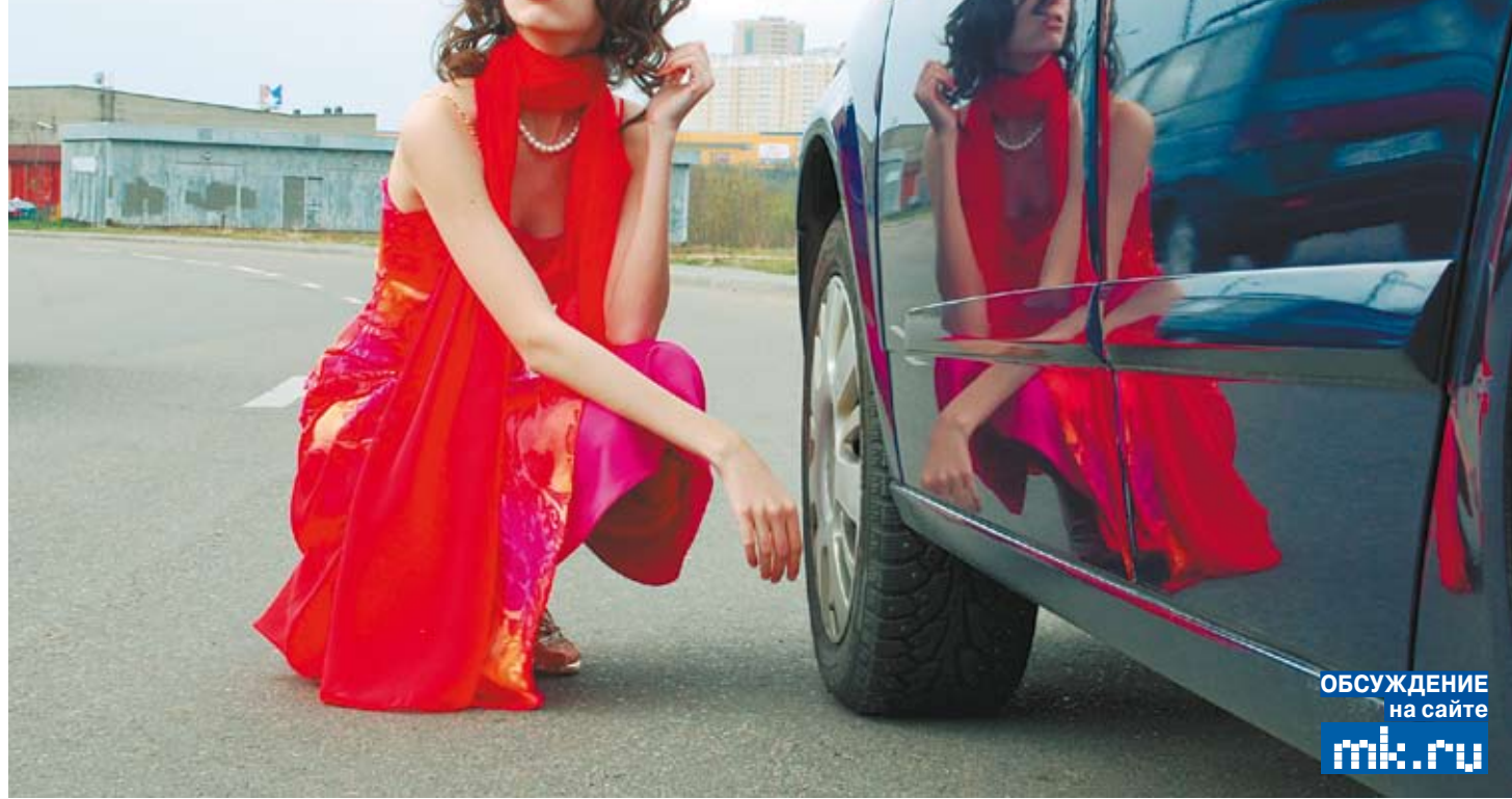
ОБСУЖДЕНИЕ на сайте mk.ru