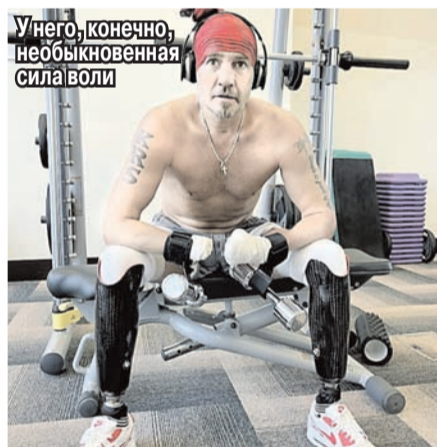
У него, конечно, необыкновенная сила воли