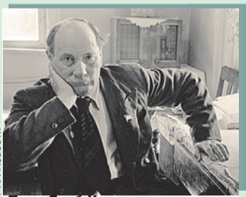
Поэт Якуб Колас.

■ Первые стихи классика были... на русском языке. Родился Кастусь (Константин) Мицкевич (настоящее имя поэта) в 1882 году на Минщине, в деревне Акинчицы, в семье лесника. К слову, в один год с другим классиком и другом Янкой Купалой.