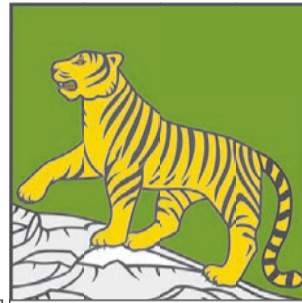
Современная версия (декабрь 2014-го).