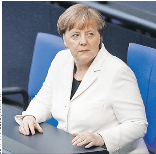
Ангеле Меркель потребовалось несколько месяцев, чтобы убедить депутатов бундестага переизбрать ее главой страны.