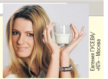
Евгения ГУСЕВА «КП» - Москва