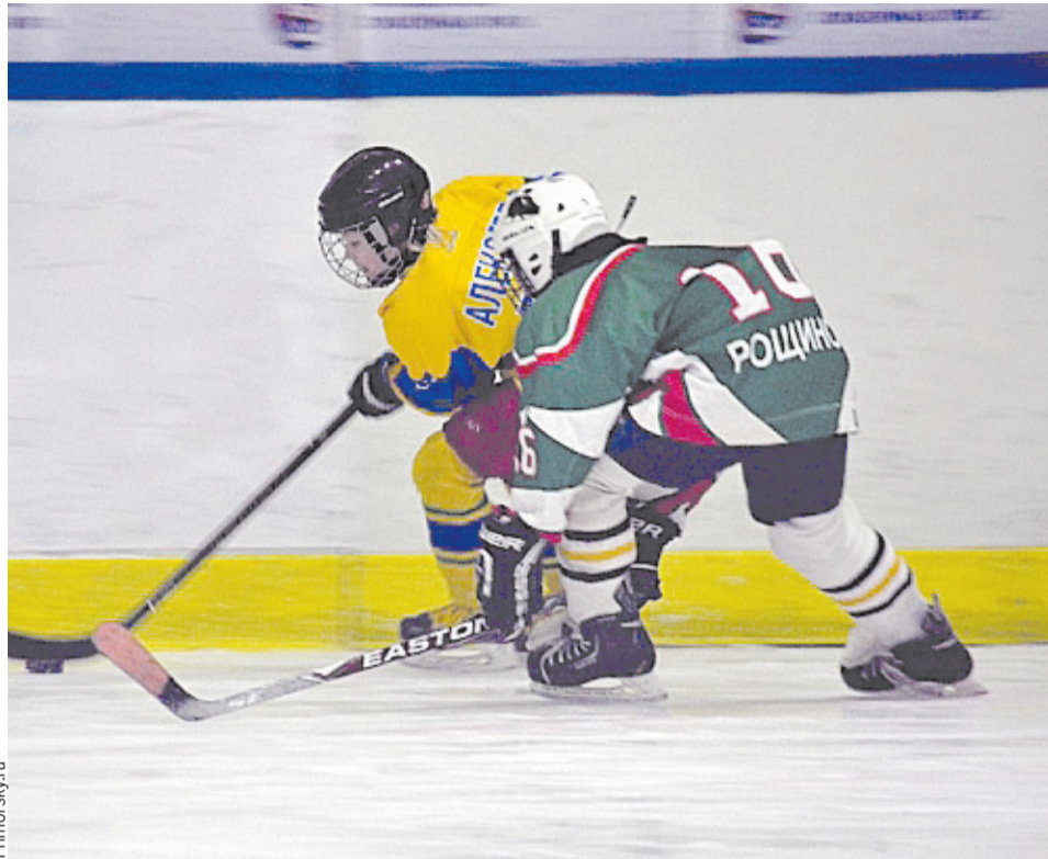
Турнир «Золотая шайба» в Приморье пользуется заслуженной популярностью.