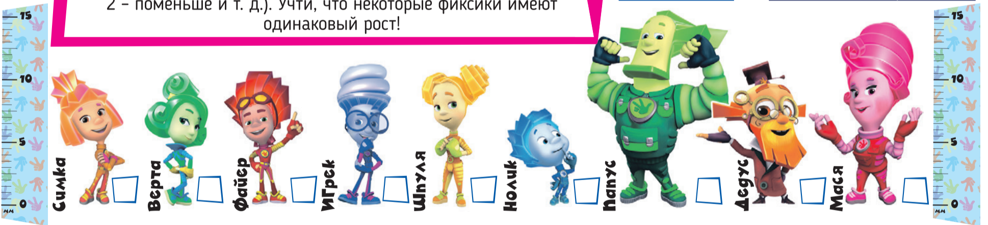
Филворд. Телеграмма, бандероль, открытка, письмо, посылка. Кто самый высокий? Панус, Маша, Игрек и Шнуля, Дедус и Симка, Файер, Верта, Нолик.

Посылки на почте измеряют и взвешивают. Расставь фиксиков по росту и подпиши цифрами (1 - самый высокий, 2 - поменьше и т. д.). Учти, что некоторые фиксики имеют одинаковый рост!