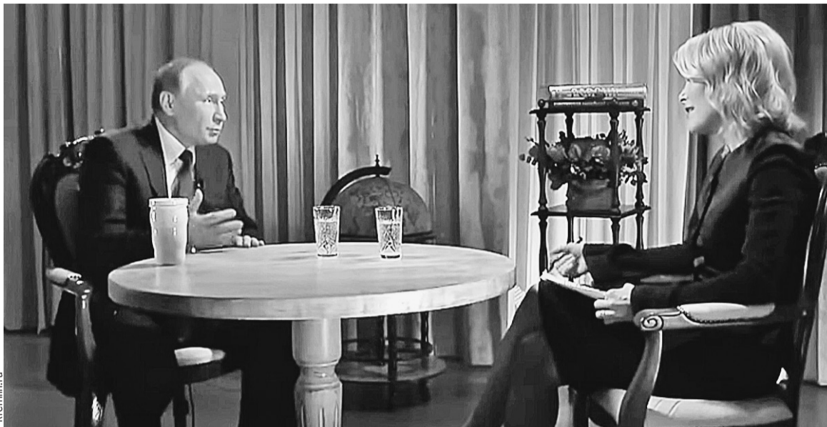
Ведущая NBC Мегин Келли, взявшая интервью у Владимира Путина, сделала вывод, что российского лидера невозможно переиграть.

но признался, что ему категорически делать нельзя: