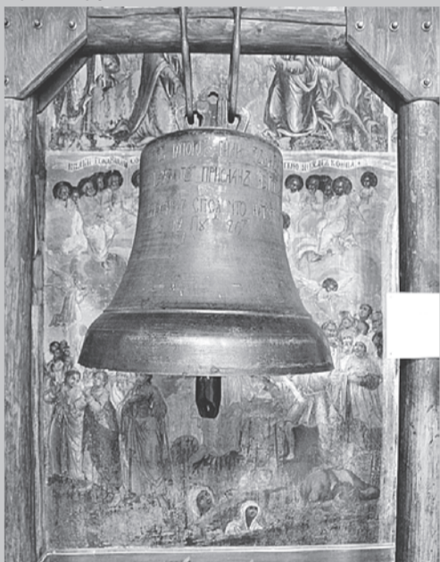
Этот колокол в буквальном смысле лишился дара речи.

Колокол в церкви Дмитрия на крови горожане воспринимают, как... человека! Впервые его сочли «живым существом» 15 мая 1591 года. По преданию, ровно в полдень колокол оглушающим звоном известил о гибели царевича. На соборной площади собралась толпа. Разъяренные горожане жестоко расправились с предполагаемыми убийцами Дмитрия. Но и сами поплавились за самосуд - две сотни угличан избили плетьюми, шестьдесят семей отправили в ссылку в Сибирь. Досталось и колоколу. Его сочли подстрекателем к бунту и сбросили со Спасской колокольни. Принародно вырвали язык, нанесли 12 ударов плетью и тоже отправили в ссылку - в Пелымский острог неподалеку от нынешнего Екатеринбурга. Там по велению местного воеводы, видимо, не лишнего чувства юмора, колокол заперли в приказной избе и написали на нем: «первосыльный недушевленный с Углича». В Тобольске страдалец провел триста лет и только в 1892 году вернулся в родной город. Угличане выкупили его за шестьсот царских рублей.