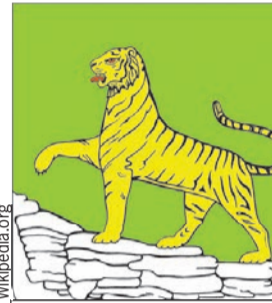
Тигр образца 2001-го.