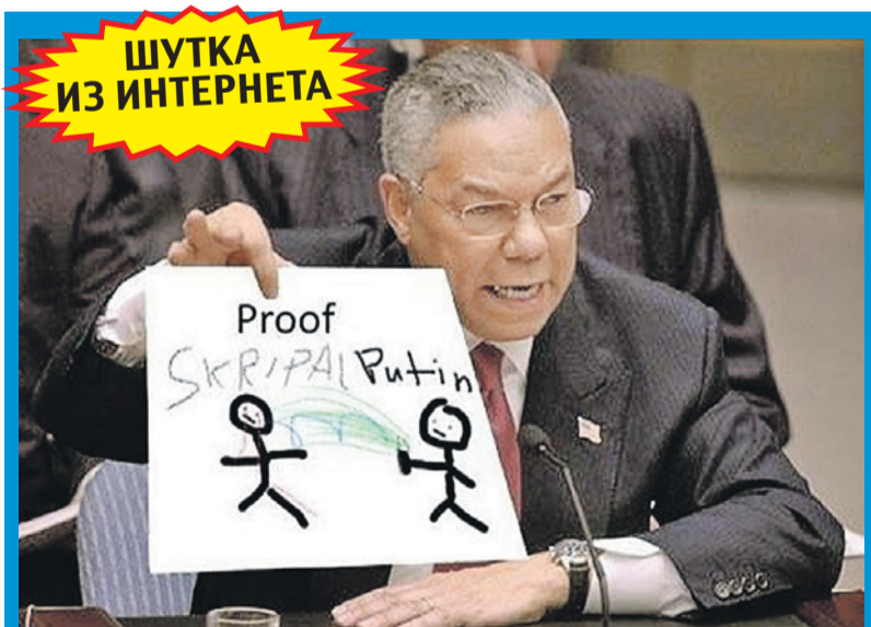
Когда-то госсекретарь США Колин Пауэлл тряс в Совбезе ООН липовой пробиркой с иракским химоружием. Теперь «доказательством» (proof) вины России мог бы стать такой рисунок.

За последние сутки наш сайт посетили 3 миллиона 922 тысячи человек