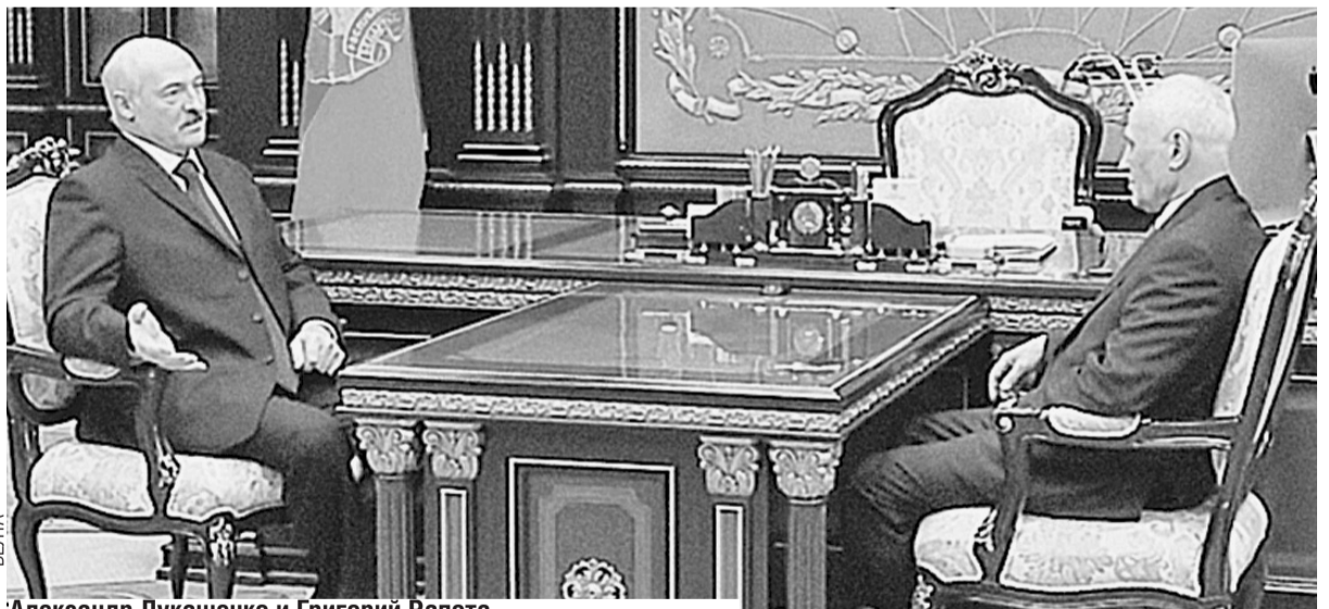
Александр Лукашенко и Григорий Рапота также обсудили повестку и сроки проведения ближайшего заседания союзного Совмина.

Госсекретарь пообещал, что пожелания учтут. Работа по всем направлениям ведется постоянно, и нет жесткой привязки к срокам проведения ВГС или заседаний Совмина: