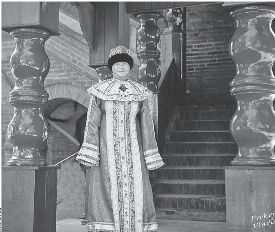
Не смущайтесь заглянуть в Смутное время, чтобы вздохнуть: «Жили же князья!»

Княжеский дворец мгновенно привлекает внимание. Это одно из самых старинных зданий в России. Построено из красного кирпича и признано редким образцом средневекового русского зодчества. Именно с ним связана главная тайна Углича. Тут прожил короткую жизнь - всего восемь лет - царевич Дмитрий . Причина смерти до сих пор точно не известна. В Углич мальчик приехал вместе с матерью Марией Нагой , седьмой, незаконной супругой Ивана Грозного . У царевича не было права на престол, но Борис Годунов и сподвижники решили перестраховаться и сослали мать и сына в Углич сразу после смерти самодержца в 1584 году. Вскоре Дмитрий погиб при невыясненных обстоятельствах. Якобы случайно, во время игры в ножички. Но основная версия - от рук соратников Годунова. В 1598 году умер старший брат Дмитрия Федор . Династия Рюриковичей прекратилась. Так началась Смута.