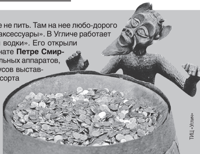
В «библиотеке» есть свой Кашей, который над золотом чахнет.

Самый любопытный экспонат - чугунная медаль «За пьянство». Самая тяжелая в России. Ее утвердил Петр I . Вес «награды» (без цепей) - 6,8 килограмма. Ее вешали провинившемуся пьянчужке на шею так, чтобы нельзя было снять. Медаль он должен был носить неделю. Забавно, что сам Петр I трезвенником не был и с радостью посещал Всешутейший, всепьянейший и сумасброднейший собор, где спиртное лилось рекой. Но ему медаль, конечно, носить не приходилось.