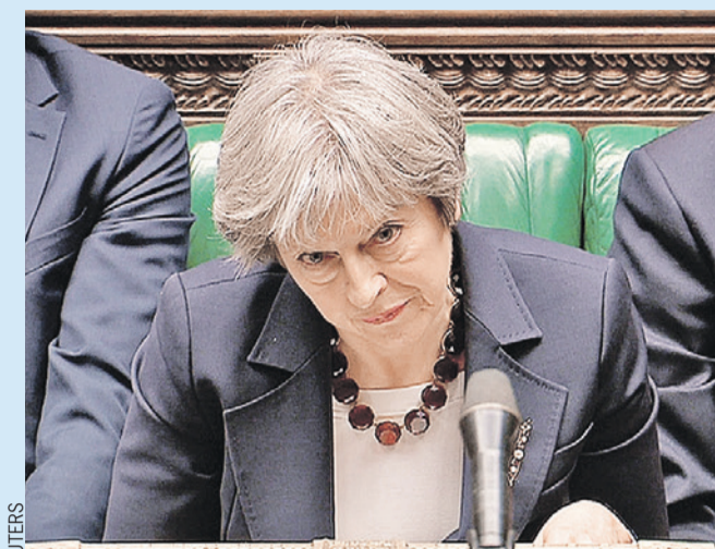
Выступая в британском парламенте, премьер-министр Тереза Мэй попыталась обвинить Россию во всех грехах.