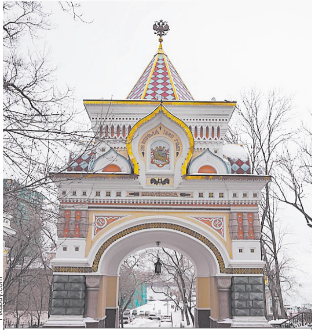
Первый вариант герба Владивостока можно увидеть на воссозданной арке Цесаревича.