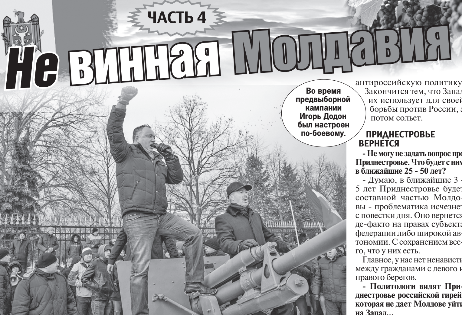
Мирслав ГОТАРЬ, Sputnik/RVA, Новости

- Западные партнеры поддерживали коррумпированные правительства в Молдове исходя из своих интересов. За такие деньги, за такие бабки, как говорят, можно было реформировать Мол-