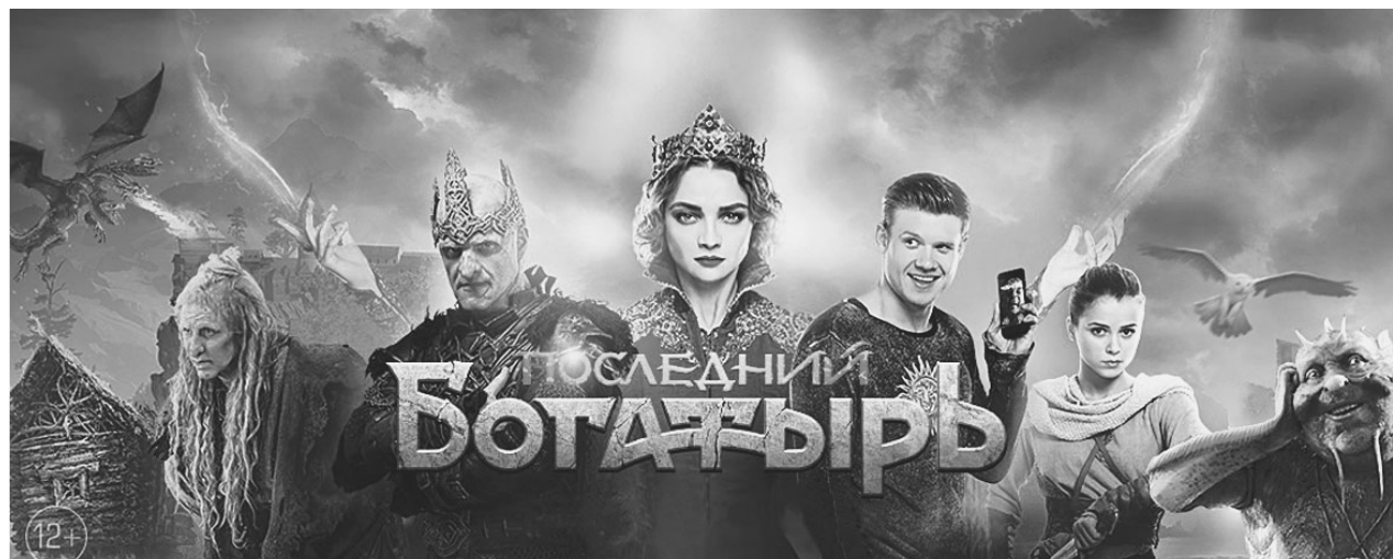
Телепремьера новой сказки «Последний богатырь», уже ставшей блокбастером, - 1 января в 20.30 на телеканале «Россия».