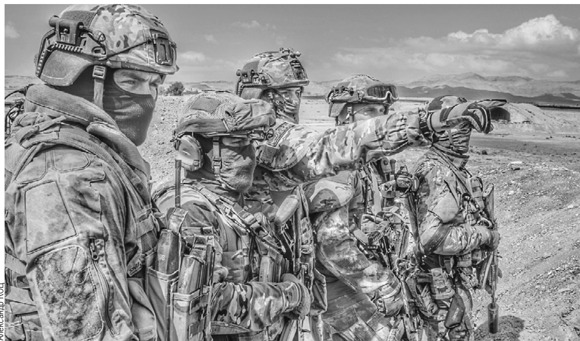
Группа бойцов Сил спецопераций России под Пальмирой. Эти спецназовцы выполняли в Сирии особо важные задачи по разведке, наведению огня и ликвидации главарей террористов.