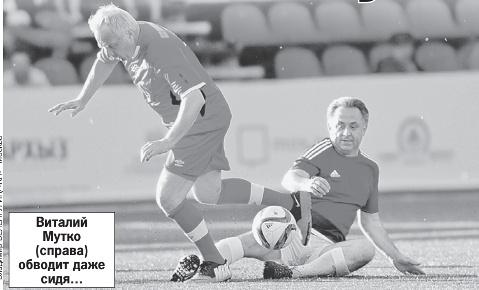
Виталий Мутко (справа) обводит даже сидя...