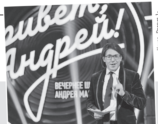
Бывшим коллегам Малахов передает привет из студии своего нового шоу «Привет, Андрей!».

Однажды в гости к Ивану Урганту в его вечернее шоу пришла Ирена Понарошку . Она принесла крем для лица, который Ургант тут же начал втирать в щеки и лоб. А когда Ирена вдруг сообщила, что это соловьиный помет, Иван лихо сымпровизировал: мол, так могло бы называться шоу на канале «Россия». Владимир Соловьев , в адрес которого и прозвучал выстрел, обиделся и заявил, что шутку про него начали «цитировать обвиняемые в педофилии граждане, находящиеся в бегах в Праге», а все украинские сайты стали «с радостью печатать, какой Ургант молодец».