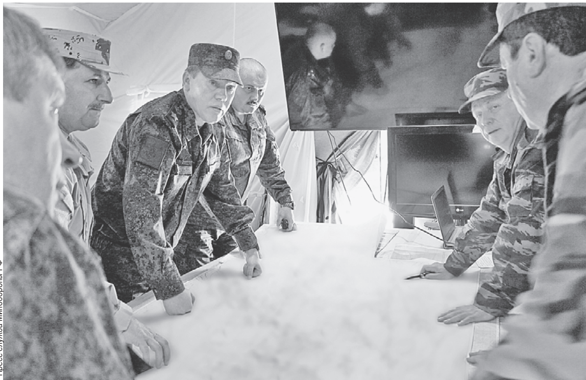
Начальник Генштаба ВС России Валерий Герасимов (на фото - третий слева) постоянно выезжал в Сирию, где доводил до командиров задачи по разгрому боевиков.

Другая важная задача была - организовать управление всеми силами, участвующими в боевых действиях. Для этого был развернут командный пункт нашей группировки в Хмеймиме и пункты управления на направлениях, где ведутся боевые действия.