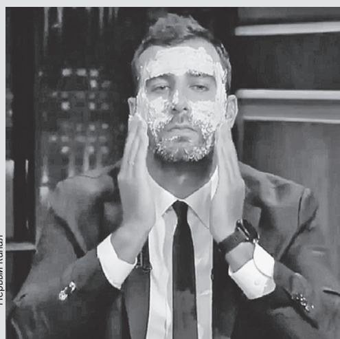
Намазав лицо кремом из соловьиного помета, Иван Ургант придумал шутку, очень расстроившую Владимира Соловьева.