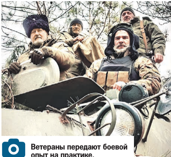
Ветераны передают боевой опыт на практике.

- Претерпели изменение и дополняются в основном пункты Стратегии, связанные с несением казаками государственной и иной службы и патриотическим воспитанием под-