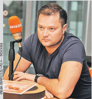
Москва