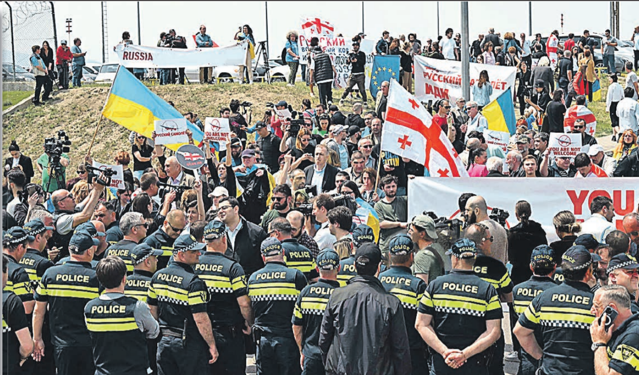
Не более 200 - 300 человек с флагами Грузии, Украины и антироссийскими лозунгами добрались пешком из Тбилиси до аэропорта, в здание которого их не пустила полиция.

Как Грузия встретила первый после 4-летнего перерыва самолет из России. Спецкор «КП» с трудом просочилась в аэропорт Тбилиси, где порадовалась спокойствию полицейских, порадовалась за пассажиров и нарвалась на хамство местных журналистов.