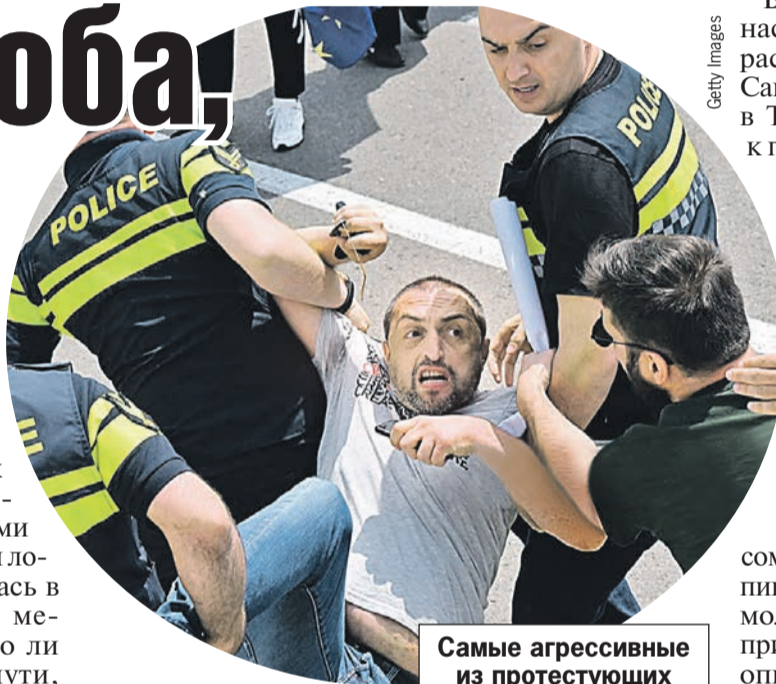
Самые агрессивные из протестующих до аэропорта им. Руставели не добрались.