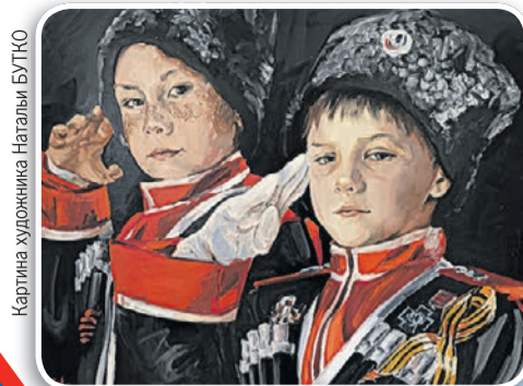
Картина художника Натальи БУТКО