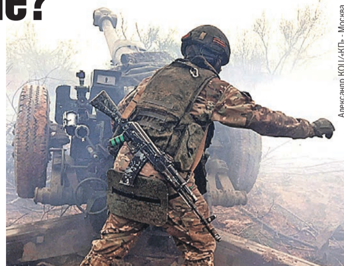
Александр КОЦ - КП - Москва

А пока, в день освобождения Мариуполя, Бахмут опять стал Артемовском.