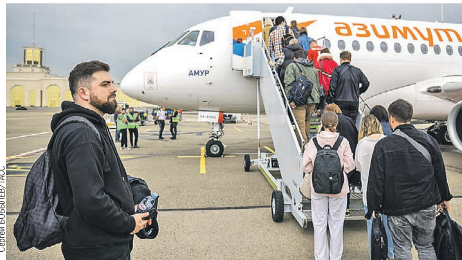
Пассажиры самолета Super Jet 100-95B «Амур» российской компании «Азимут» в Москве не ждали, что в аэропорту Тбилиси не все будут им рады.

- Ожидали такую встречу? - спрашиваю я, перебивая свист оппозиционной толпы.