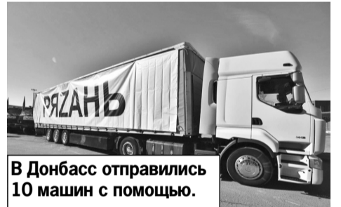
В Донбасс отправились 10 машин с помощью.

Ранее в Донбасс отправилась группа рязанских врачей, чтобы помочь местным специалистам в лечении пациентов.