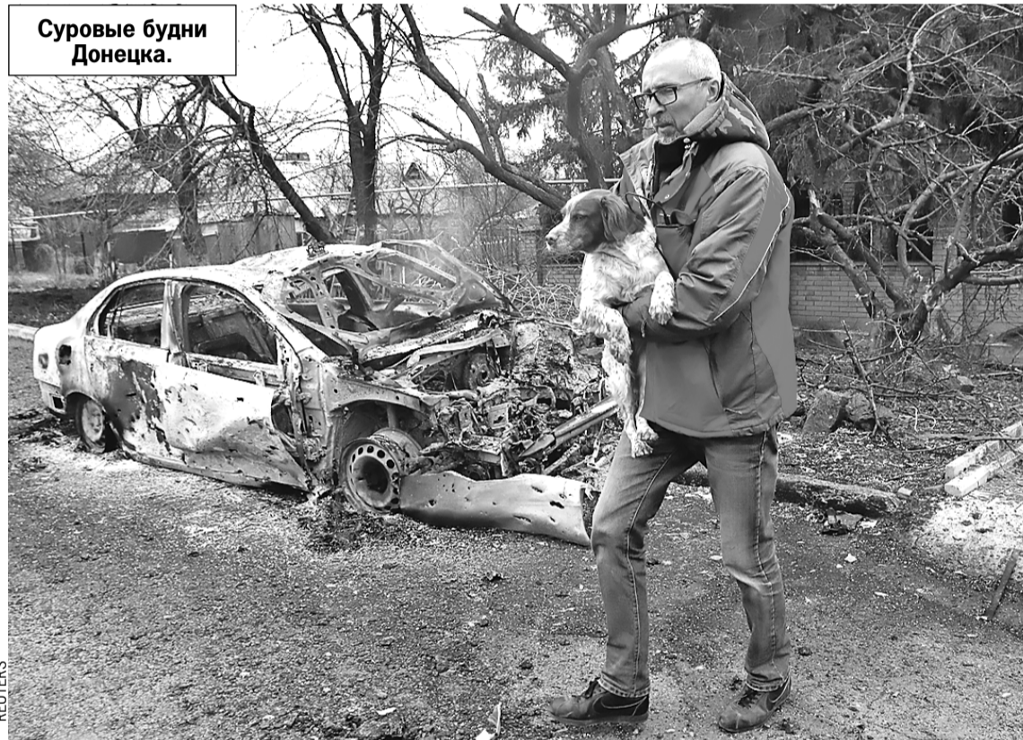
Суровые будни Донецка.

- Но вам даже не показали короткий список тех, кто из культуры понимает и принимает происходящее. Знаете,