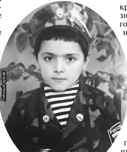
Будущий Герой России мечтал стать десантником с самого детства.