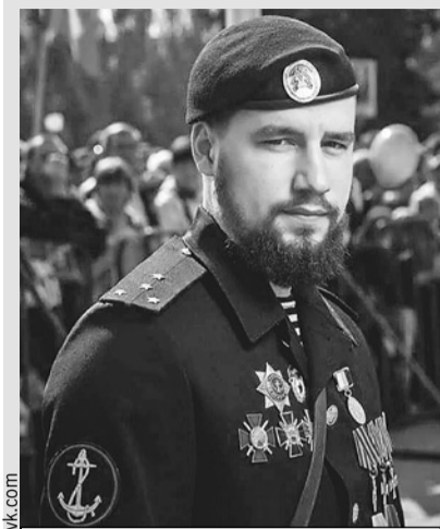
Воха было всего 28 лет. Из них 8 он провел на войне.