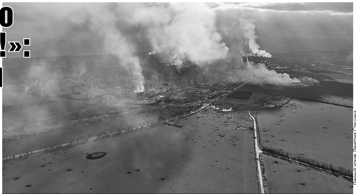
Так выглядят окрестности Мариуполя с высоты.

Он показал мне надпись на экранчике: «Ува! Бійці ЗСУ! (ВСУ, Вооруженные силы Украины. - Авт.) Терміново (срочно. - Авт.) виходьми з Маріуполя!»