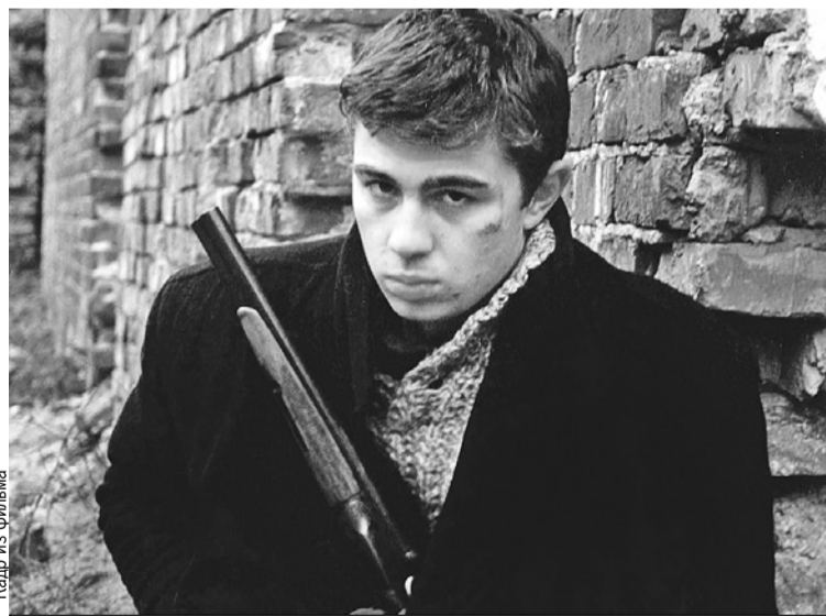
Сергей Бодров завещал нам: «Во время войны нельзя говорить плохо о своих!»

и Донбассу. В Донбасс захлестало за все эти годы считанное количество артистов и музыкантов. Единицы!