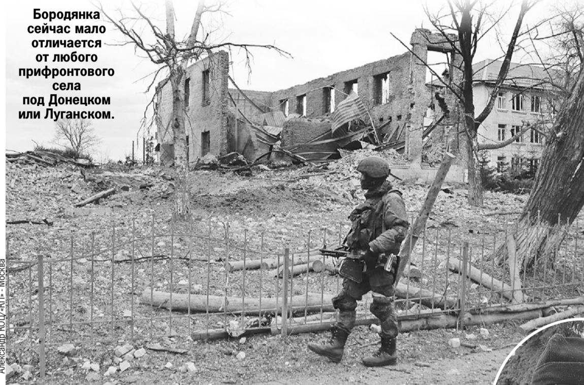
Александр КОЦ «КП» - Москва

Бородянка сейчас мало отличается от любого прифронтового села под Донецком или Луганском.