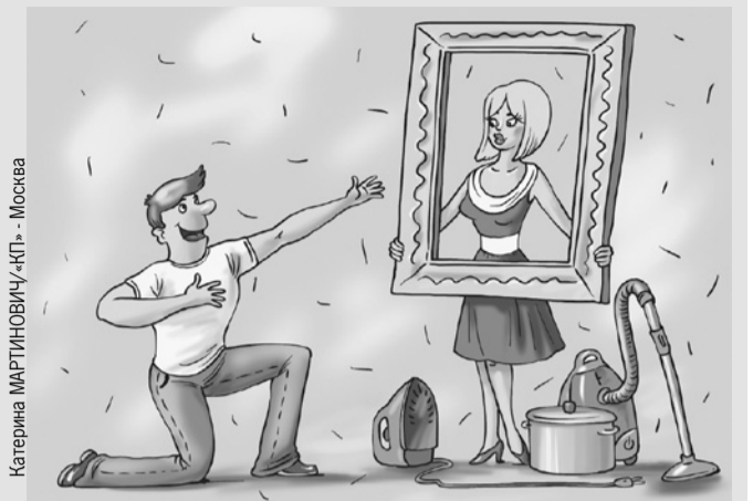
Катерина МАРТИНОВИЧ «КП» - Москва

8 марта многие отмечали Международный женский день. «КП» спросила: