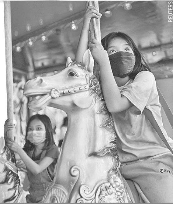
В мире постепенно отменяют ковидные ограничения. Но ношение масок остается обязательным. Например, на Филиппинах это требование касается и детей.

Пока антидепрессанты не входят в клинические рекомендации по лечению и профилактике сердечно-сосудистых осложнений COVID-19,