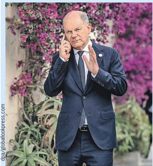
Канцлер Германии не звонил в Кремль с 2022 года.