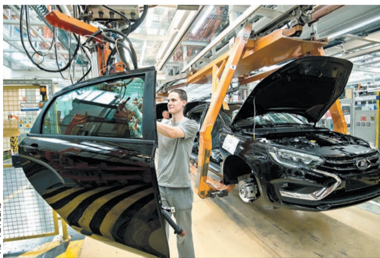
За неполные два года коллектив автозавода увеличился на 10 тысяч человек.

в новом офисе компании «Итэлма». Известный поставщик АВТОВАЗа, эта московская компания оказалась сейчас на острие прогресса. А как иначе, если всю электронику в автомобилях пришлось импортозамещать. Под новые задачи были созданы современные мощности, абсолютно новые лаборатории и цеха. И когда мы слышим в новостях, что тольяттинский автогигант вернул ту или иную опцию, от системы курсовой устойчивости до мультимедиа, - прежде всего эти новости исходят отсюда, из ком-