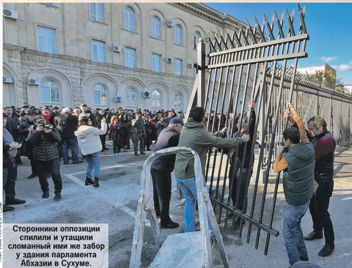
Сторонники оппозиции спилили и утащили сломанный ими же забор у здания парламента Абхазии в Сухуме.

Все так же скромно обставлен. Невзрачные картины, старая мебель. Любой его хозяин понимает: какой смысл украшать? Не через год, так через три выломают дверь и войдут с улицы вот такие люди в черных куртках... Золото хранить в кабинете первого лица Абхазии - как выкинуть.