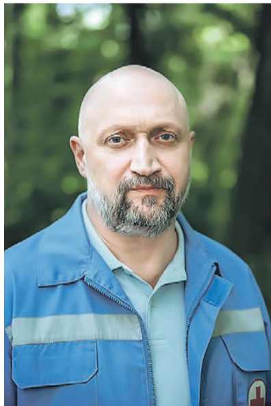
Кулыгина ждет борьба между талантом и внутренними сомнениями.