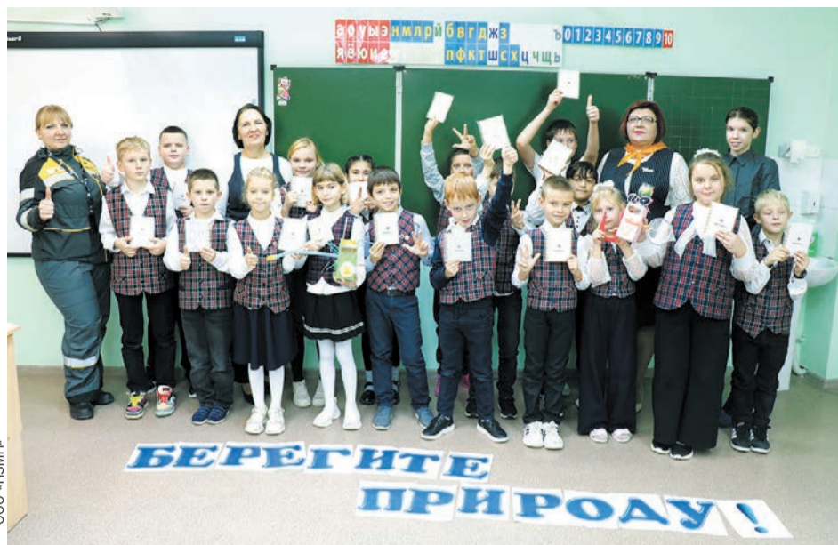
В конце урока дети собрали из букв фразу «Берегите природу».

- Мы рассказали школьникам, что пластик, резиновые покрышки и фольга разлагаются не менее ста лет. Природе наносится непоправимый урон. Поэтому самый оптимальный способ утилизации - переработка этих материалов. Экологические уроки прививают детям навыки грамотного обращения с отходами и помогают сформировать бережное отношение к экологии. С детьми из этой школы в октябре мы выходили на совместный субботник, который прошел на территории ДК «Маяк». Нам