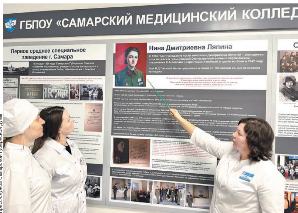
В музее колледжа, носящего имя героической девушки, ей посвящена экспозиция.