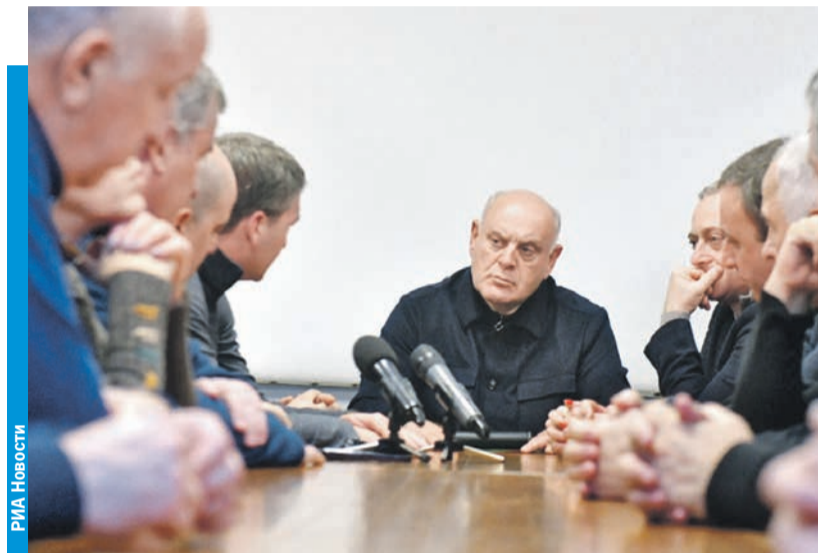
В субботу президент Аслан Бжания провел заседание правительства в селе Тамыш - после того как парламент Абхазии отложил ратификацию соглашения с Россией.

на бордюрик под пальмой и поболтать с мужиками за жизнь.