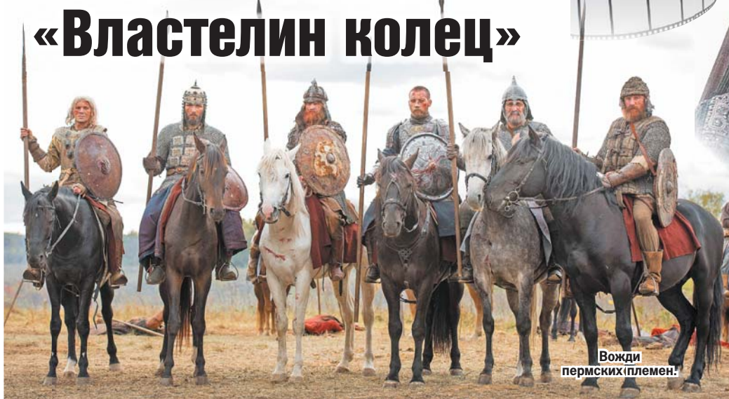
Вожди пермских племен!