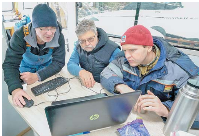
Ученые изучают результаты обследования.

Ученые надеются, что благодаря тому, что пароходы погружены в ил, который не дает доступа к ним кислорода, деревянные корпуса судов смогли сохраниться. В будущем году работы по поиску флота Колчака будут продолжены.