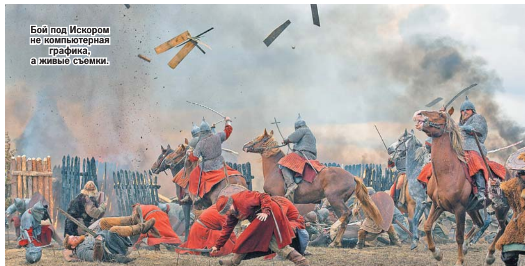
Бой под Искором не компьютерная графика, а живые съемки.

В фильме приняли участие около полутора тысяч жителей Пермского края. Многим из них пришлось ради этого брать на работе отпуск и отгулы.