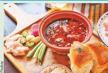
Хозяйки из Приволжья тратят на это блюдо не более 118 рублей.