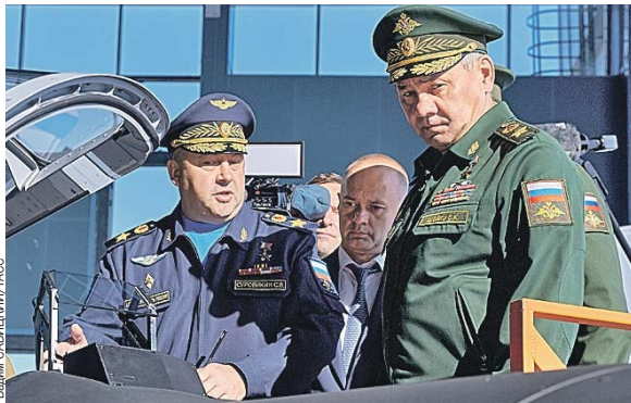
5 лет назад Сергей Суровикин (слева) возглавил Воздушно-космические силы, и ему было что показать главе Минобороны Сергею Шойгу.

С этой должности Сергея Владимировича откомандировали на Украину, где он