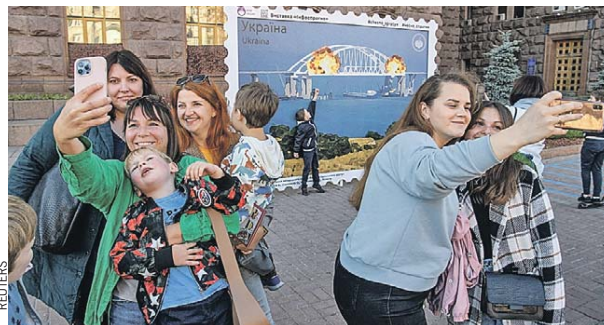
В центре Киева после субботнего взрыва на Крымском мосту жители столицы Украины с улыбками делали селфи на фоне трагической «картинки». Еще не догадываясь, что скоро будет не до смеха... (О том, как отреагировала Россия < стр. 2.)

Водитель первой фуры уже дает показания. Скорее всего, как и шофер второй фуры, он был использован вслепую и не знал о том, что везет.