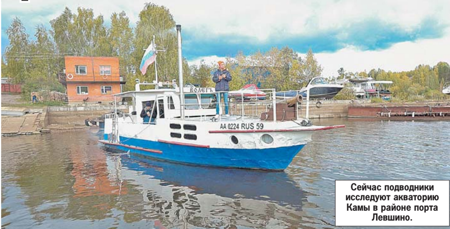
Сейчас подводники исследуют акваторию Камы в районе порта Левшино.

мощь сухопутных частей, действовавших на берегах рек с фронтом в десятки километров.