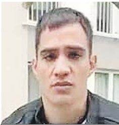
А это владелец красной фуры.

- Раньше он работал на бензовозе в Казани. Попал