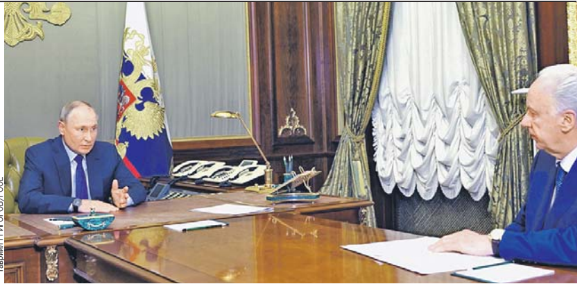
Перед тем как на Украину обрушился удар возмездия, Владимир Путин заслушал доклад главы СК Александра Бастрыкина о расследовании теракта на Крымском мосту.

- Сегодня утром нанесен массированный удар высокоточным оружием большой дальности воздушного, морского и наземного базирования по объектам энергетики, военного управления и связи Украины... В случае продолжения попыток проведения на нашей территории терактов ответы со стороны России будут жесткими и по своим масштабам будут соответствовать уровню угроз, создаваемых России. Ни у кого не должно быть никаких в этом сомнений, - пообещал Путин.