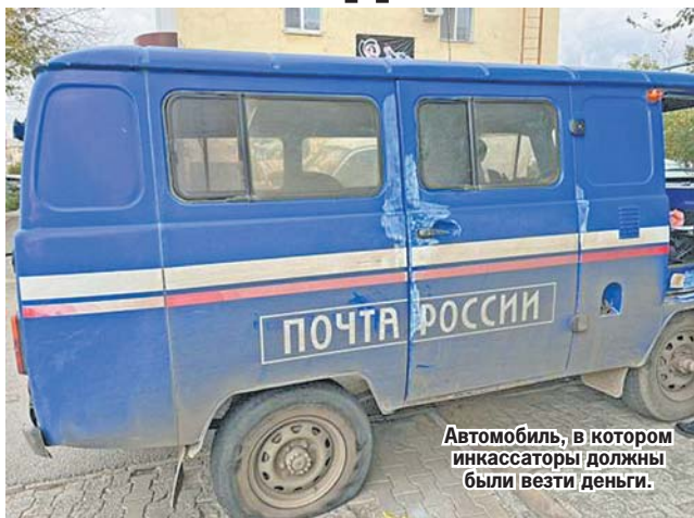
Автомобиль, в котором инкассаторы должны были везти деньги.