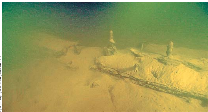
Приборы показали наличие на дне затопленного судна.

Ранее все эти суда принадлежали Верхнекамской флотилии при эвакуации, это не было сделано.