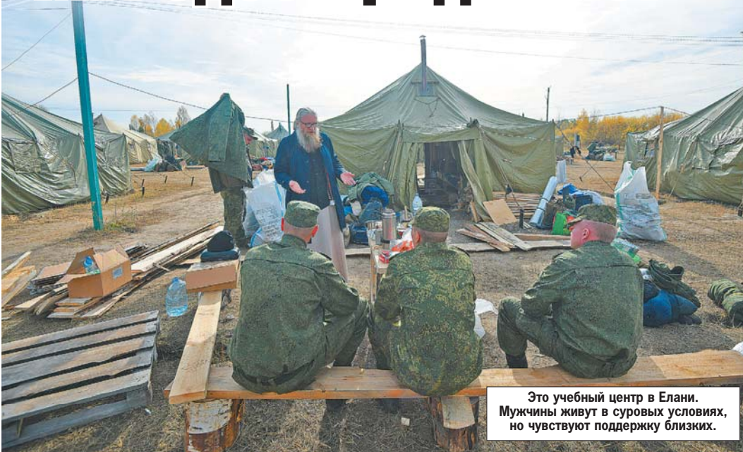
Это учебный центр в Елани. Мужчины живут в суровых условиях, но чувствуют поддержку близких.