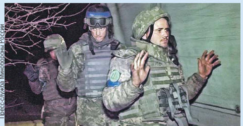
Солдаты ВСУ не очень хотят воевать и при случае сдаются. Эту ситуацию просто надо дожимать.

- Единственная возможная мера установления мира - освободить Украину от националистов. Западцев придется приучить к мысли, что для них все потеряно, они ничего не понимают, кроме силы.