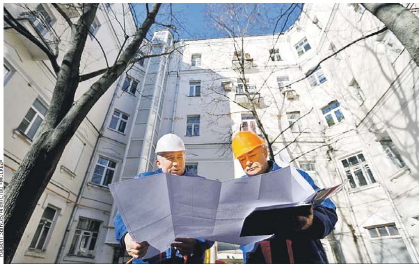
Специалисты жилищной инспекции будут тщательнее следить за качеством ремонта домов. Будем надеяться, что крыши и трубы станут протекать реже.

2022 года, формула расчетов привязана к ключевой ставке Центробанка. Но 28 февраля ставка взлетела аж до 20% годовых. И получалось, что пени за здорово живешь вдруг в одночасье выросли почти вдвое (до этого ставка была 9,5%). Граждан решили все же пожалеть, и ставку для расчетов пени зафиксировали на уровне 9,5% (как было на 27 февраля). Но в итоге опять получилось плохо. Ставка в течение года постепенно понижалась, сейчас она уже 7,5%, а пени рассчитываются исходя из 9,5%. И теперь утверждена новая схема, которая будет действовать до конца этого года: в расчетах применяется та ставка, которая меньше, - либо 9,5%, либо действующая сегодня (см. «Напоминалку «КП»).