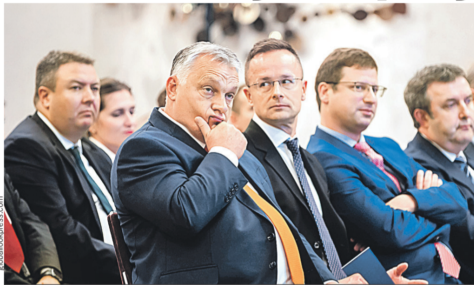
Премьер-министр Венгрии Виктор Орбан (на фото - на переднем плане) старается не прогибаться под давлением Евросоюза. Но противостоять бюрократам из Брюсселя ему все труднее.

Прошлым летом Еврокомиссия потребовала упразднить дисциплинар-