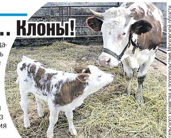
Теленок Декабристка и ее мама Цветочек священные коровы - пока что для ученых.

только вывести животных с определенным характером. Гены влияют только на физиологию скотины. Так что если мечтали о покладистой ГМО-кошке, которая не устраивает ночной тыгыдык и не метит обувь из вредности, тут извините, против природы не попрешь. Пока что.