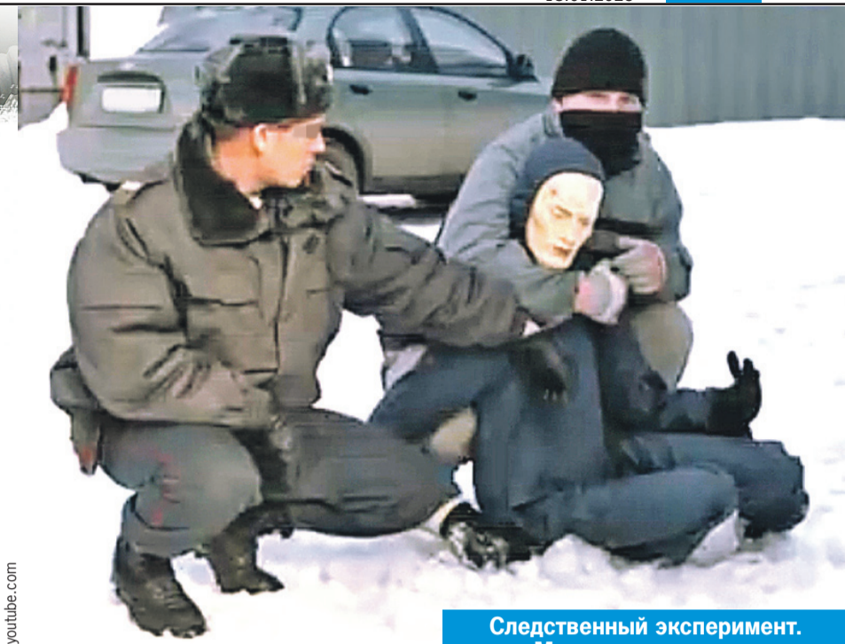
Следственный эксперимент. Маньяк показывает, как он творил свое черное дело.