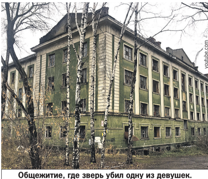
Общежитие, где зверь убил одну из девушек.

Родители серийного насильника и убийцы так и не поверили в виновность сына. Мать ходила с диктофоном в общежитие и искала доказательства, что свидетелей запугали, взяла кредит на адвоката, потом жила