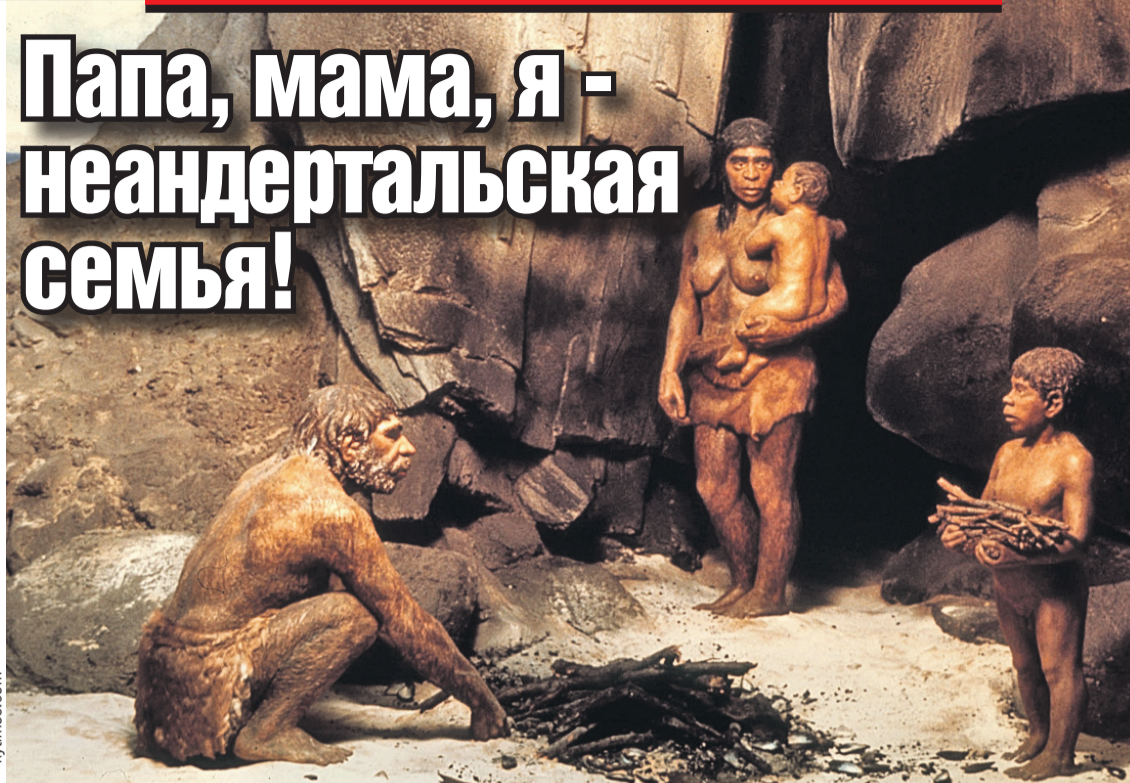
Так видит художник первобытную семью с Алтая. В двух соседних пещерах жил целый клан, 11 человек.

неандертальца и денисовца, что тоже стало сенсацией в свое время.