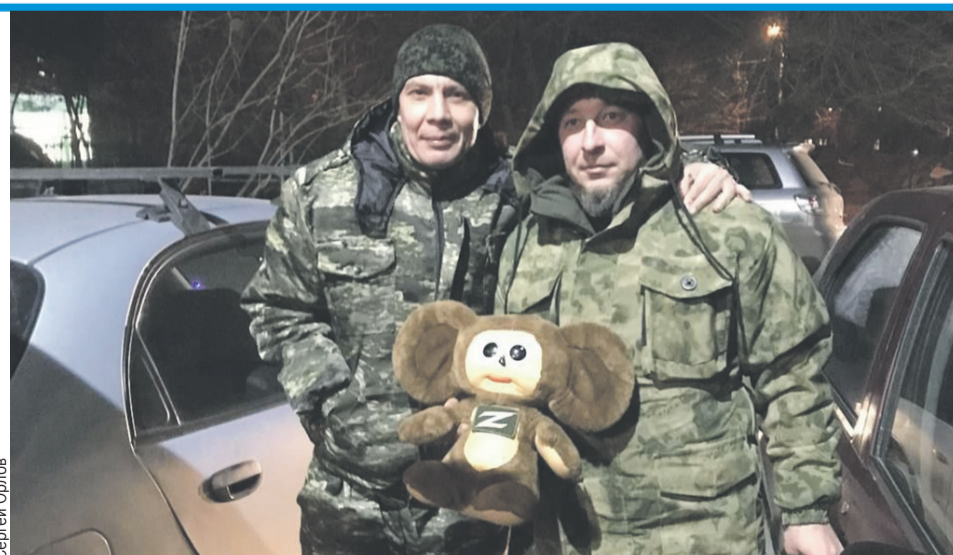
Плюшевую игрушку передали военным.

Чебурашка стал безумно популярным после выхода в прокат одноименного фильма. Это стало настоящим событием в России. Популярность картины растет в геометрической прогрессии.