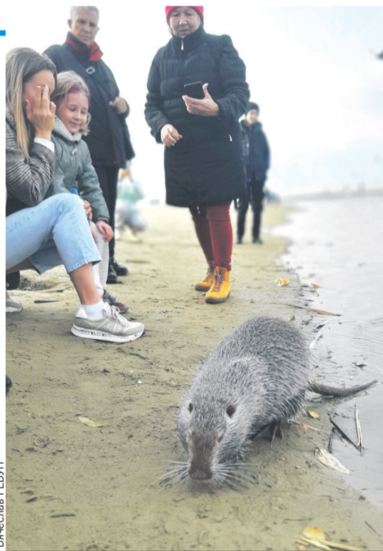
Анапыч не боится внимания людей.

Вкусняшки, которые приносили с собой люди, вынуждали Анапыча все чаще выбираться на берег. Как можно отказаться от хрустящей морковки или сочного яблока? Так, шаг за шагом нутрия осме-