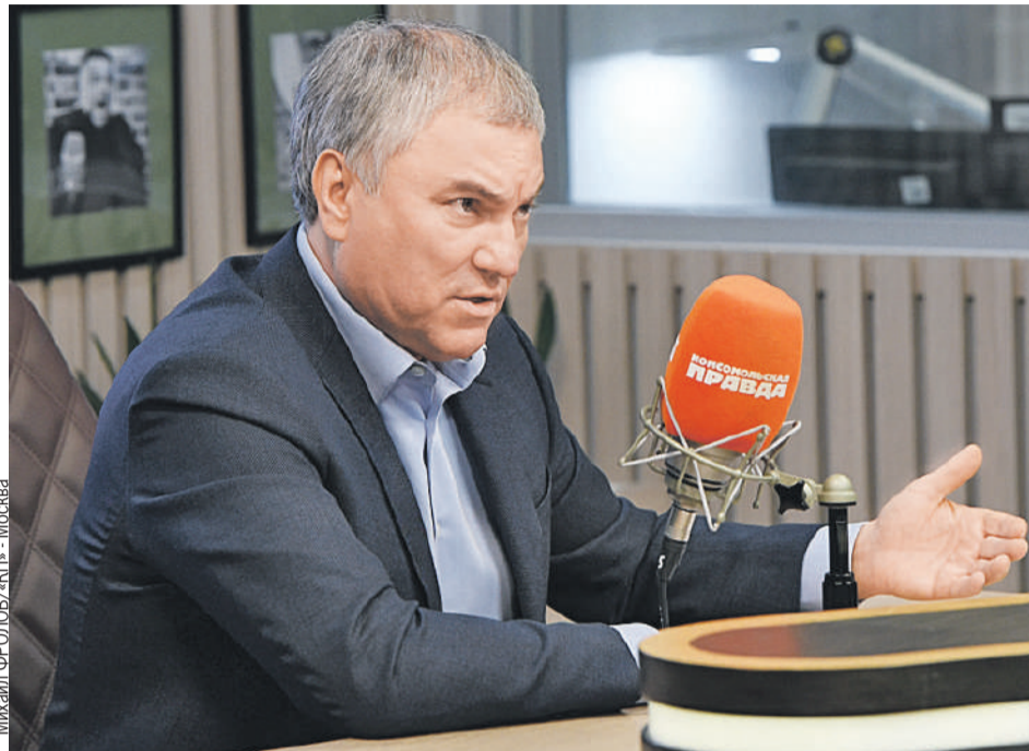
Вячеслав Володин в студии Радио «Комсомольская правда»: «Дальнейшая судьба освобожденных территорий Украины должна зависеть только от их населения».

А что касается «не договорившихся политиков», то они всем известны. Зеленский, Байден, главы стран НАТО. К ним вопросы. К нам какие вопросы? Мы предлагали диалог. Мы его вели. Но когда возможности дипломатии были исчерпаны и угроза пришла в наш дом, началась операция. И надо исходить из того, что граждане нашей страны