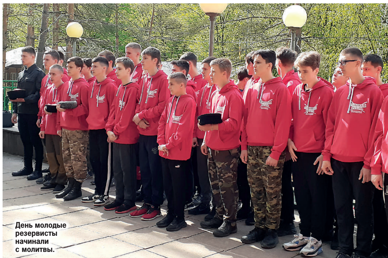
День молодые резервисты начинали с молитвы.