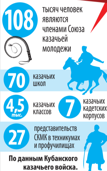
Ловкость и сила - достоинства казака.