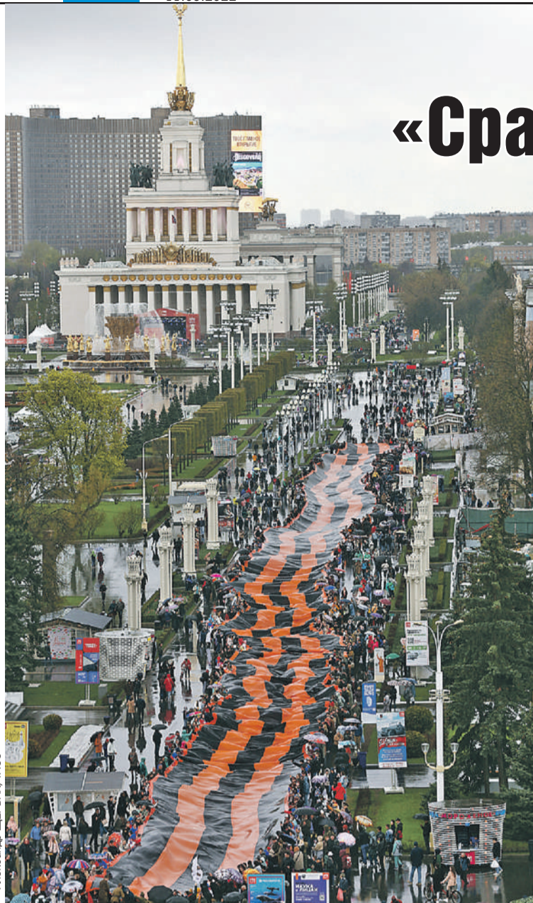
9 Мая в Москве на ВДНХ развернули георгиевскую ленту длиной 370 метров и шириной 7 метров.