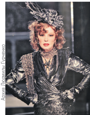
Архив Людмилы Гурченко

Этот головной убор сделан в 1980-е годы из шелка, золотого шитья, стекляруса, бисера, жемчуга, латуни, стразов и другого материала. Гурченко доработала шляпку лично - сверху нашла брошь с жемчужинами и часто выступала в ней на концертах.