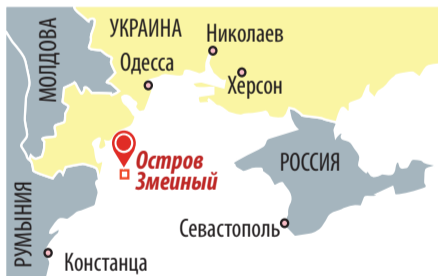
Украинский остров в Черном море. Входит в состав Измаильского района Одесской области. Площадь - 0,17 км².