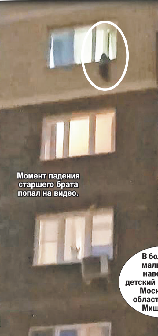
Момент падения старшего брата попал на видео.