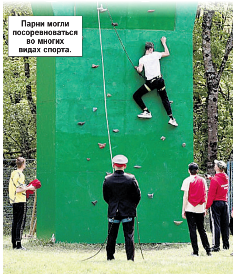
Парни могли посоревноваться во многих видах спорта.