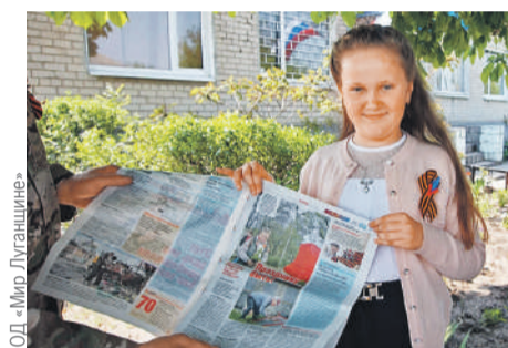
Од «Мир Луганщине»