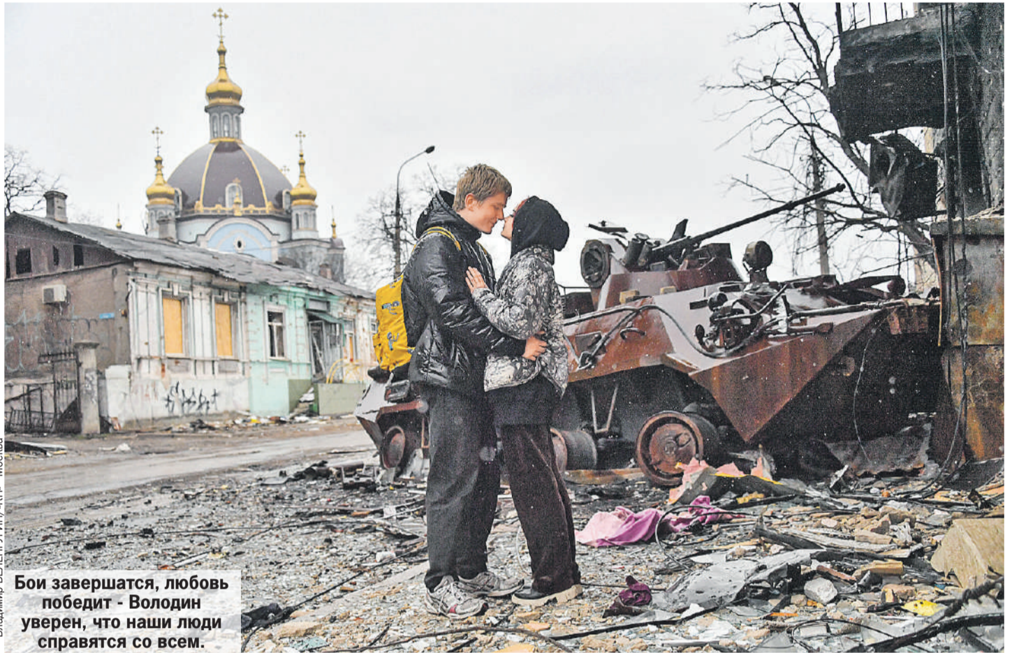
Бои завершатся, любовь победит - Володин уверен, что наши люди справятся со всем.