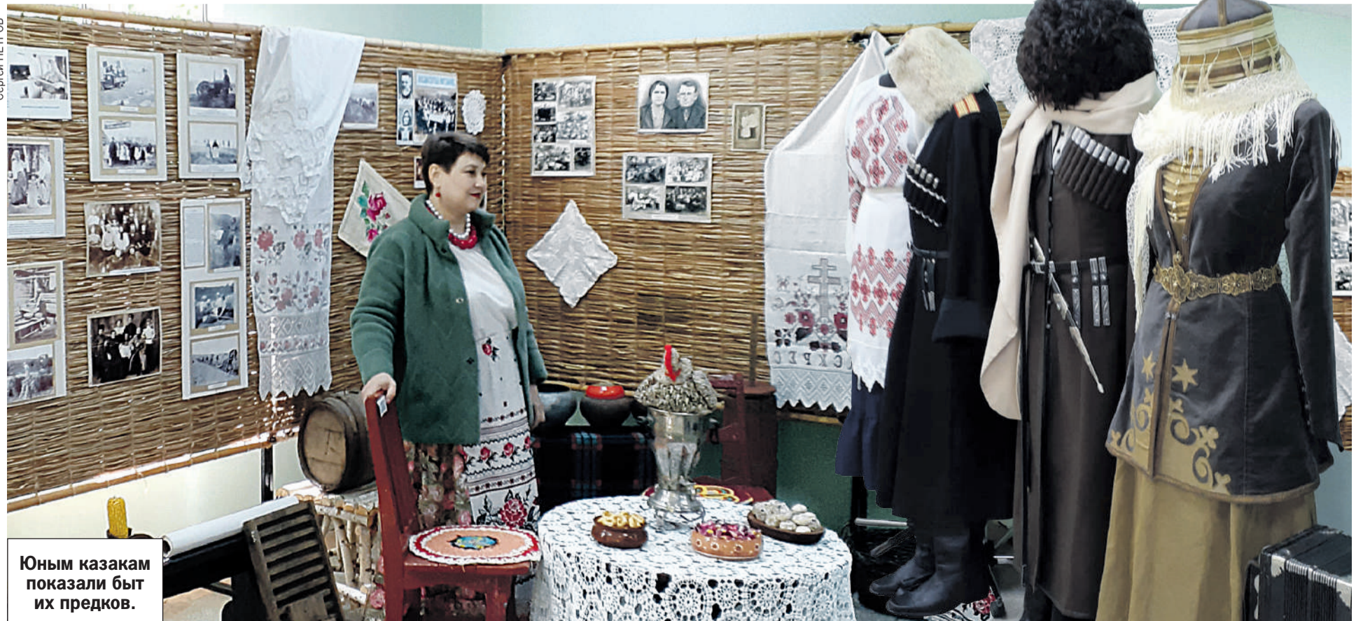
Юным казакам показали быт их предков.

- Атаманы казачьих школ - это прежде всего ребята - в активной жизненной позиции, - сказал Александр Власов. - Вы долж-