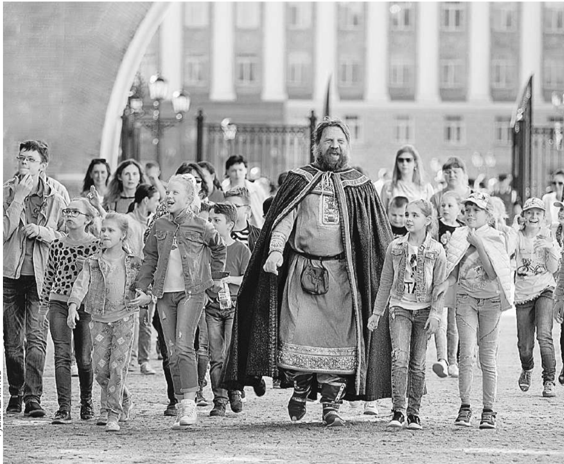
Российско-американская конференция прошла в городе, в котором гармонично сочетаются история и современность, сохраняются культурные традиции.

вательные связи, которые помогают нам в период политического противостояния, - подчеркнул Томас Лири.