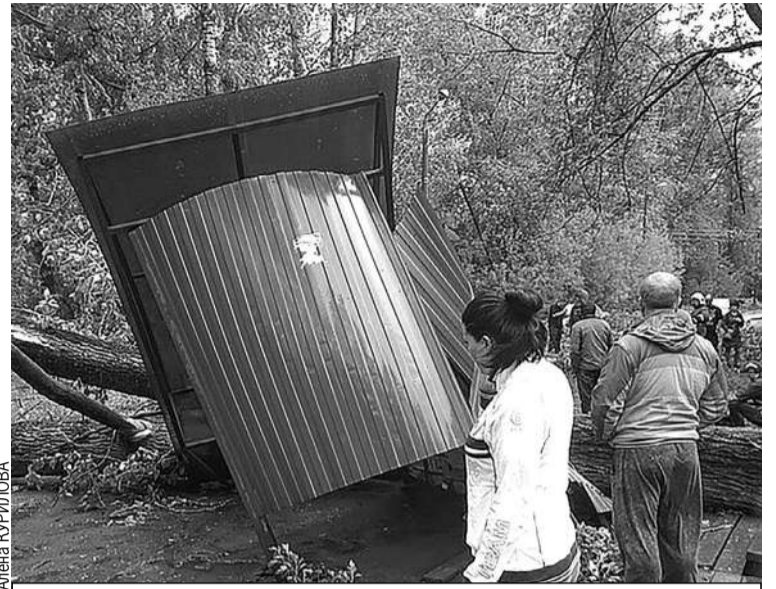
В воскресенье по городу буквально летали остановки.

Еще больше фото и видео последствий разгула стихии смотрите на сайте kirov.kp.ru