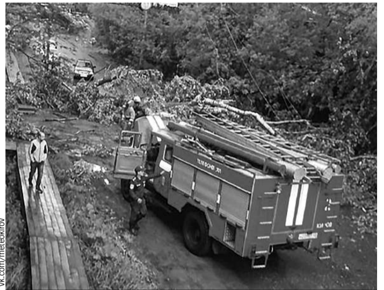
Сотрудники МЧС и коммунальщики почти сутки убирали улицы Кирова.