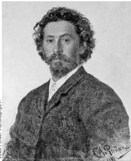
Илья Репин «Автопортрет»