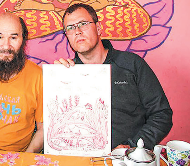
Рисунки алтайского художника Таркай.

«Шляпники» советуют в самом Горно-Алтайске, имени А. В. Анохина. В тысячах экспонатов, экспонату на нескольких этажах. Как выглядят коренные с их традициями и даже ю Алтайской принцессы. «Шляпники» предлагают в «Кето» заработать наклейку «Здесь безумно хорошо!». а, уютные номера и даже тут приготовить что-то по