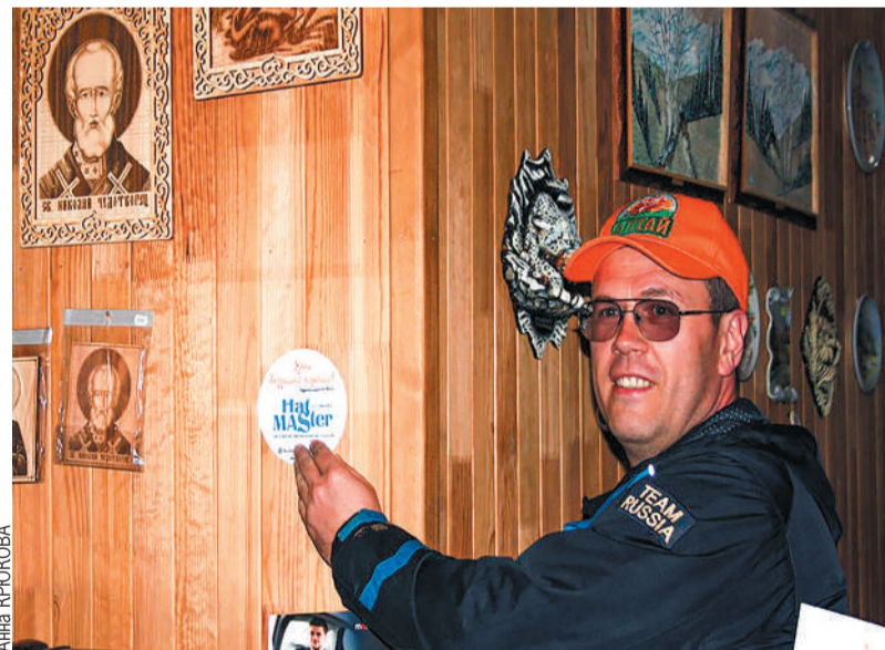
Еще один отель на Алтае получил наклейку качества от наших путешественников.