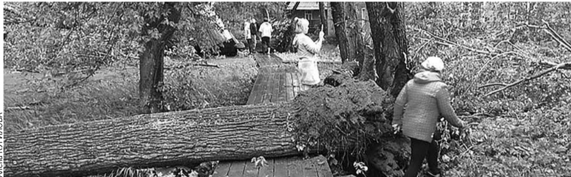
Упавшие тополя не только разрушили остановку, но и придавили двух мужчин.