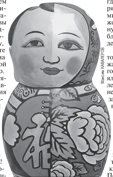
Даже матрешки на Дальнем Востоке двуликие - русско-китайские...