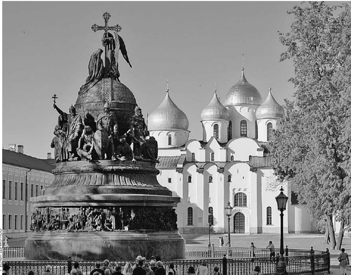
В монументе «Тысячелетие России», установленном в Новгороде в XIX веке, отражены история становления государства и ее творцы.

На повестке второго дня конференции «Диалог Форт-Росс» были вопросы кибербезопасности. Участники обсудили перспективы развития информационной