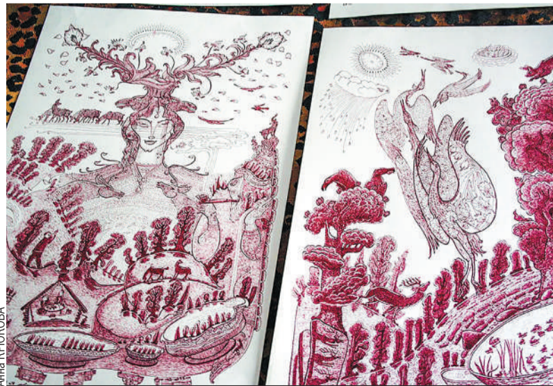
Работы художника Таракай есть в доме у каждого алтайца.

✓ Следующее место, где побывать, находится уже в этом Национальном музее, в нем хранится около 66 тысяч экспонатов. В экспозиции расположены сразу три здания-памятника. Там туристы смогут узнать историю алтайцев, познакомиться с традициями алтайцев, увидеть настоящую мумию, узнать историю олимпийского чемпиона. А остановиться «шляпников» можно в «дровом доме». Это место от путешественников «Золотого Алтая» известно. В доме есть все удобства: кухня, где туристы смогут приготовить еду по своему желанию.