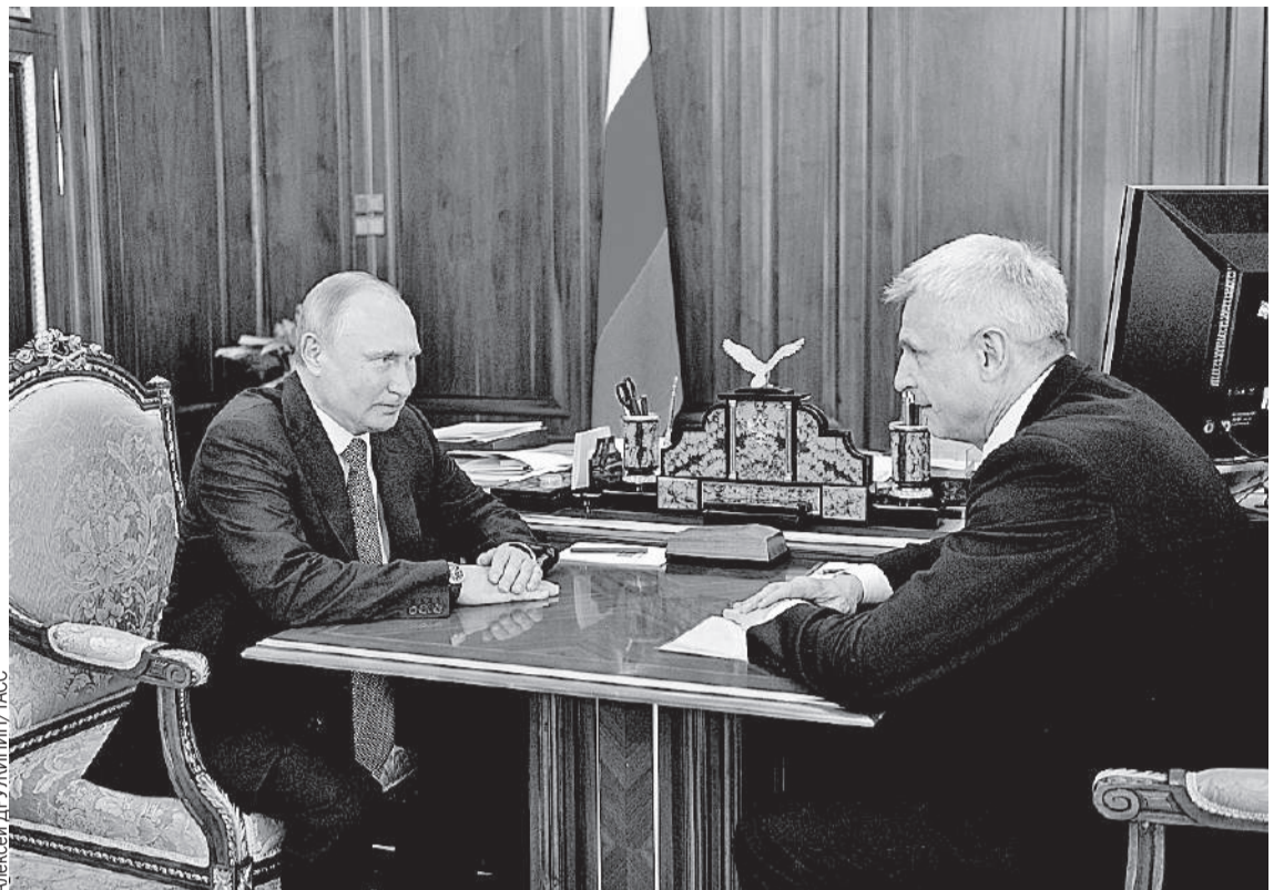
Уже сложилась традиция - перед назначением нового и. о. главы региона Владимир Путин встречается с ним лично для напутствий. Сергея Носова (на фото - справа) президент вчера отправил в Магадан - возглавлять область. И уже осенью подтвердить доверие Кремля, избравшись губернатором на прямых выборах в регионе.

собрал на срочную пресс-конференцию для журналистов, объявил о своей отставке глава республики Егор Борисов. «Я принял осознанное решение об отставке по собственному желанию. Считаю, что сегодня назрел этот момент. Республике нужен новый руководитель. Хочу поблагодарить народ Якутии за доверие, а Президента России - за поддержку и понимание», - на-