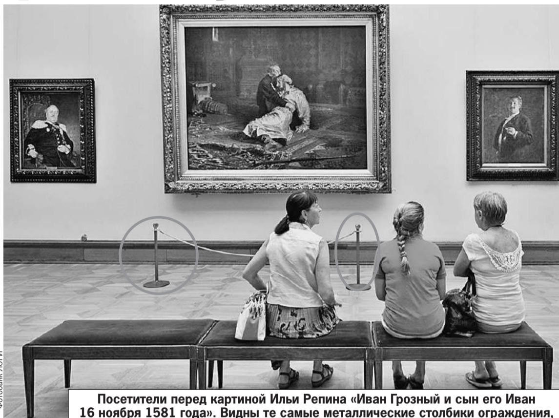
Посетители перед картиной Ильи Репина «Иван Грозный и сын его Иван 16 ноября 1581 года». Видны те самые металлические столбики ограждения, одним из которых вандал и разбил защитное стекло.

- Может быть. Но оно на порядок дороже и очень тяжелое. И это-то нелегкое. Его, кстати, в прошлом году снимали, почистили и проверили крепления - все в порядке было. Такое стекло - новая и современная защита. В Третьяковской галерее постоянно идет замена и установка таких музейных стекол. Далеко не все картины ими защищены. Нужны колоссальные средства. В галерее до сих пор кое-где остались еще довоенные стекла. Они такие как бы пузырчатые.