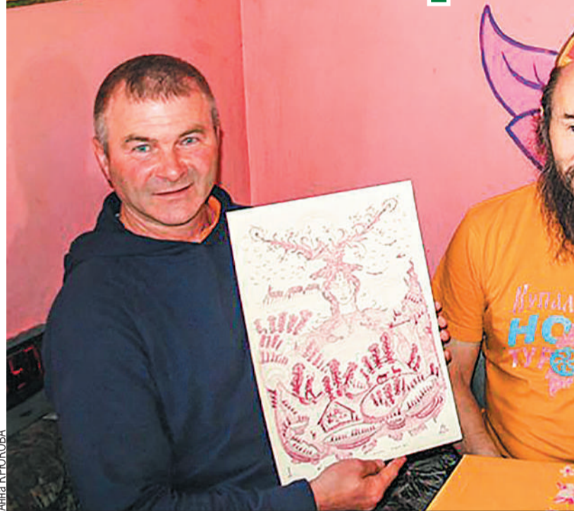
В Вятские Поляны уедут несколько ри...