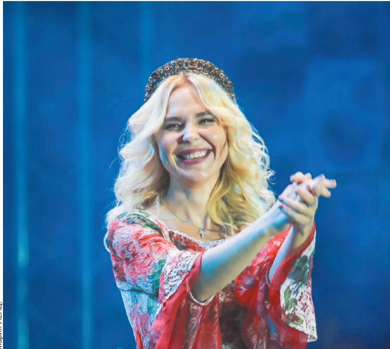
Пелагея - певица и основательница одноименной группы прославилась исполнением русских народных песен и романсов, а также этнических песен разных народов.

Фестиваль объединит в себе науку, творчество и новейшие технологии. В его рамках российские и зарубежные ученые обсудят развитие палеонтологического комплекса, для гостей будут работать несколько локаций активного и образовательного отдыха. В рамках