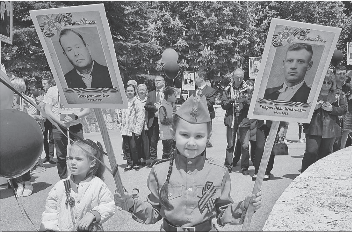
Несмотря ни на что, в Анкаре в этом году прошел «Бессмертный полк».

гий. - Они трудяги. Видишь бледного чудака, бредущего с пляжа, - он! Под зонтом программировал. Вот кого много - так это праздных балбесов. Деток от армии прячут. Напокупали в свое время недвижимости, теперь вспомнили, приехали. Сынкам по 17 - 18 лет, а с ними бабушка или тетюшка для контроля. Вот и живут на квартирах, домах, виллах. Пережидают. А прав батюшка.