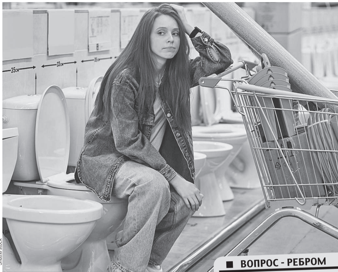
- Что ж в нем такого-то, раз он стоит таких денег?..

Причина роста цен очевидна. Рынок сантехники испытывает те же проблемы, что и все остальные. Многие западные компании приостановили работу в России. Сантехнику из Европы сейчас не везут вообще. А когда какого-то товара на рынке становится меньше и спрос превышает предложение, вещь дорожает.