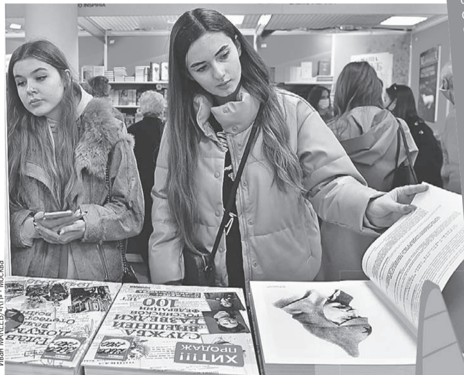
Иван МАКЕЕВ/«КП» - Москва

По анализу редакционной группы конкурса замечено, что конкурсанты почти не пишут о любви, приключениях и романтике, о чем во все времена мечтала и грезила юность. Зато их привлекают вопросы психологии, поиска себя, многие авторы уходят или в мрачную антиутопию, или в мир фантазий. Также приходят работы на темы патриотизма, созидания, на реальные триггеры в обществе - темы военных конфликтов и пандемий.