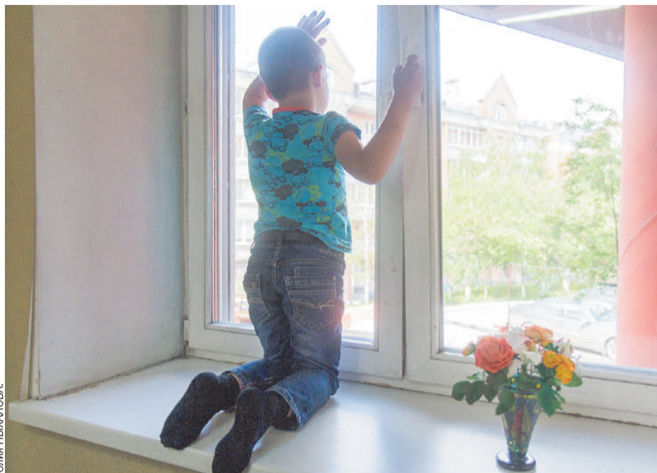
Главной причиной подобных несчастных случаев становится уверенность взрослых в том, что за несколько минут их отсутствия в комнате, где находится ребенок, с ним ничего не случится.

По статистике, чаще всего в Кузбассе с высоты падают дети дошкольного возраста - от двух до шести лет. В реги-