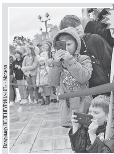
Владимир ВЕЛЕНГУРИН / «КТ» - Москва

Москва Санкт-Петербург Екатеринбург Новосибирск Казань Нижний Новгород Волгоград Омск Ростов-на-Дону Самара Челябинск Уфа Воронеж Краснодар Красноярск Пермь