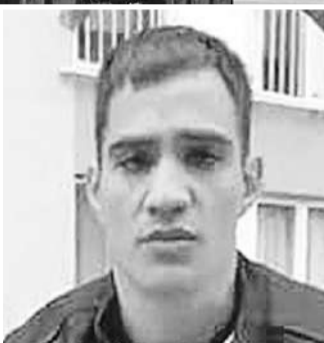
А это владелец красной фуры.