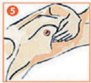
5 Обследуйте молочные железы круговыми движениями в положении лежа.