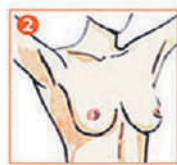
2 Поднимите руки за голову и осмотрите груди на предмет изменения формы или размеров, цвета кожи одной из них.