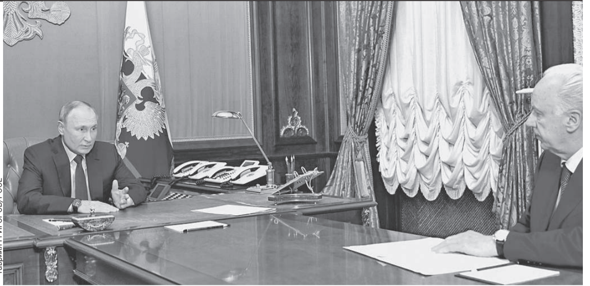
Перед тем как на Украину обрушился удар возмездия, Владимир Путин заслушал доклад главы СК Александра Бастрыкина о расследовании теракта на Крымском мосту.

- Сегодня утром нанесен массированный удар высокоточным оружием большой дальности воздушного, морского и наземного базирования по объектам энергетики, военного управления и связи Украины... В случае продолжения попыток проведения на нашей территории терактов ответы со стороны России будут жесткими и по своим масштабам будут соответствовать уровню угроз, создаваемых Россией. Ни у кого не должно быть никаких в этом сомнений, - пообещал Путин.