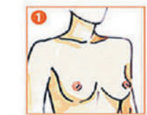
1 С опущенными руками осмотрите перед зеркалом груди.