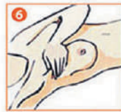
6 Прощупайте левую и правую подмышечные впадины.

Манипуляция считается безопасной, гамма-детектор имеет международный и российский сертификаты. Методика отработана, одобрена международным противораковым союзом, включена в клинические рекомендации Минздрава России для использования при раке молочной железы.