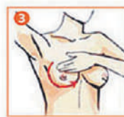
3 Запрокинув правую руку за голову, круговыми движениями прощупывайте правую грудь. Внимание - на возможные припухлости и утолщения. Повторите то же с левой грудью.