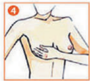
4 Сдавите сосок у его основания и посмотрите, есть ли какие-либо выделения.