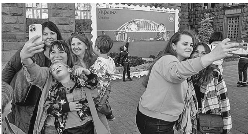
В центре Киева после субботнего взрыва на Крымском мосту жители столицы Украины с улыбками делали селфи на фоне трагической «картинки». Еще не догадываясь, что скоро будет не до смеха... (О том, как отреагировала Россия < стр. 2.)

Водитель первой фуры уже дает показания. Скорее всего, как и шофер второй фуры, он был использован вслепую и не знал о том, что везет.