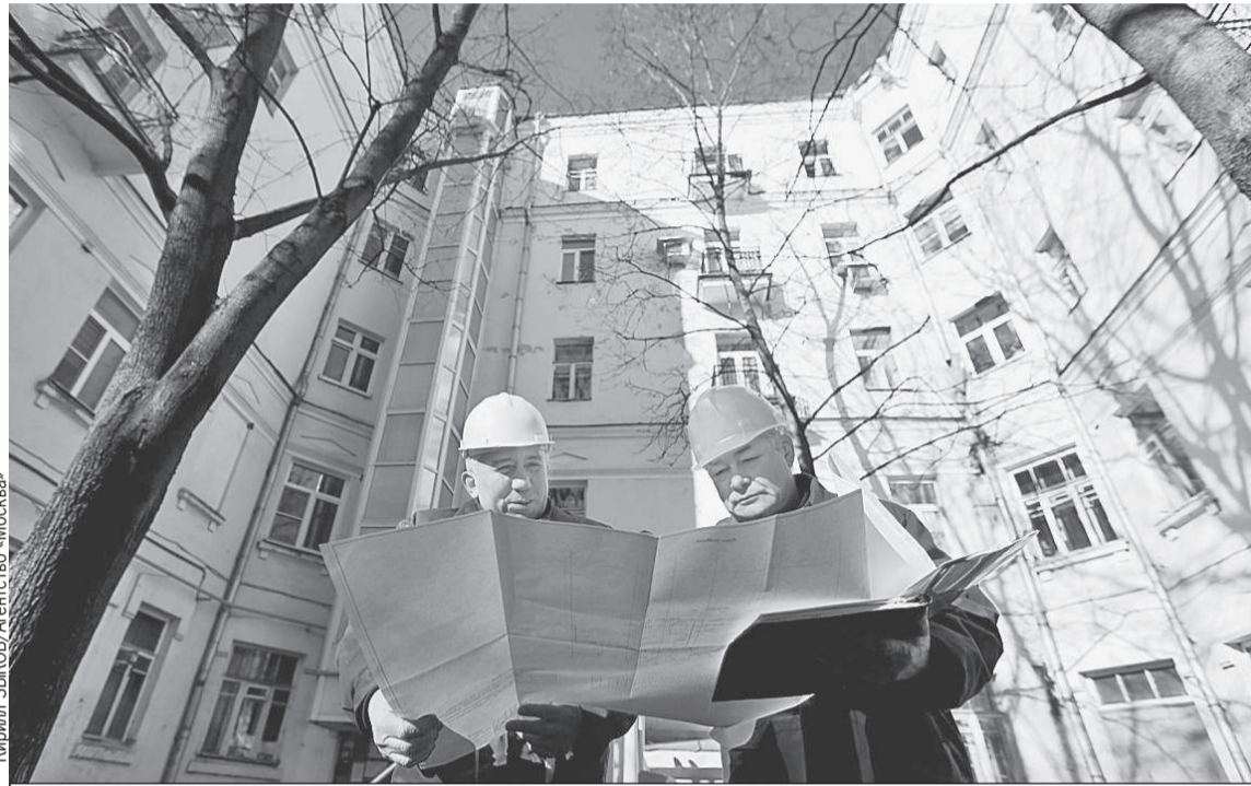
Специалисты жилищной инспекции будут тщательнее следить за качеством ремонта домов. Будем надеяться, что крыши и трубы станут протекать реже.

А теперь подробности (будет сложно, но мы разберемся). Правила расчета пени в этом году меняют уже не первый раз. Предыстория такая. По общему правилу, которое действовало до февраля