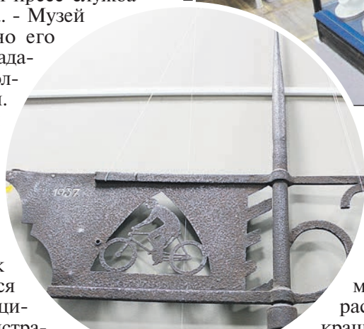
Флюгер со старинного здания в Тильзите.