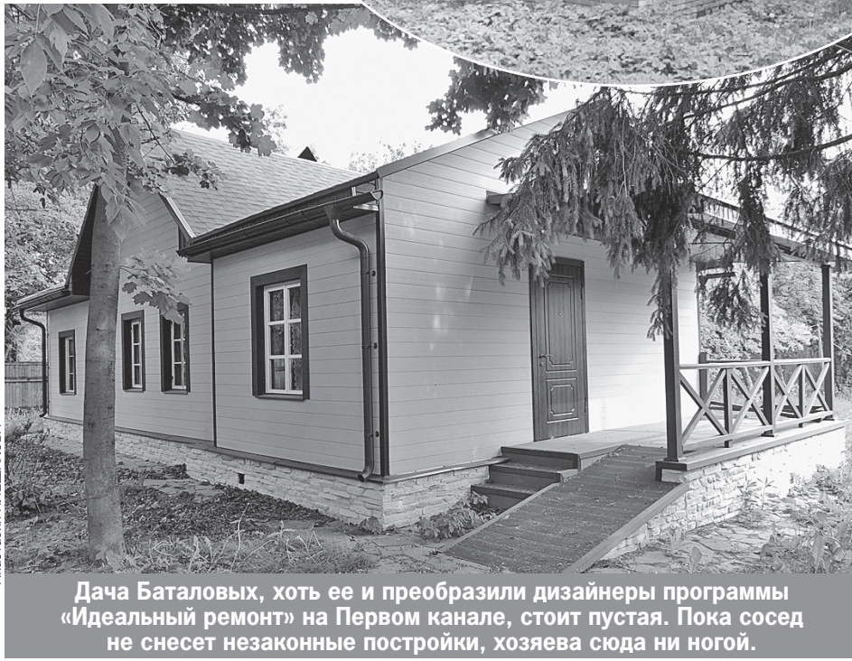
Дача Баталовых, хоть ее и преобразили дизайнеры программы «Идеальный ремонт» на Первом канале, стоит пустая. Пока сосед не снесет незаконные постройки, хозяева сюда ни ногой.