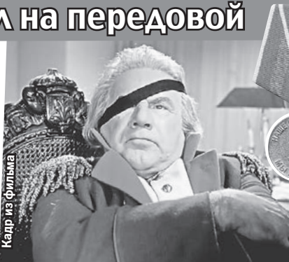
На войне Игорь Ильинский был рядовым фронтовой бригады. До звания фельдмаршала было еще 20 лет - фильм «Гусарская баллада», где он сыграл Кутузова, вышел в 1962 году.

Он не мог смириться с ужасами военной жизни - его пугала не столько опасность, сколько обыденность гибели: «...В враге я вижу наш исковерканный обгоревший танк. Он уже несколько дней стоит здесь. Я заглядываю внутрь и вижу обгорелый и обуглившийся труп, слившийся с рулевым управлением.