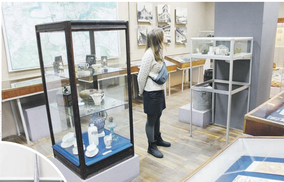
Коллекция городского музея Советска насчитывает около четырех тысяч экспонатов.

— Сегодня на оперативном совещании заслушали информацию о ходе исполнения бюджета Советского городского округа за первый квартал текущего года, — писал Воищев в Фейс-