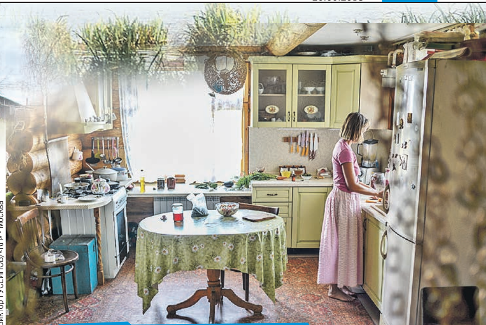
Переехавшие из мегаполисов устраивают свой деревенский быт не по сельским обычаям - по городским, чтобы не только красиво было, но и быт облегчалось...

- Тогда все очень плохо, особенно в малых городах. Картины, как в 90-х. Есть у нас еще один пока невостребованный ресурс - малые предприятия в сельской местности. За счет чего рванул Китай? Большинство пластмассовых китайских игрушек сделано в сельской местности. В царской России село делало все что угодно - от карет до стекла. И даже в СССР была промыс-