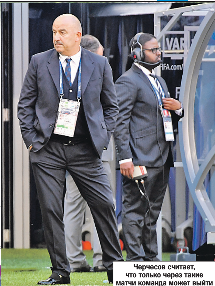
Черчесов считает, что только через такие матчи команда может выйти на новый уровень.

целом турнире, спрессовалось для нас в какие-то 36 минут матча с Уругваем.