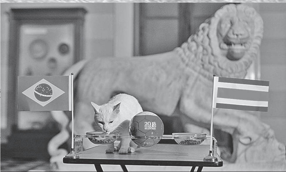
Кот-оракул Ахилл предсказал победу сборной Бразилии над Коста-Рикой. Пентакампионы выиграли 2:0, забив два мяча в самом конце игры.