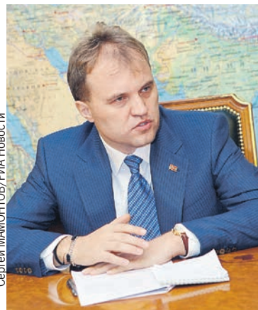
Евгений Шевчук несколько лет возглавлял Приднестровье.

- Большинство граждан всегда выступали против вывода российских миротворцев. Российские войска - в зоне разделения между вооруженными силами Молдавии и Приднестровья они являются сдерживающим фактором. Чтобы противоречия в экономической и политической плоскости не перетекли в агрессивную форму.