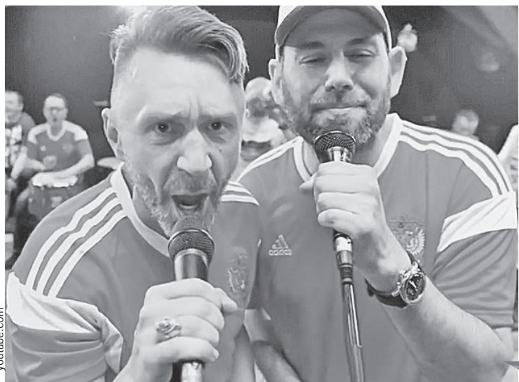
Шнур (слева) в случае поражения нашей сборной напишет новую песню...

* В группах А и В третьи матчи были сыграны вчера после подписания номера.