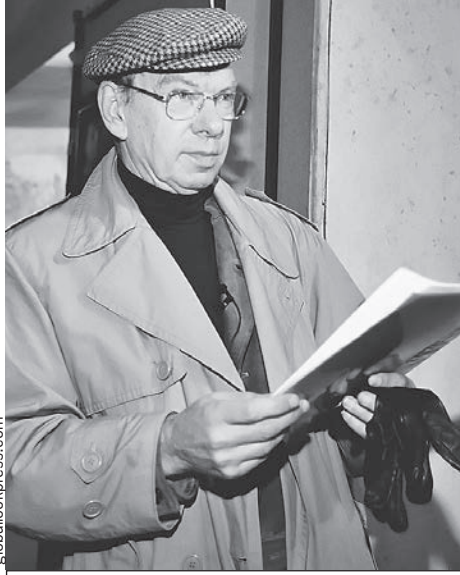
Алексея Баталова не стало 15 июня 2017 года. Народному артисту СССР было 88 лет.