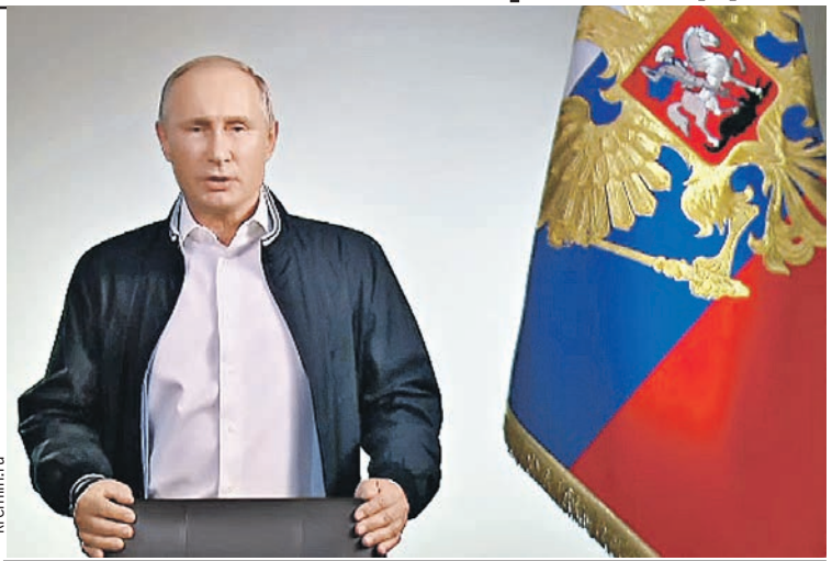
Владимир Путин поздравил выпускников школ 2018 года в соцсети, которая сегодня наиболее популярна у тинейджеров.

- Вы быстро осваиваете новые технологии, уже многое знаете и умеете. В этом ваша заслуга - и искренняя благодарность вашим родителям, учителям, наставникам за труд, мудрость и терпение.