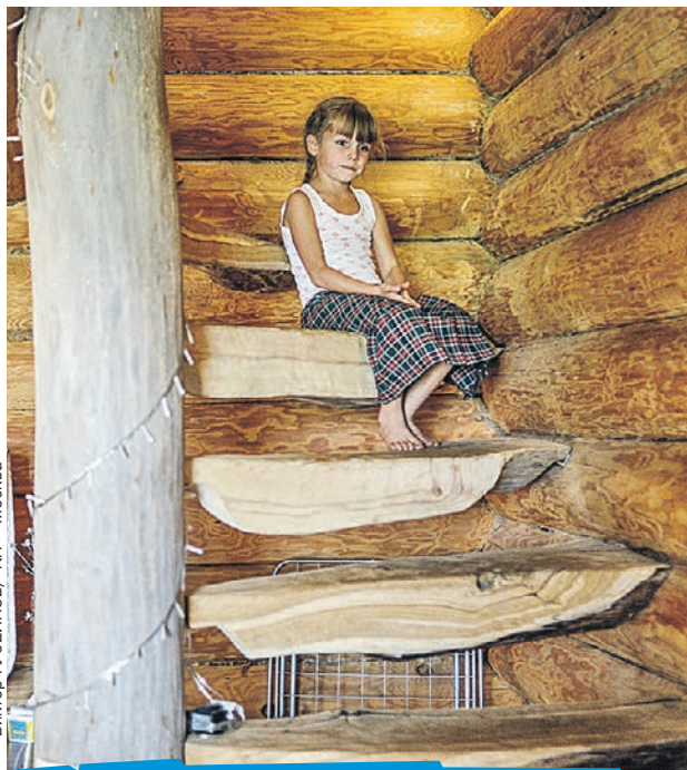
В новых деревнях новых сельских русских все экологично - даже ступеньки в доме.

людей умерло. Умирили одиночки-алкоголики, умирали и сгорали в своих домах целыми пьющими семьями. А статистика говорит, что употребление алкоголя стало снижаться только в последние годы. Руководители сельхозпредприятий так мне и говорят: «В брежневские времена квасили все, начиная с руководителей районов». Люди