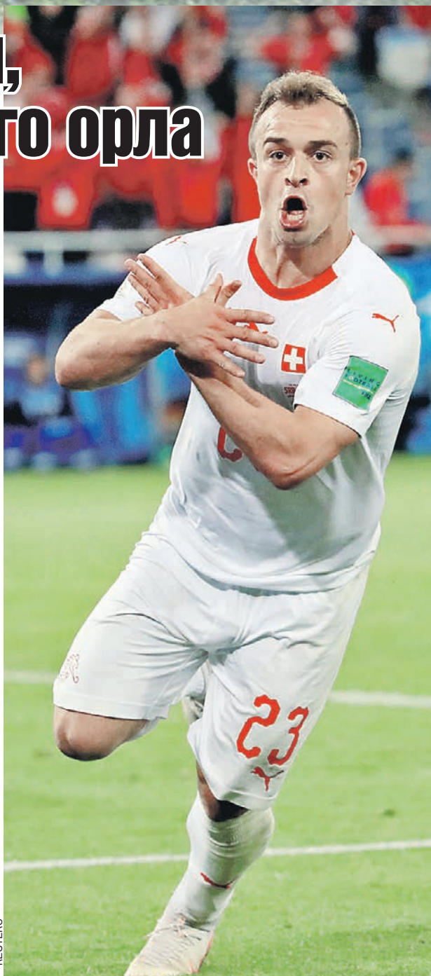
Джердан Шакири умудрился на поле спровоцировать международный конфликт.

Сербы негодуют, говорят о двойных стандартах и о том, что чиновники пытаются спустить весь этот скандал на тормозах. Словом, Шакири, похоже, отделался желтой карточкой, которую он получил за то, что после забитого гола снял майку. Тут же посыпались комментарии, что у Шакири оказалась слишком развитая для футболиста мускулатура и надо бы еще проверить его на анаболики.