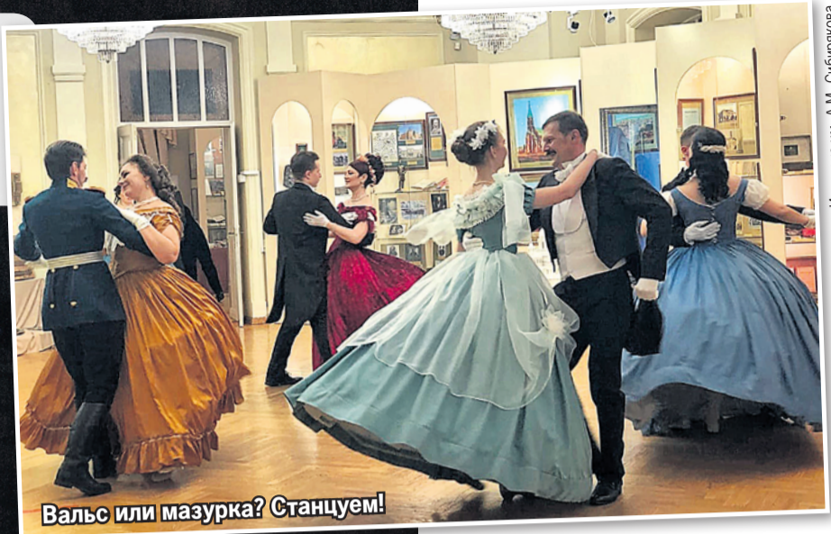
Вальс или мазурка? Станцуем!

«Ночь искусств» является продолжением таких акций, как «Ночь в музее», «Ночь в театре», «Библионочь», «Ночь музыки».