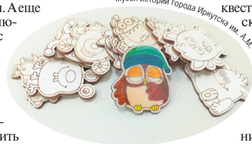
Музей истории города Иркутска им. А.М. Сибирякова

пас. Здесь и парадно-выходные дембельские кители или, как их называли, «парадки», и дембельские альбомы, и головные уборы, и ремни. Особый экспонат - воротник «матроса-дембеля 1976 года» с вышитым на нем номером приказа и пожеланиями от всех сослуживцев. В рамках «Ночи искусств» музейщики приготовили еще и квест «Жизнь солдатская» с интерактивными элементами: сбор вещмешка, надевание противогаза, сборка автомата, определение званий по погонам. Начало квестов в 12:00, 15:00, 17:00