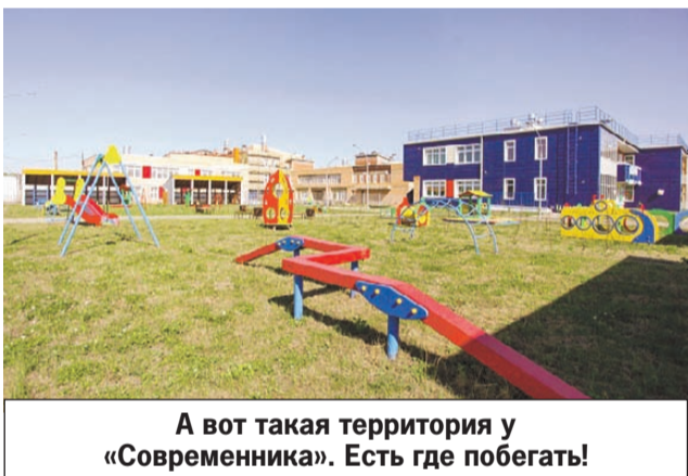
А вот такая территория у «Современника». Есть где побегать!