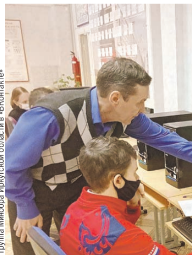
Группа Минобра Иркутской области в «ВКонтакте»