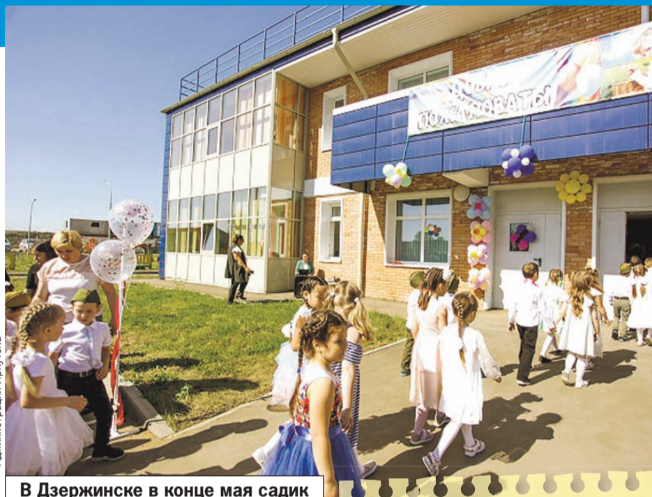
В Дзержинске в конце мая садик принял первых воспитанников.

Здание возвели буквально за год. Оно двухэтажное, рассчитанное на 11 групп, с актовым залом, спортивным