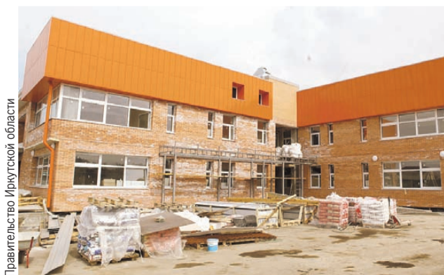
В Лесном стройка уже на финишной прямой.

Важный момент - здание обогревается за счет электрических конвекторов, и если вдруг зимой в поселке отключится свет, начнет работать дизельная электростанция. Холодно в помещении не будет.