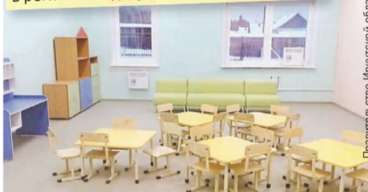
В поселке не хуже, чем в городе.

Будут строиться сады и в других территориях. К 2024 году для дошкольников в регионе создадут еще три тысячи мест.