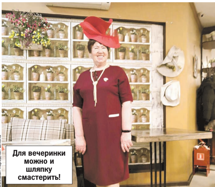
Высшая народная школа

А еще при Высшей народной школе есть союз волонтеров «Неугомонные». Пенсионеры сажают деревья, собирают гуманитарную помощь, ездят убирать от мусора берега Байкала и часто по выходным выбирают небольшие походы.