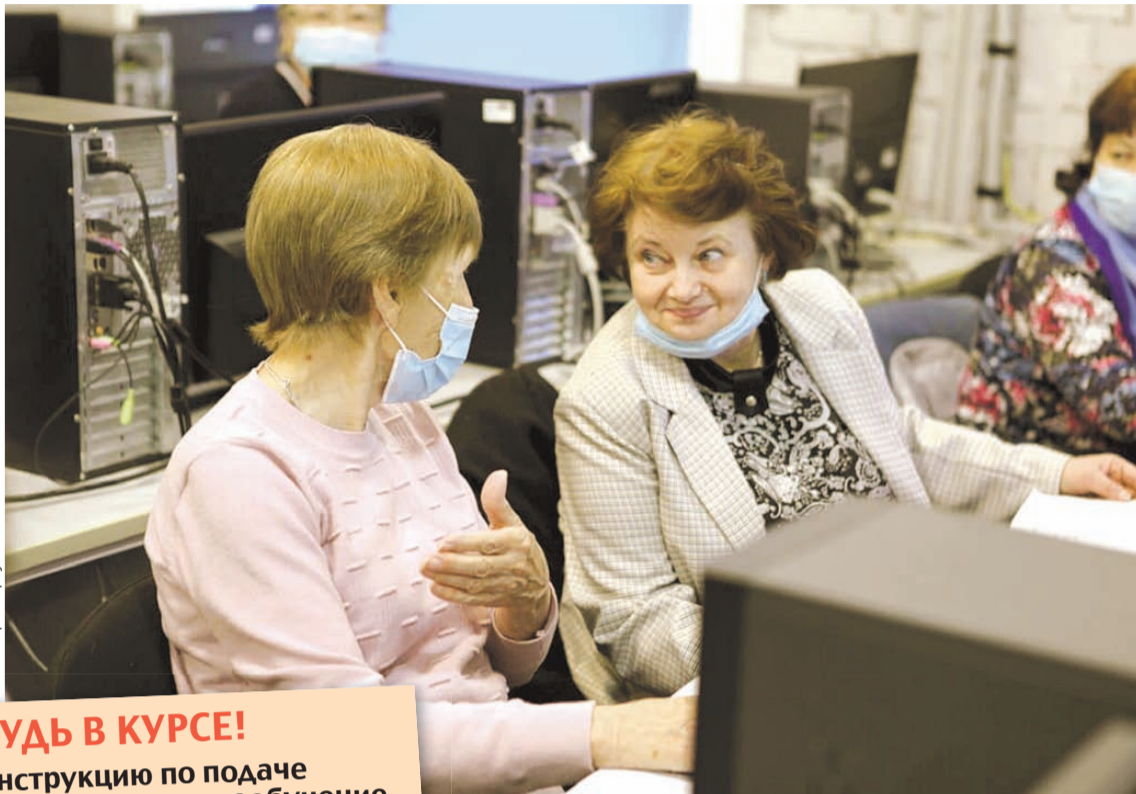
Сайт мэрии Иркутска

На данный момент федеральный проект рассчитан до 2024 года. Так что откладывать в долгий ящик подачу заявки не стоит. Тем более что видеoinструкции, как это сделать, есть на сайте Центра опережающей профессиональной подготовки Иркутской области. Сразу уточним, для этого необходимо нали-