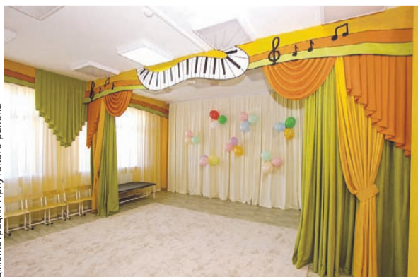
Особое внимание эстетике!