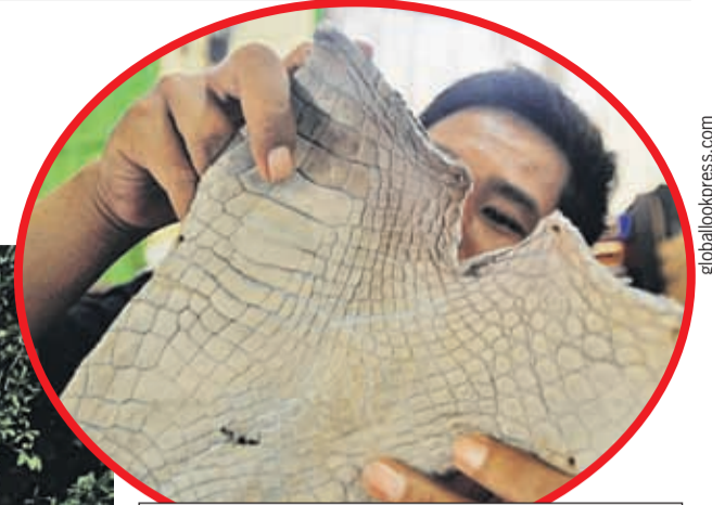
Кожа крокодила - ходовой товар. Очень просто нарваться на плохое качество или неприлично задранный цену.

Шоу крокодилов. Вы будете смотреть на полудохлых животных (ежемесячно в магазине умирает по 2 - 3 крокодила и происходит один несчастный случай с дрессировщиком на шоу: укусил за голову или прокусил руку. Крокодилы голодные и озлобленные), а потом вас раскрутят на покупку дешевого ремня по цене самого лучшего. Пару лет назад вы уже были на Пхукете и были довольны своими покупками из кожи крокодила? Об этом, пожалуйста, тоже забудьте. На Пхукете есть только один магазин со всей необходимой документацией. Но мы с чистым и легальным магазином не работаем. Его владелец (кстати, наш соотечественник) пару лет назад перестал платить дань туроператорам. Он не повысил цены, наличие документов позволяет работать с европейскими и американскими туристами. А нашим остается покупать ремни из клееной кожи крокодила по цене цельного куска.