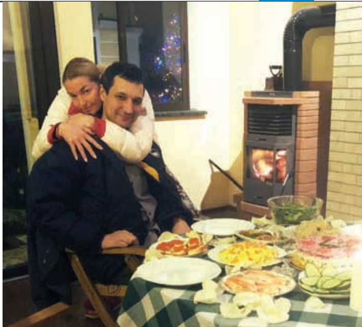
Балерина постоянно выкладывает фото с новым возлюбленным: как он дарит ей цветы, Маубаш, как они вместе ужинают...

- Неважно, сколько денег. Главное - большое сердце.