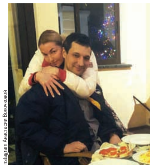
Instagram Анастасии Волочковой