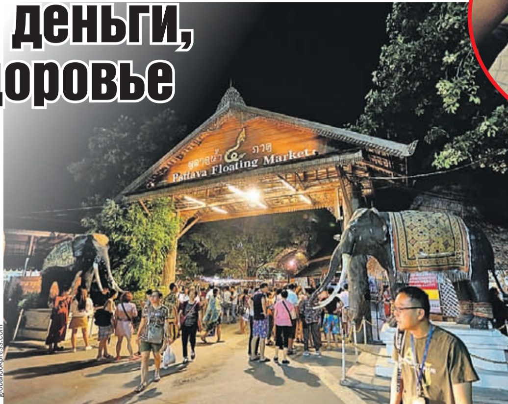
В Паттайе шумная туристическая тусовка и оживленная торговля азиатскими сувенирами.

После того как вы приземлитесь в международном аэропорту Пхукета, вас встретит наш трансфермен. Кстати, это самая собачья, низкооплачиваемая работа. Спишь по три часа и постоянно приходится трястись в автобусах, встречая и провожая гостей, а получаешь по 500 долларов в месяц. Затем вас привозят в отель, расселяют и объявляют о встрече с вашим отельным гидом. Конечно, вы спуститесь на встречу, ведь вам так интересно узнать о том, что за страна и ку-