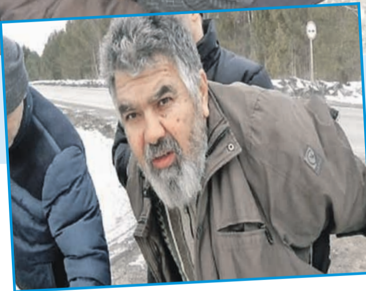
ГУ МВД Свердловской области

Когда лжекиллеры скрутили заказчика на месте преступления, он долго не мог поверить - уж больно мастерски оперативники втерлись к нему в доверие.