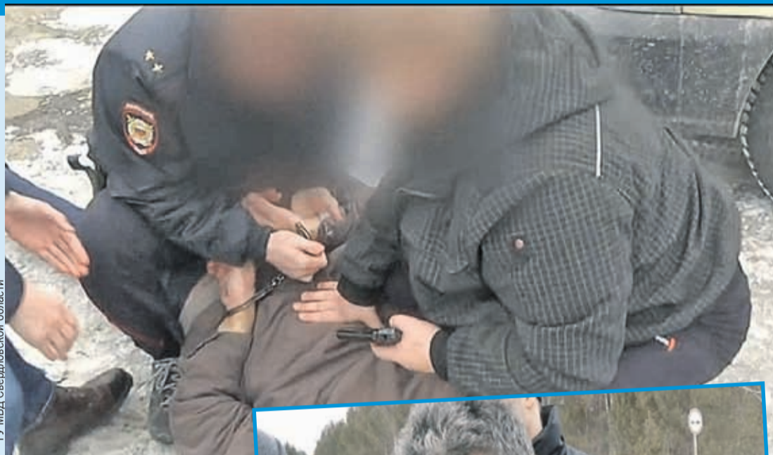
ГУ МВД Свердловской области

Когда лжекиллеры скрутили заказчика на месте преступления, он долго не мог поверить - уж больно мастерски оперативники втерлись к нему в доверие.