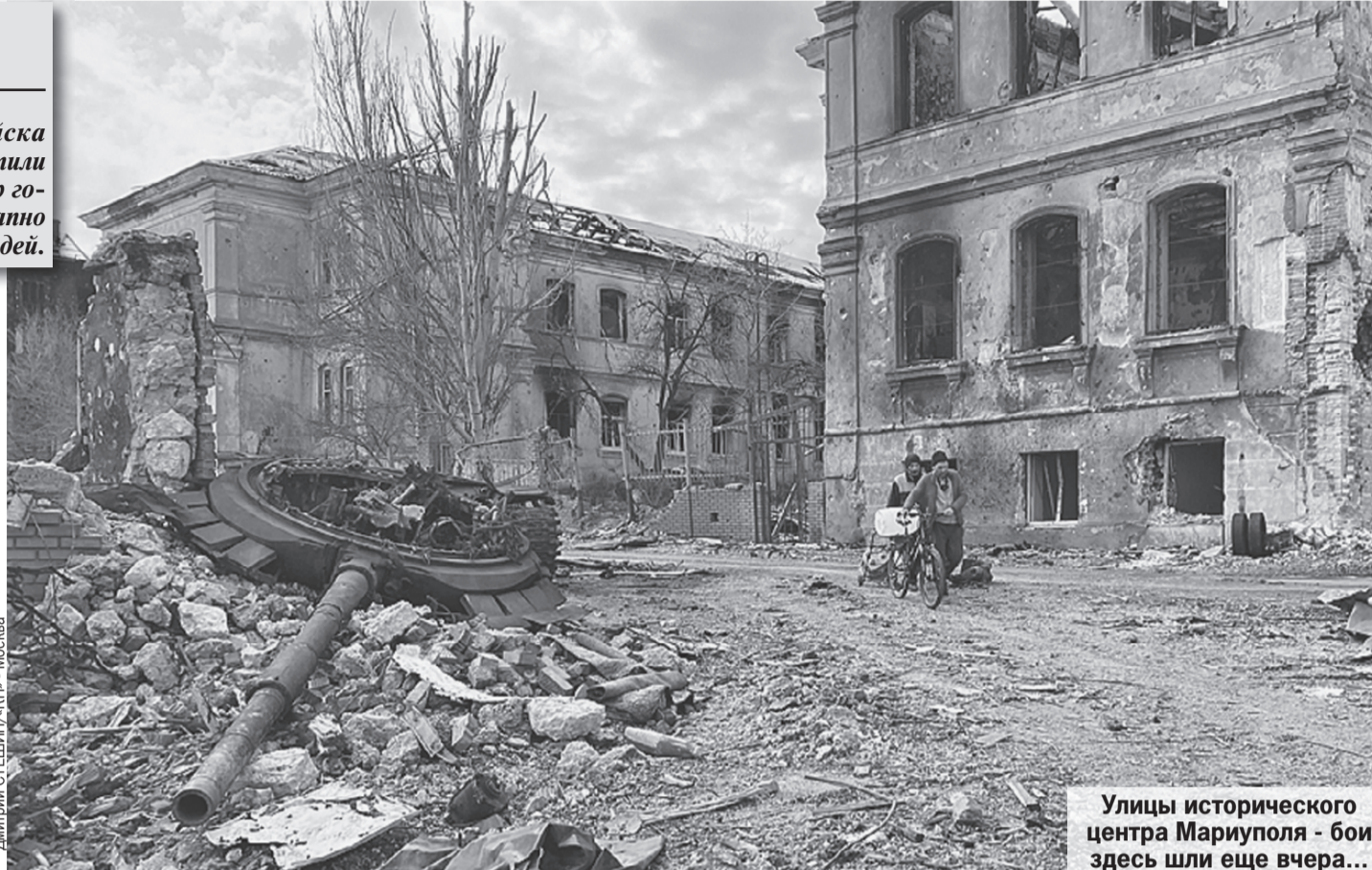
Улицы исторического центра Мариуполя - бои здесь шли еще вчера...

Спрашиваю, что за люди. Татьяна показывает: этот чиновник, тот -