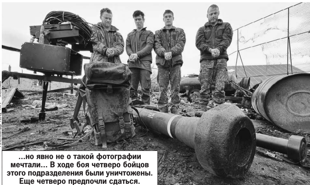
...но явно не о такой фотографии мечтали... В ходе боя четверо бойцов этого подразделения были уничтожены. Еще четверо предпочли сдаться.