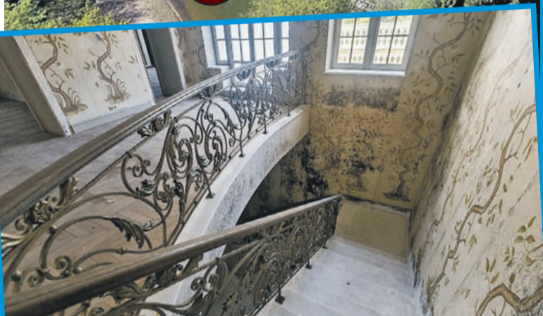
...но из-за ошибок при строительстве главный дом изнутри покрылся жуткой плесенью.

можно пройти к участку. Там, правда, упираешься в глухой пятиметровый каменный забор, обвешанный камерами. Перед тобой ворота и стоящий окнами на улицу дом прислуги (400 квадратных метров + гараж на четыре машины).