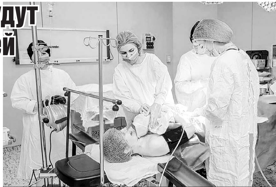
Провести «бархатные роды» можно только во время плановой операции кесарева сечения.

Кстати, такой формат операции бесплатный. Несколько совместных родов медички уже провели. По словам заведующей, все они завершились благополучно и с невероятной