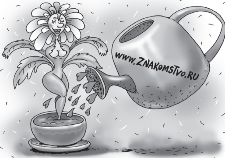
Катерина МАРТИНОВИЧ/«КП» - Москва