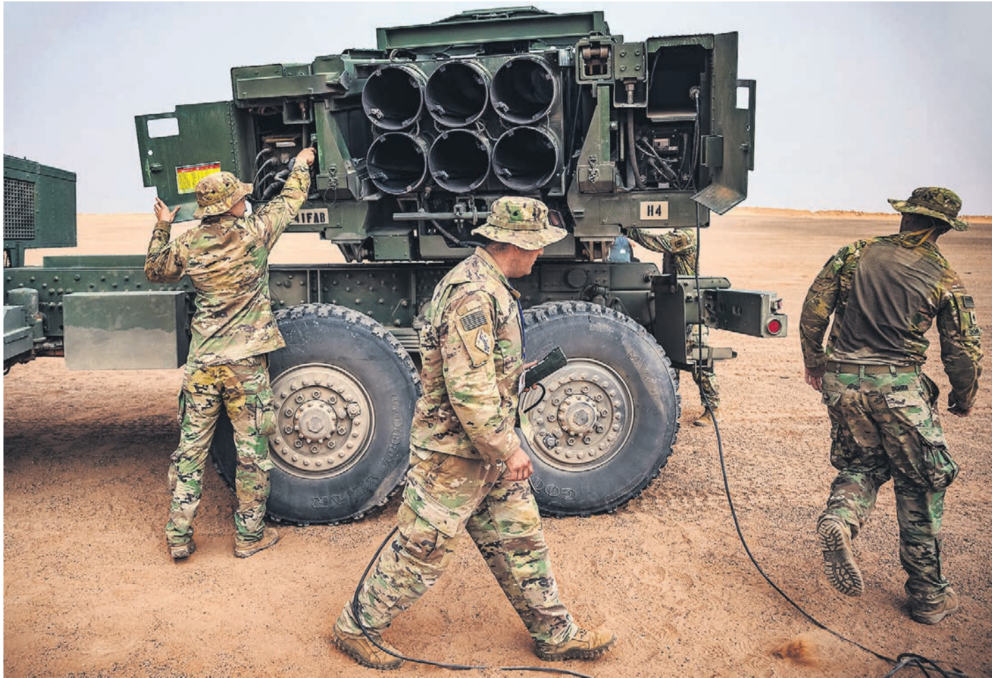
Поставка на Украину американских реактивных систем залпового огня HIMARS серьезно повысит градус противостояния в зоне конфликта и может привести к его распространению на третьи страны.

Однако вскоре информированные собеседники американских СМИ в администрации Байдена стали уточнять: РСЗО могут