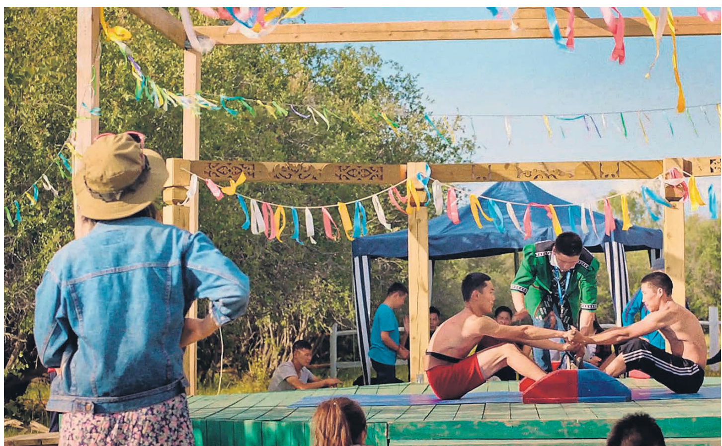
«Джулур» оказался самобытен своей спортивной фактурой, но визуально и сюжетно неоригинален

В «Рокки IV» (1985), поставленном самим Сталлоне на пике тогдашней холодной вой-