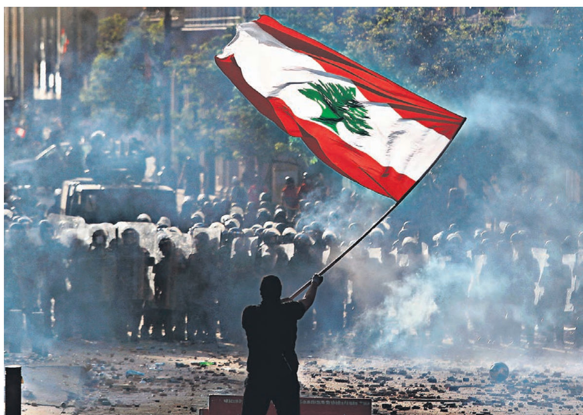
Демонстранты, требующие смены власти и честного расследования взрывов в порту Бейрута, в субботу захватили здания четырех министерств и нескольких банков

Выступление премьер-министра Ливана все арабские телеканалы транслировали на фоне кадров столкновений в Бейруте. Тысячи человек вышли в субботу на улицу, требуя смены власти и честного расследования взрывов. Демонстранты построили виселицы, к которым прицепили картонные фигуры президента Мишеля Ауна, премьер-министра Хасана Диаба, спикера парламента Набиха Берри, а также лидера шитского движения «Хезболла» Хасана Насраллы. «Народ хочет мести», «Мое правительство убило мой народ!» — выкрикивали демонстранты, поднимая над головой портреты погибших в результате взрывов. Очень быстро протесты переросли в столкновения с силами безопасности. Толпа пыталась прорваться к парламенту, были захвачены здания четырех министерств и нескольких банков. В субботних беспорядках пострадали свыше 700 человек, из них около 100 представителей сил правопорядка, один из правоохранителей был