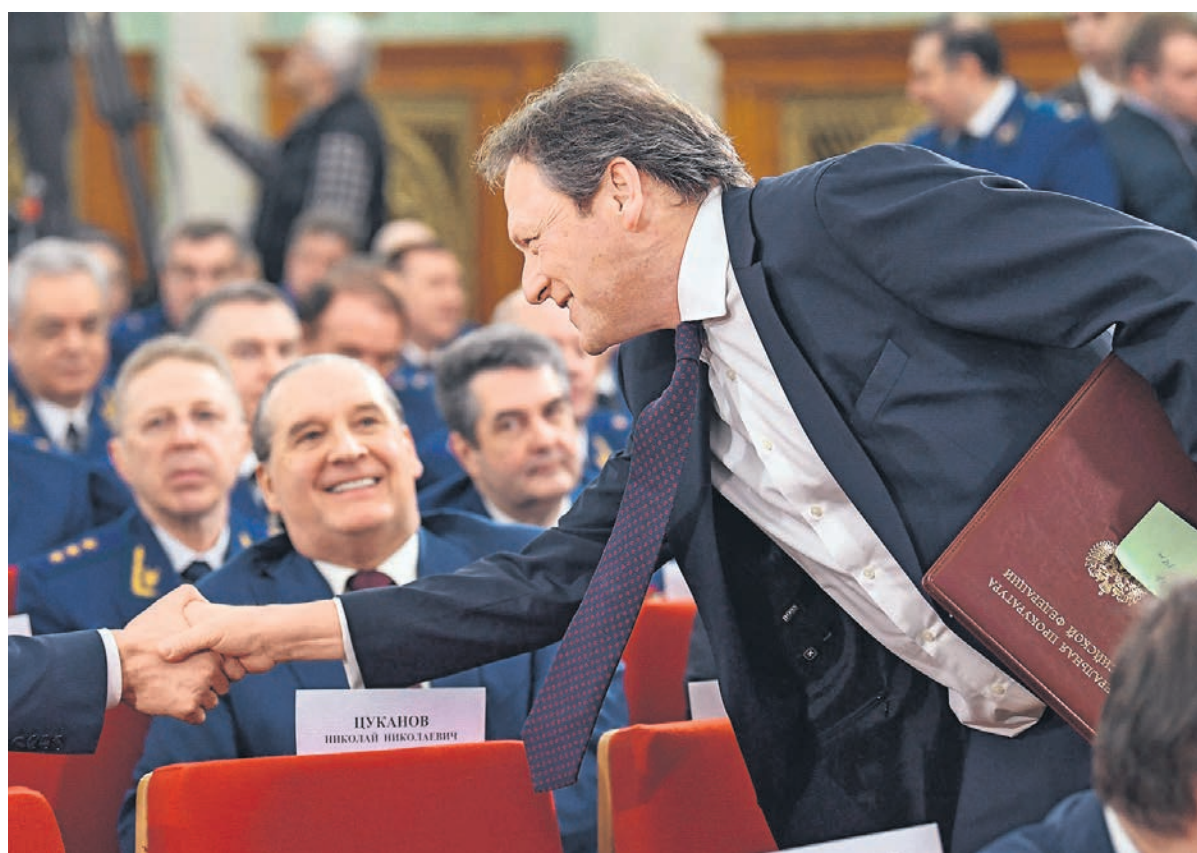
Борис Титов доволен поддержкой прокуратуры в вопросах защиты бизнеса

В органах военной прокуратуры, отдельно отметил Александр Буксман, рассмотрено 13 обращений предпринимателей, связанных с неисполнением обязательств по оплате произведенных работ со стороны заказчиков — ФГУП, под-