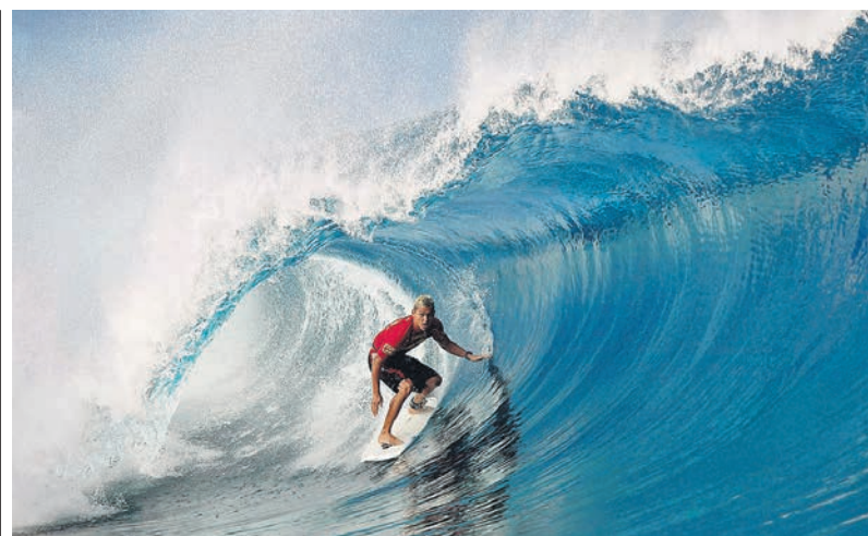
Возможное решение оргкомитета Игр-2024 перенести соревнования по серфингу на Таити может привести его к конфликту с МОК

Оргкомитет летних Игр 2024 года, которые пройдут в Париже, может принять решение о проведении соревнований по серфингу, которые дебютируют в олимпийской программе уже в 2020 году в Токио, на Таити. То есть примерно в 16 тыс. км от французской столицы. Против этой инициативы ранее уже выступал Международный олимпийский комитет (МОК), президент которого Томас Бах призвал все-таки придерживаться концепции компактных Игр. Но если французская сторона будет упорствовать, оргкомитет и МОК окажутся в состоянии конфликта.