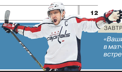
12 ЗАВТРА В НОМЕРЕ Хоккей

«Вашингтон» Александра Овечкина в матче регулярного чемпионата НХЛ встречался на выезде с «Сан-Хосе»