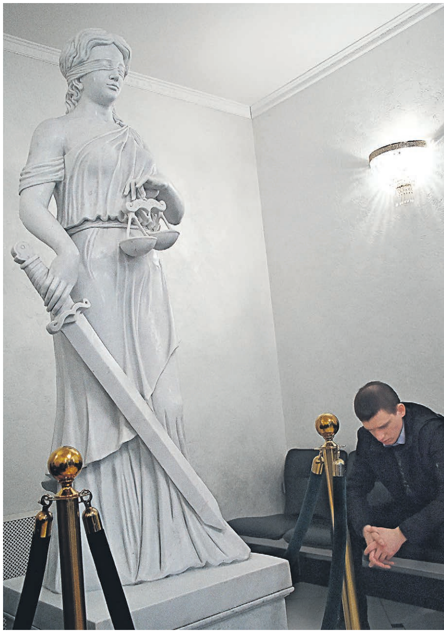
Новый специальный арбитражный суд сможет обеспечить промышленным предприятиям быстрое и конфиденциальное разбирательство

Законопроект предполагает, что в арбитраж при «Ростехе» можно будет передать споры между организациями, работающими в сфере промышленности. Отдельно описана возмож-