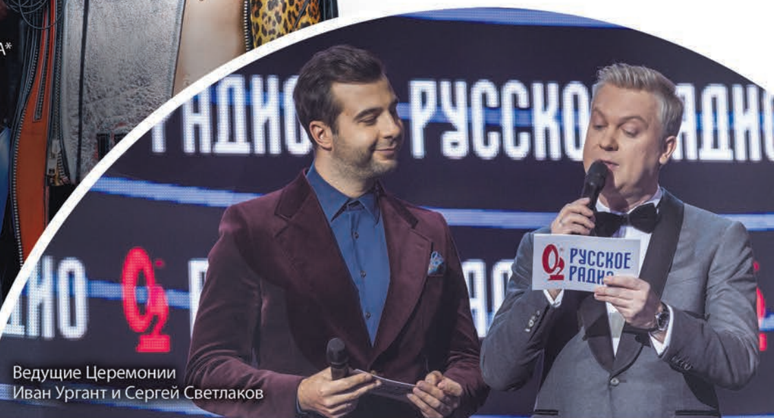
Ведущие Церемонии Иван Ургант и Сергей Светлаков